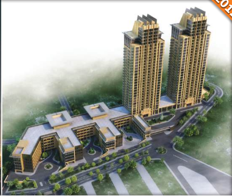
Maslak, İstanbul / Türkiye