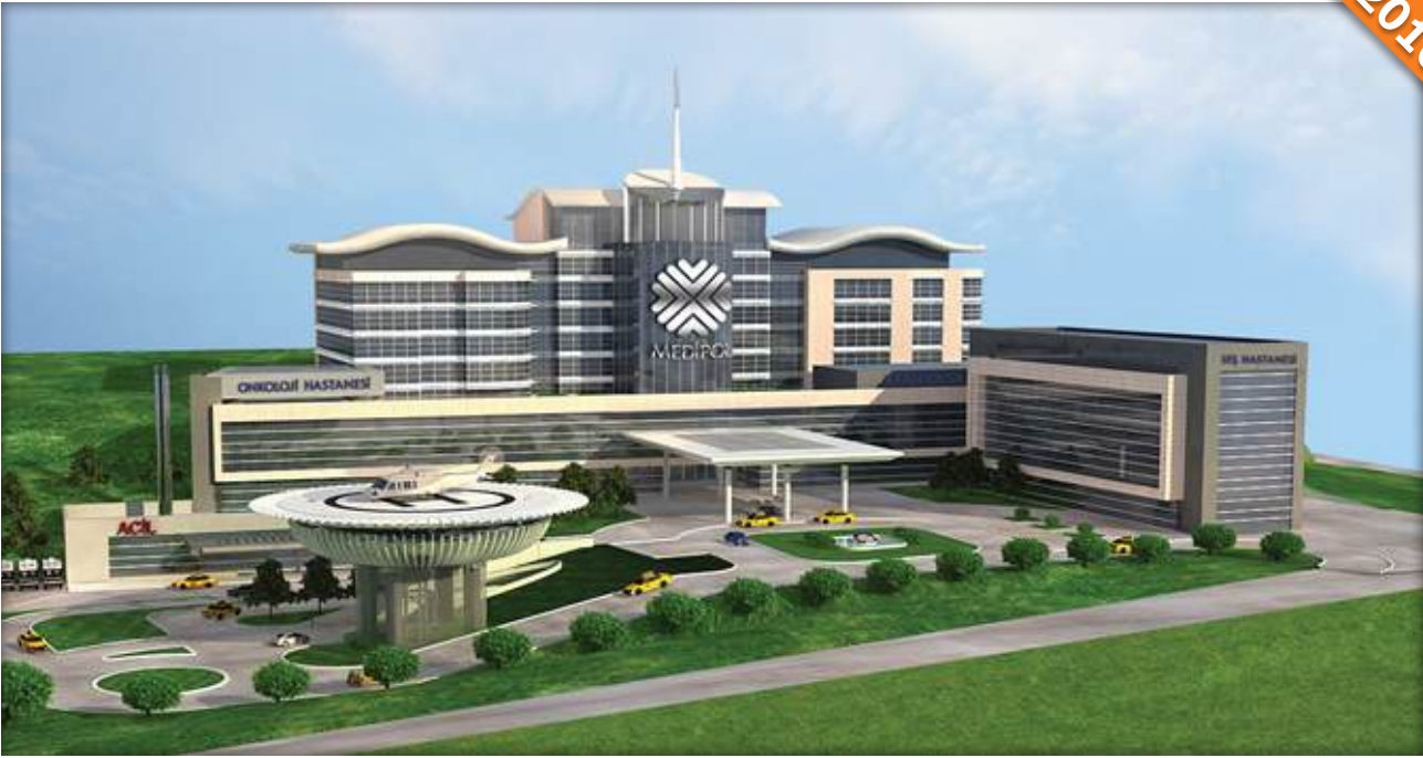
Bağcılar, İstanbul / Türkiye