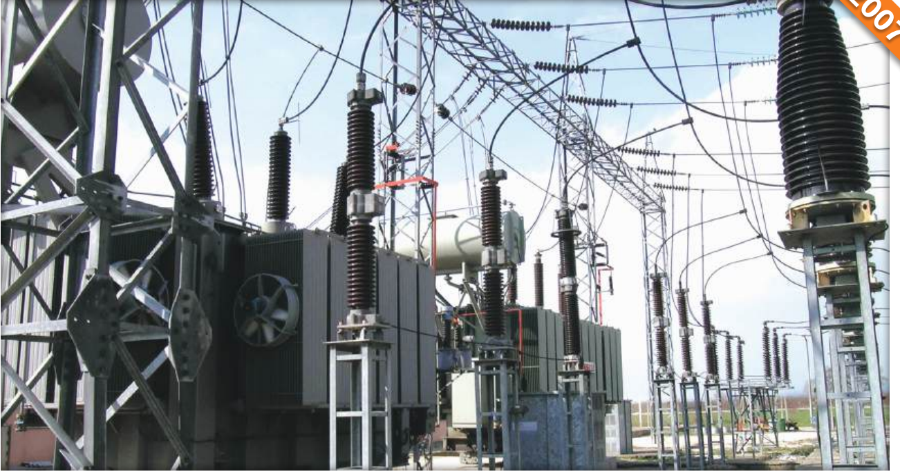
Demirtaş, Bursa / Türkiye