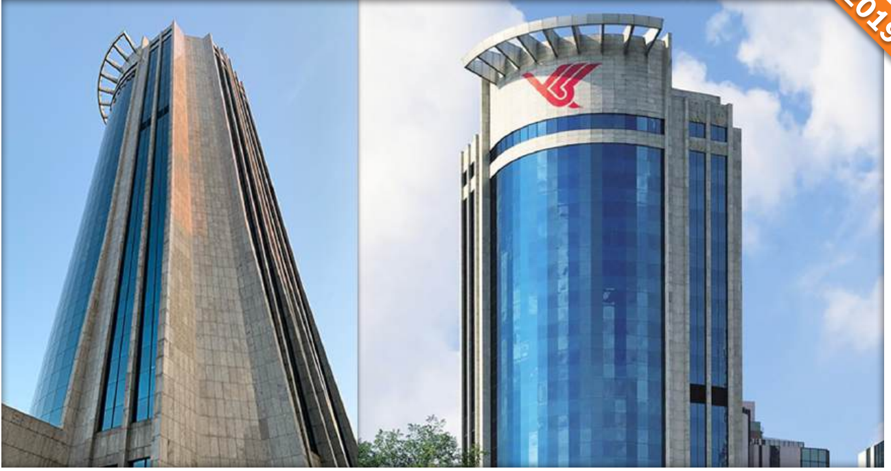
Levent, İstanbul / Türkiye