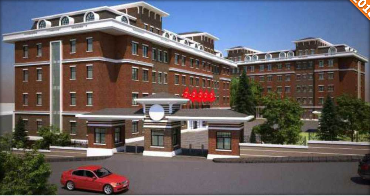
Çengelköy, İstanbul / Türkiye