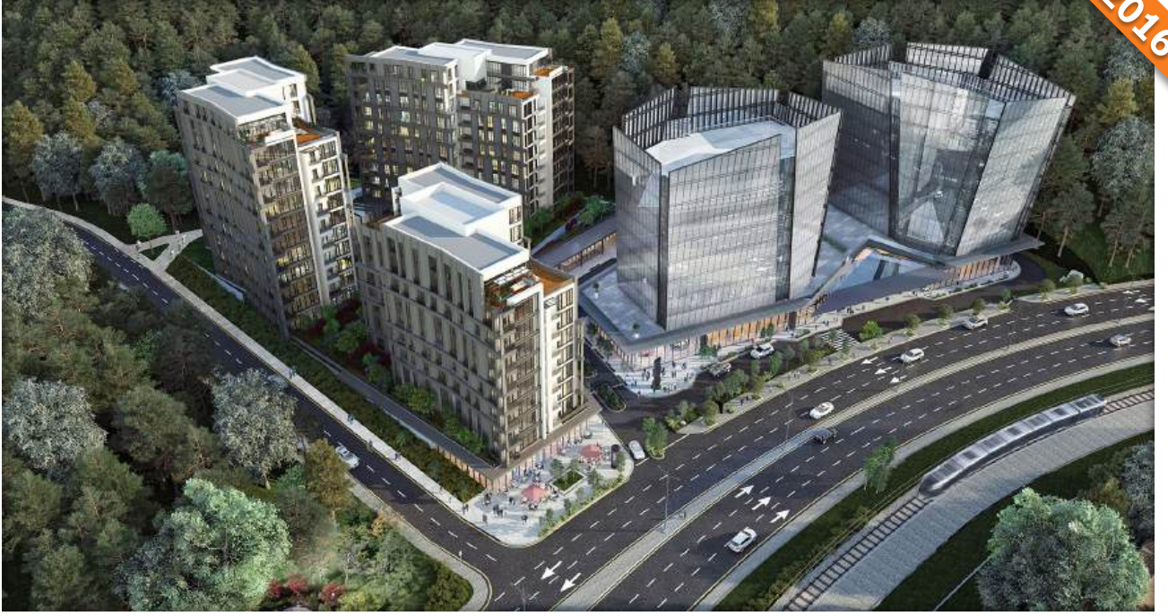
Sarıyer, İstanbul / Türkiye