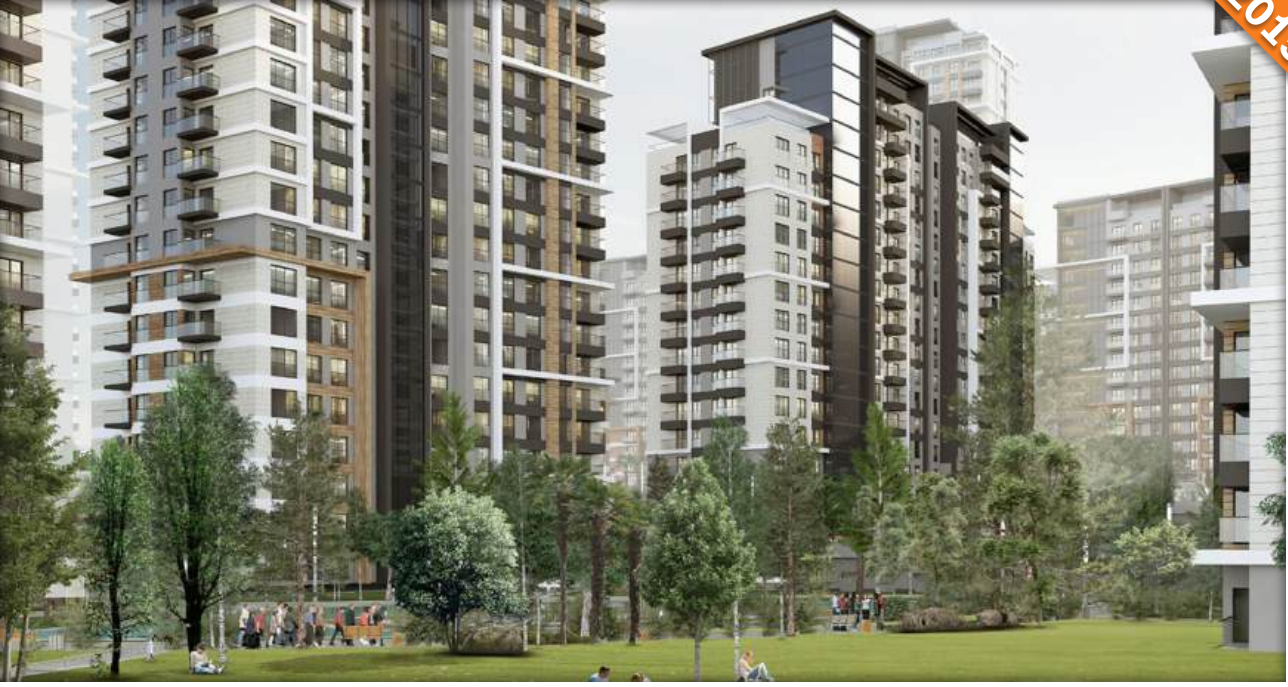
Güneşli, İstanbul / Türkiye