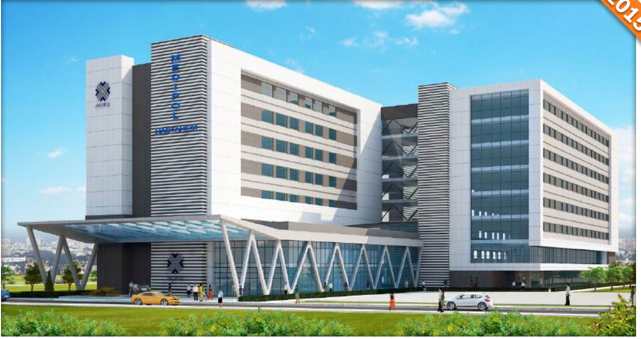
Yenibosna, İstanbul / Türkiye