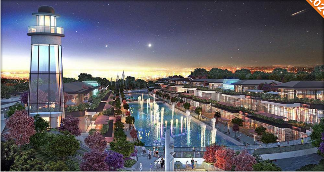
Tashkent / Özbekistan