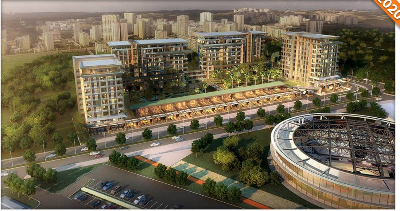
Başakşehir, İstanbul / Türkiye