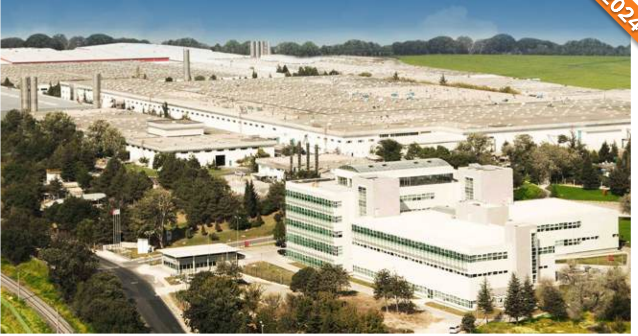
Çerkezköy, OSB-Tekirdağ / Türkiye