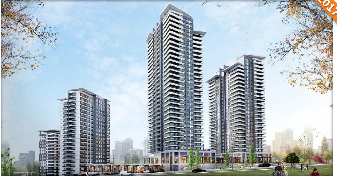
Küçükçekmece, İstanbul / Türkiye