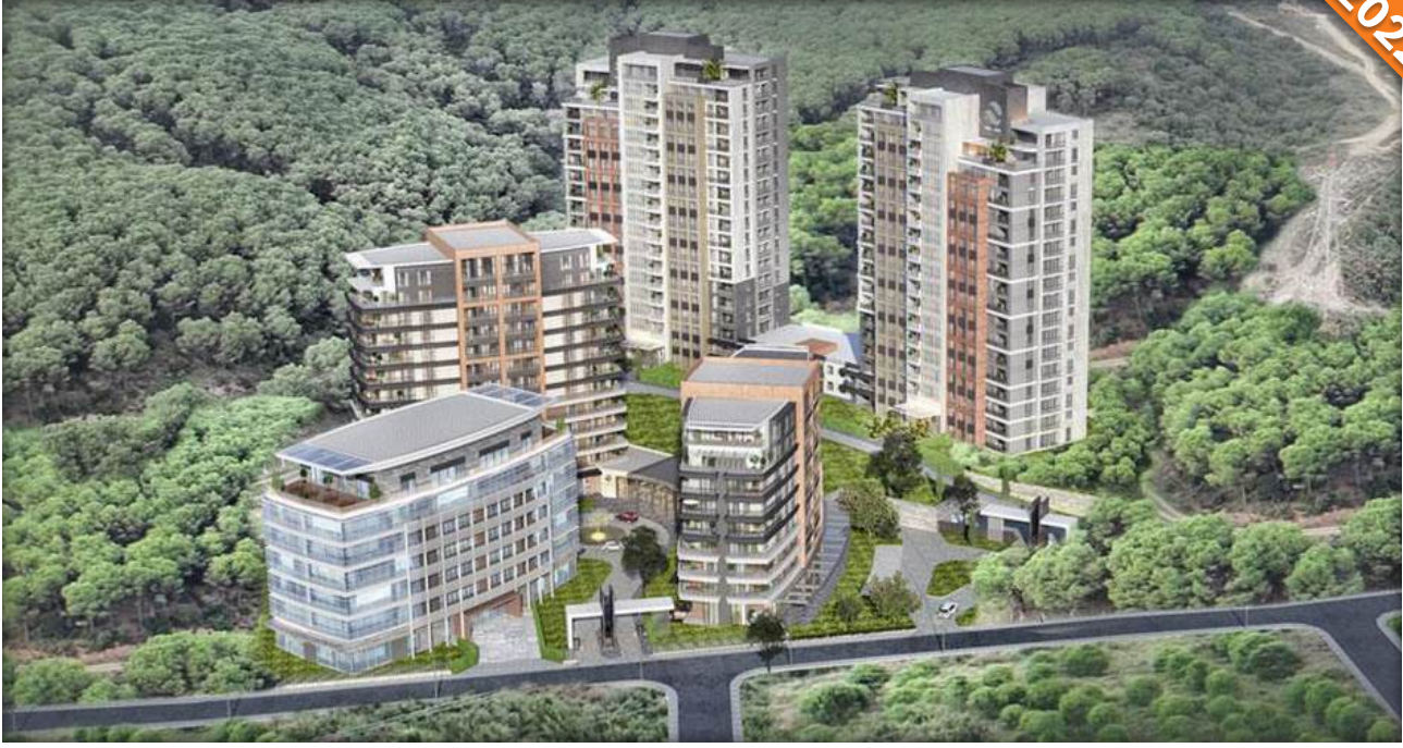
Sarıyer, İstanbul / Türkiye