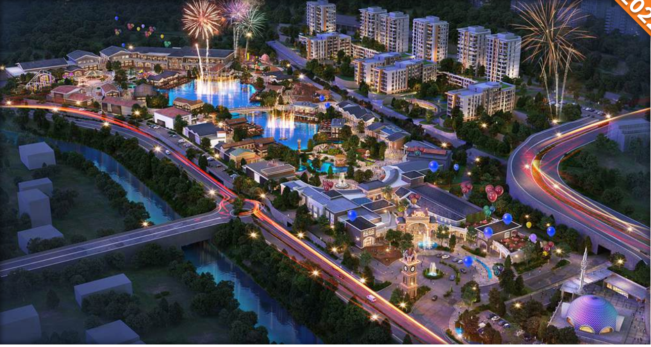
Küçükçekmece, İstanbul / Türkiye