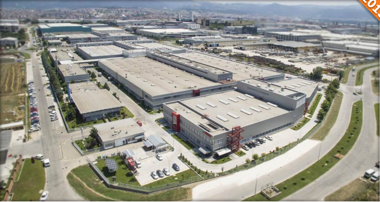
Bursa OSB, Bursa / Türkiye