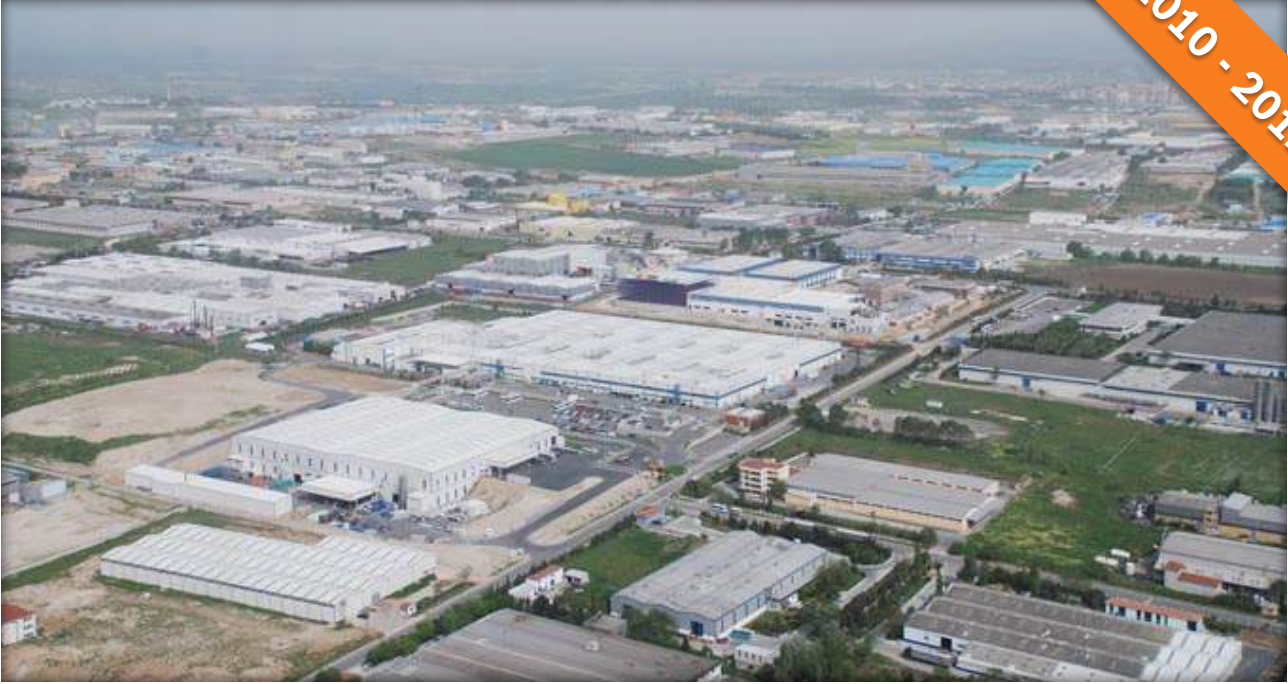
Çerkezköy, Tekirdağ / Türkiye