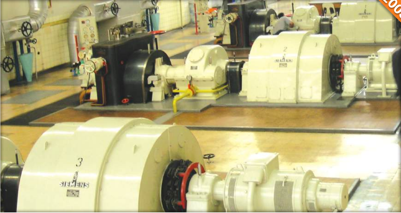
Çumra, Konya / Türkiye