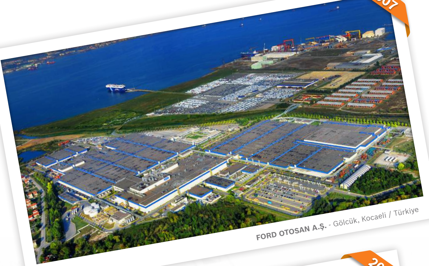
FORD OTOSAN A.Ş. - Gölcük, Kocaeli / Türkiye