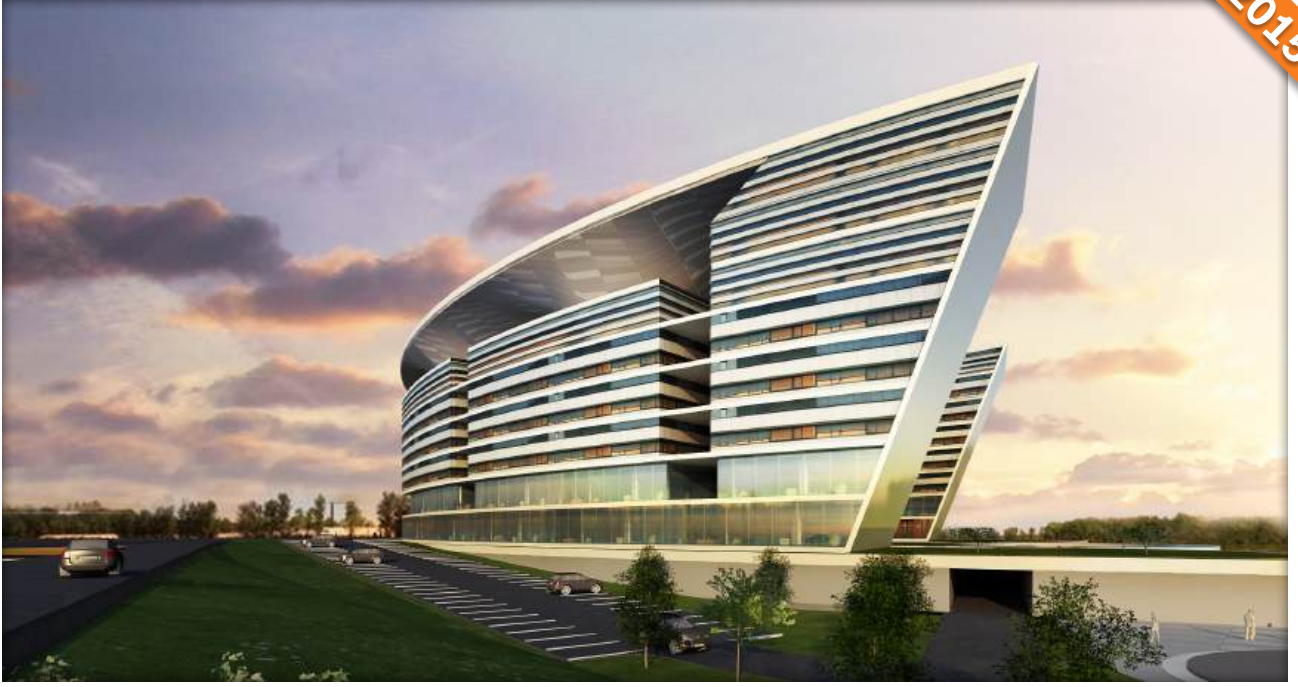
Kavacık, İstanbul / Türkiye