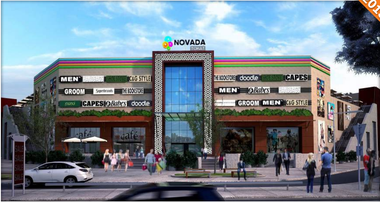
Tokat / Türkiye