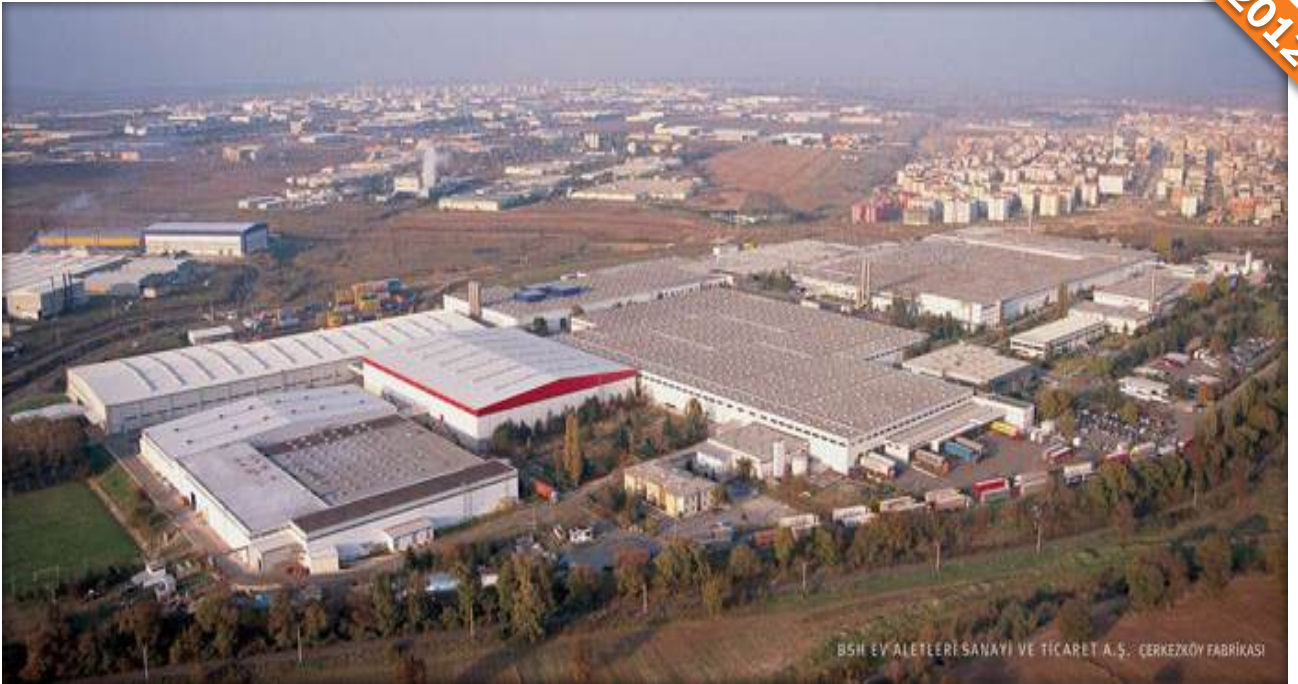
BŞH EV ALETLERİ SANAYİ VE TİCARET A.Ş. - ÇERKEZKÖY FABRİKASI