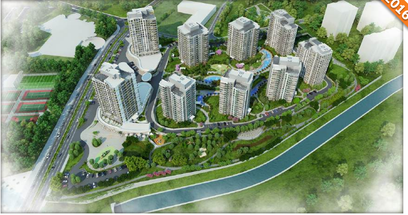
Başakşehir, İstanbul / Türkiye