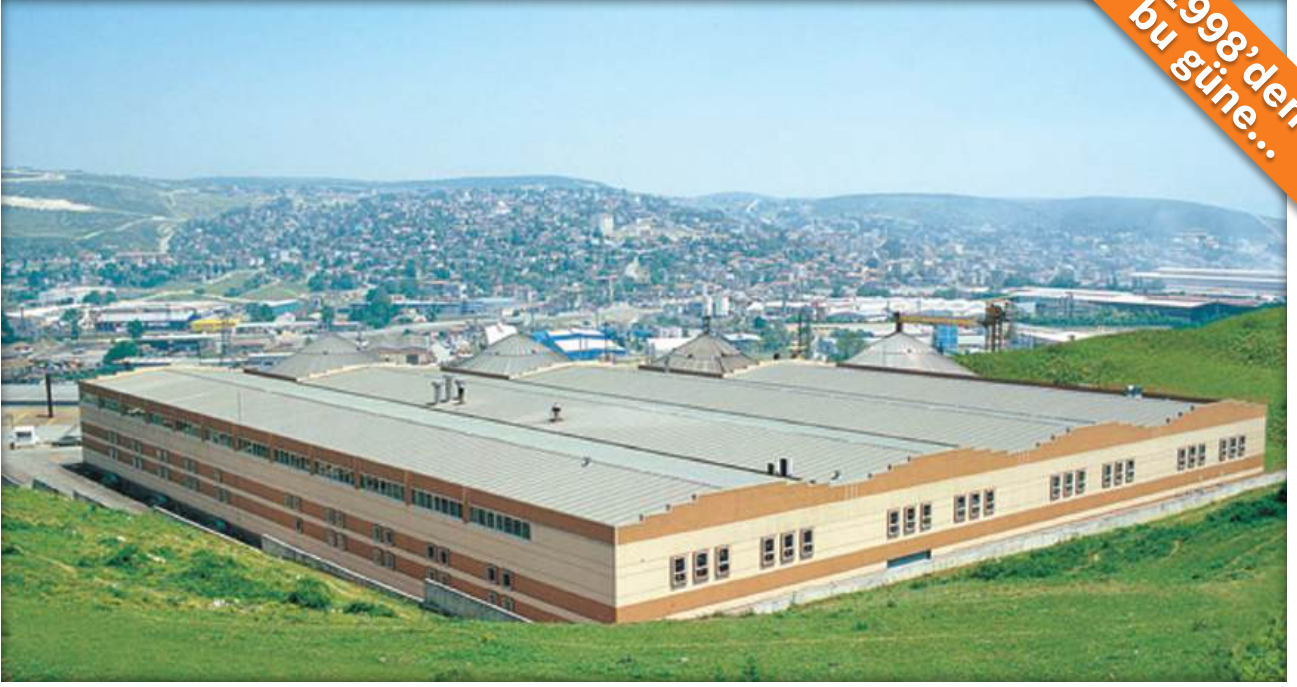
DOSB Gebze, Kocaeli / Türkiye