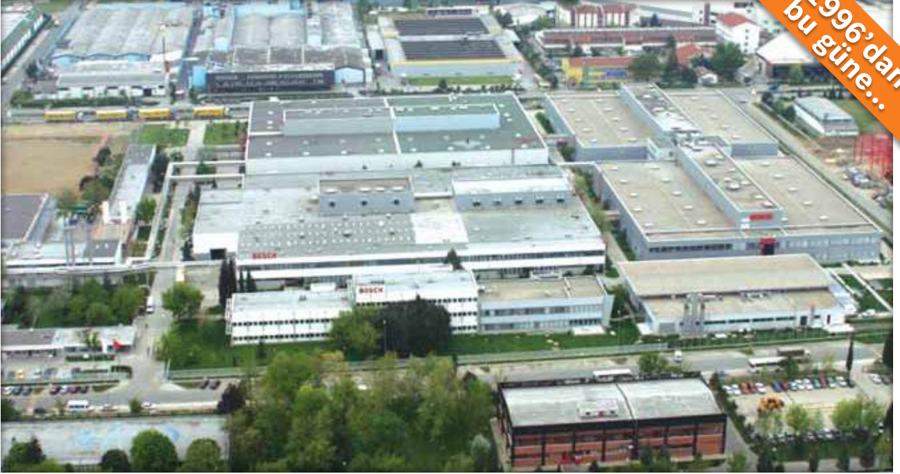
OSB Bursa / Türkiye