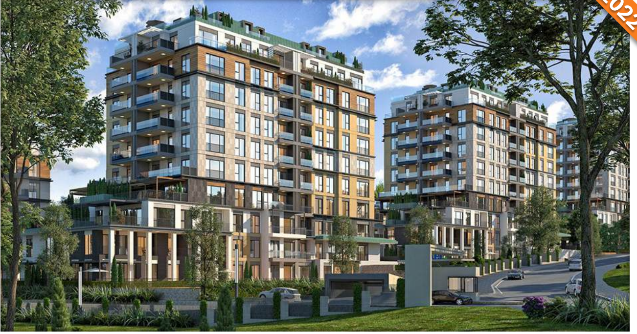
Başakşehir, İstanbul / Türkiye