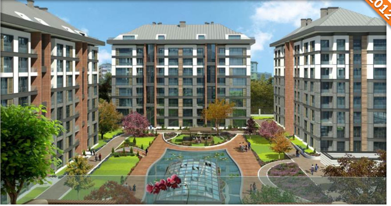
Florya, İstanbul / Türkiye