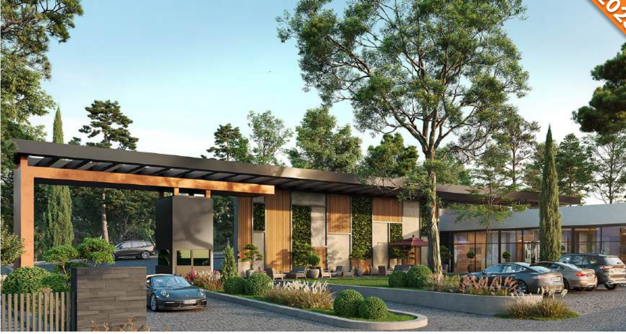
Büyüçekmece, İstanbul / Türkiye