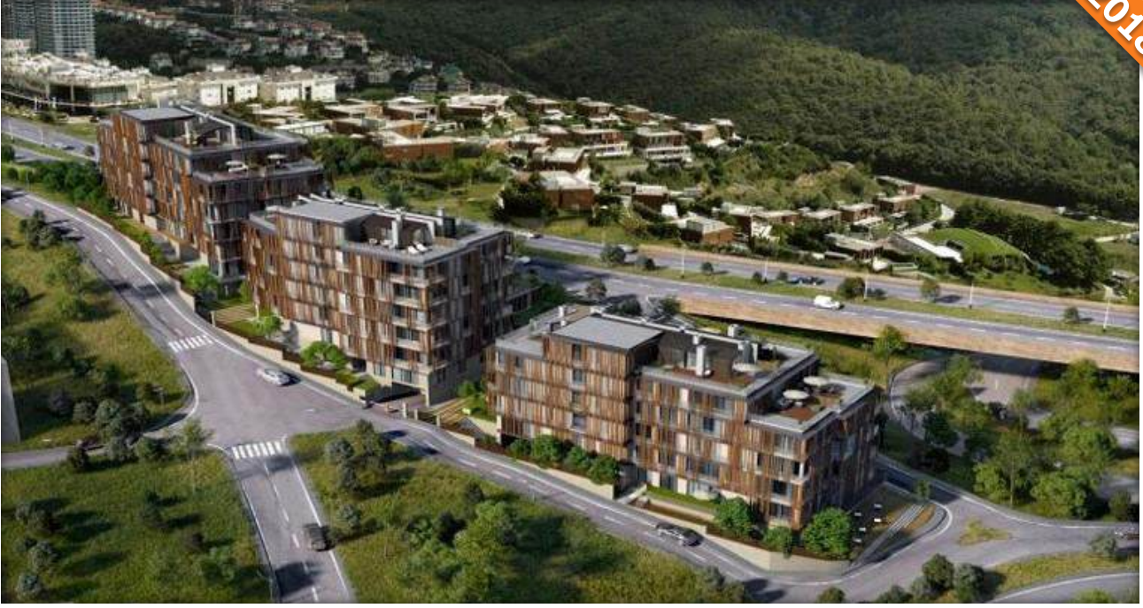
Çubuklu, Beykoz, İstanbul / Türkiye