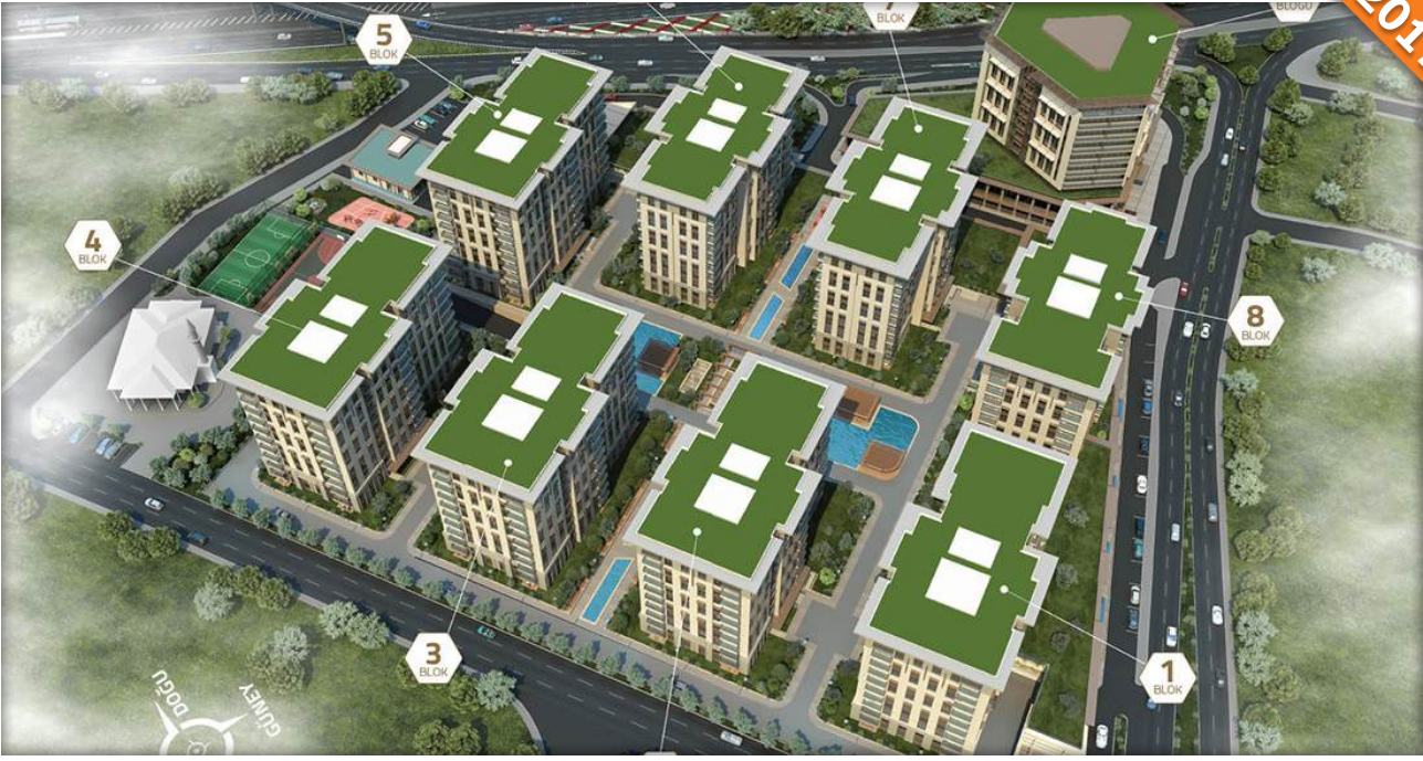
Zeytinburnu, İstanbul / Türkiye