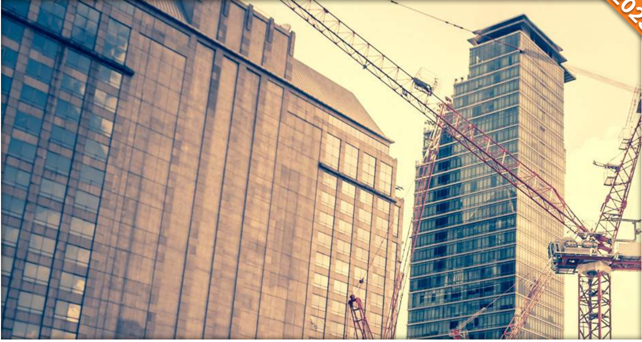
Kahta, Adıyaman / Türkiye