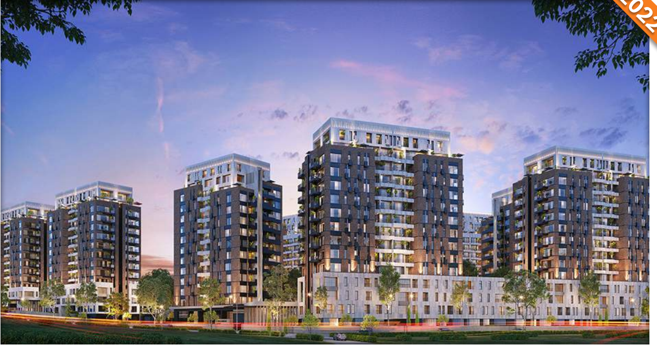
Kartal, İstanbul / Türkiye