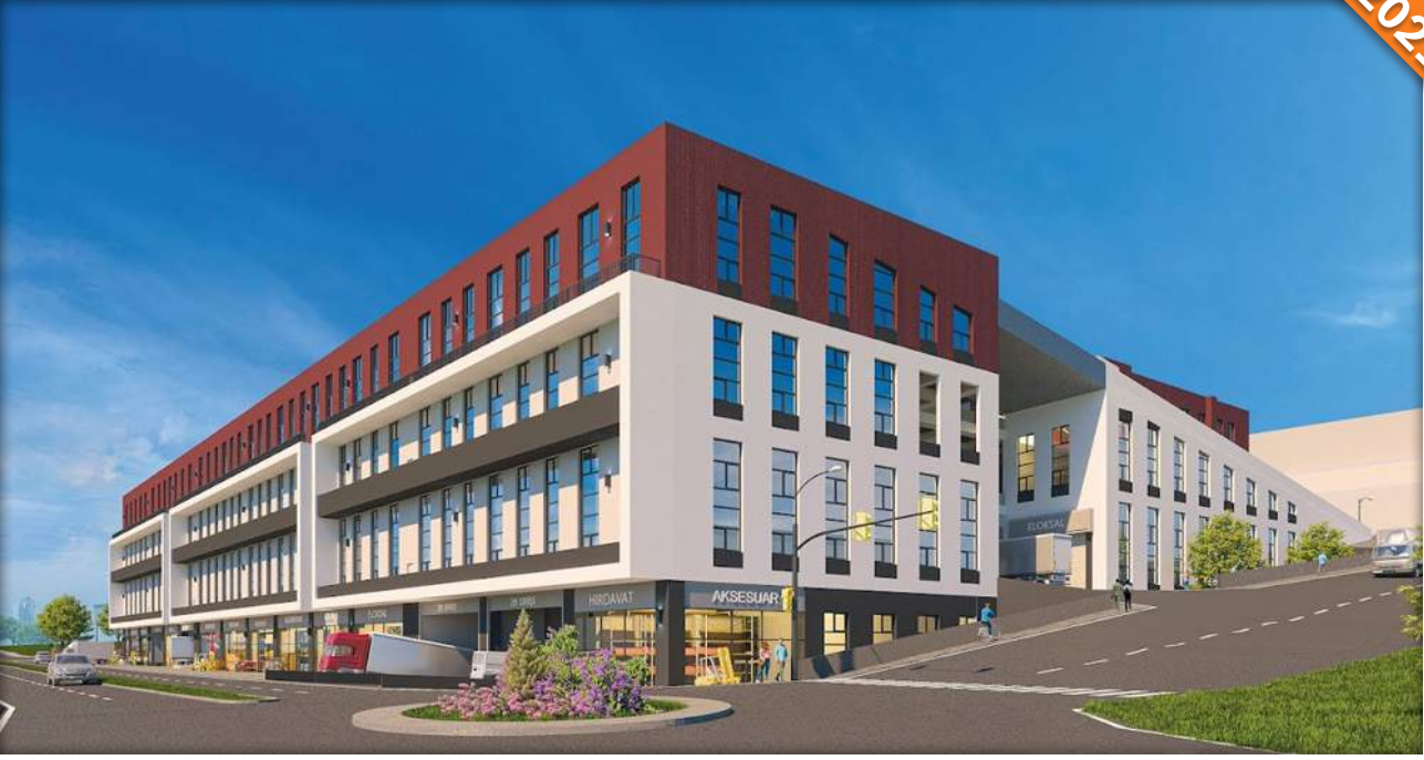
Hadimköy, İstanbul / Türkiye