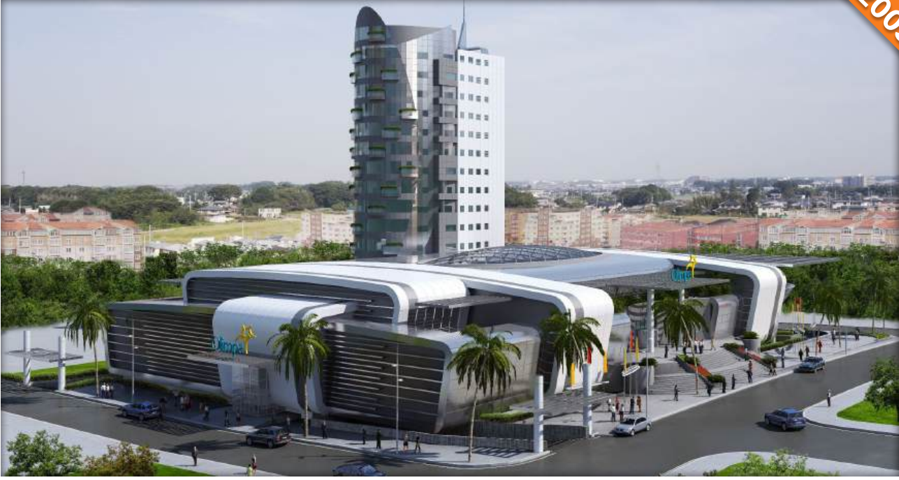
Başakşehir, İstanbul / Türkiye