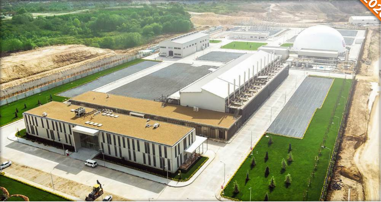
Silivri, İstanbul / Türkiye