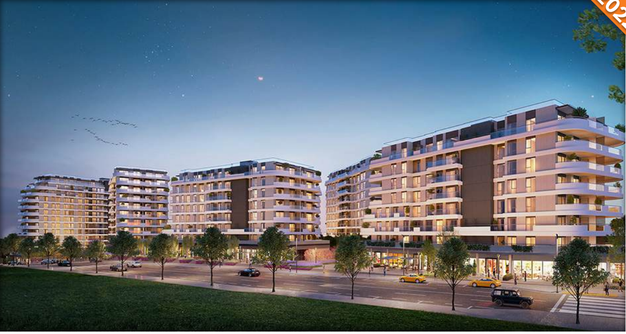
Kartal, İstanbul / Türkiye