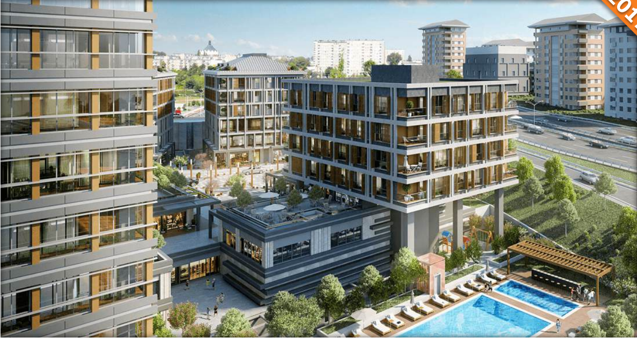
Kadıköy, İstanbul / Türkiye