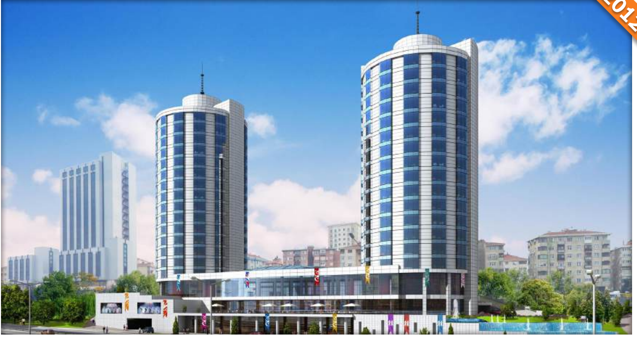
Kadıköy, İstanbul / Türkiye