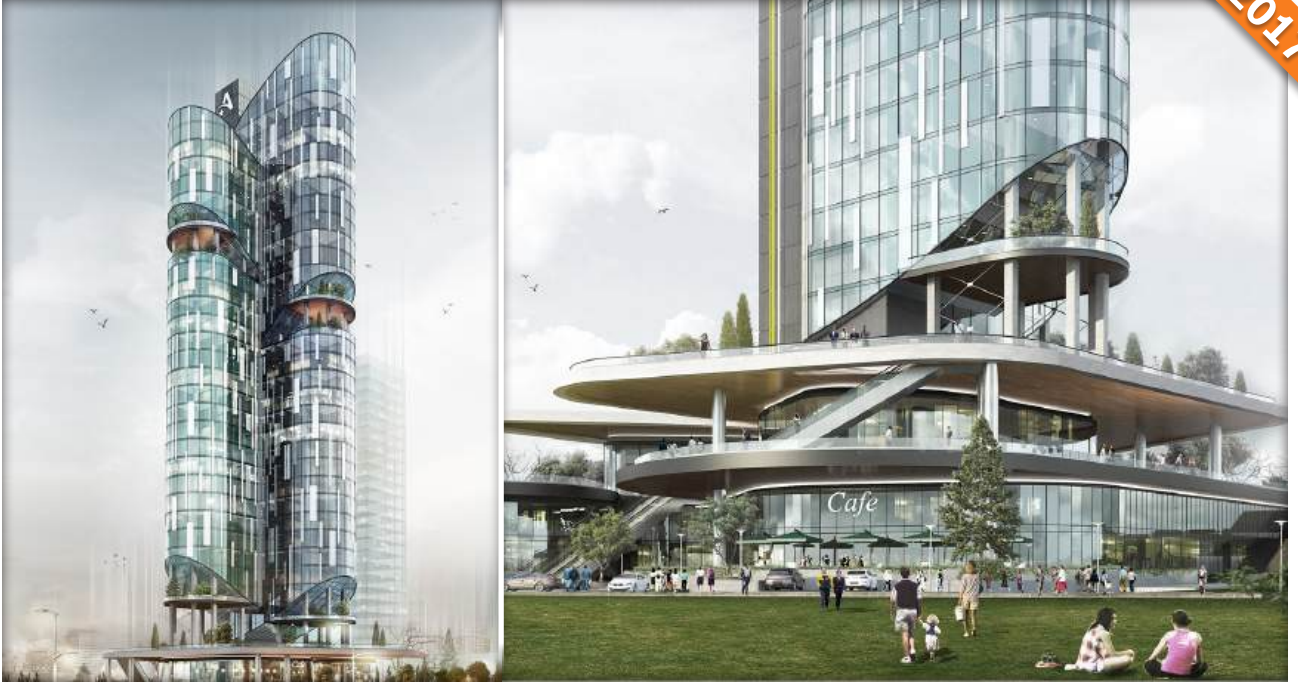
Ataşehir, İstanbul / Türkiye