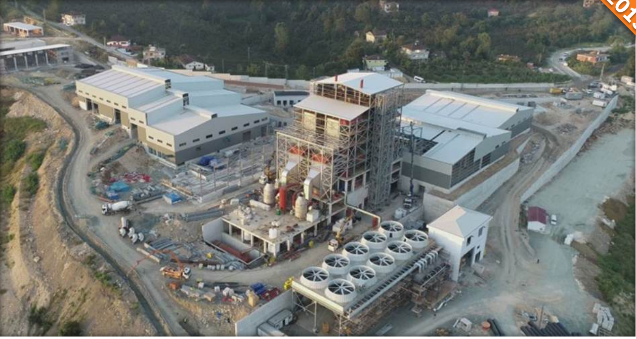
Riva, İstanbul / Türkiye