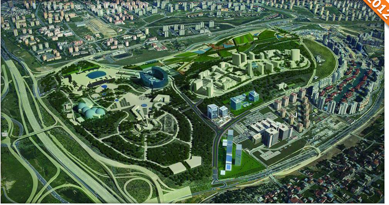
Halkalı, İstanbul / Türkiye