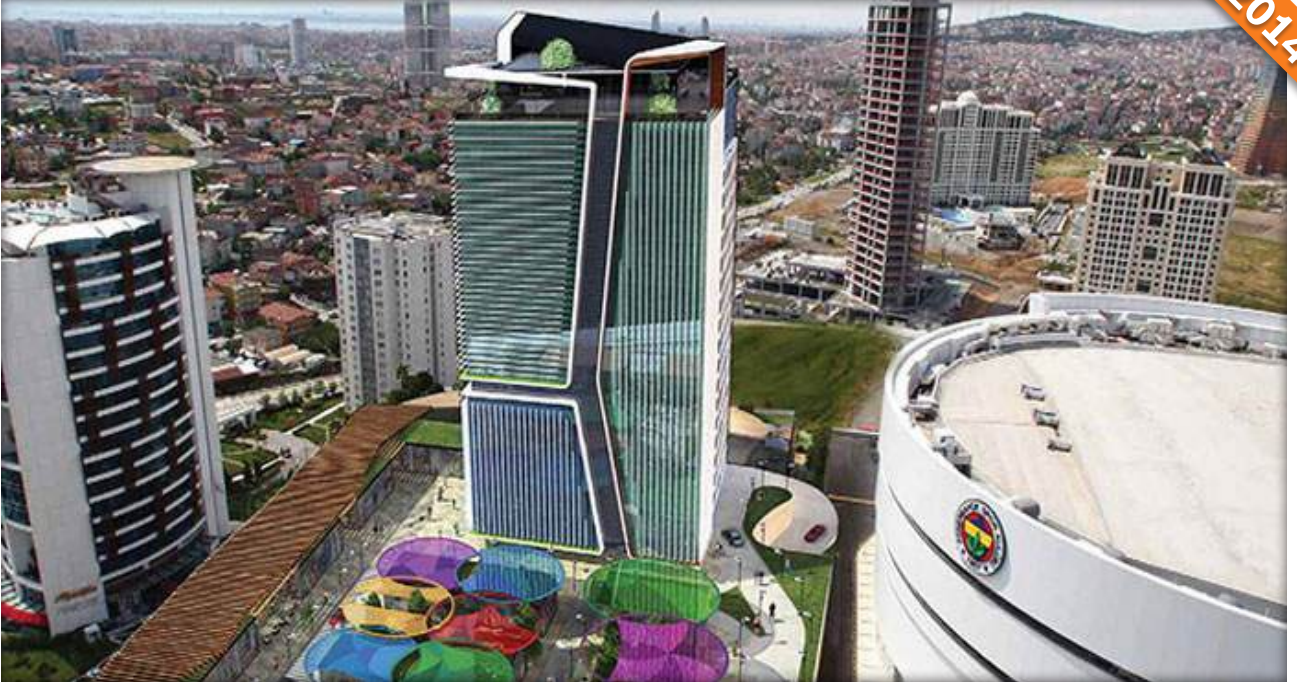
Ataşehir, İstanbul / Türkiye