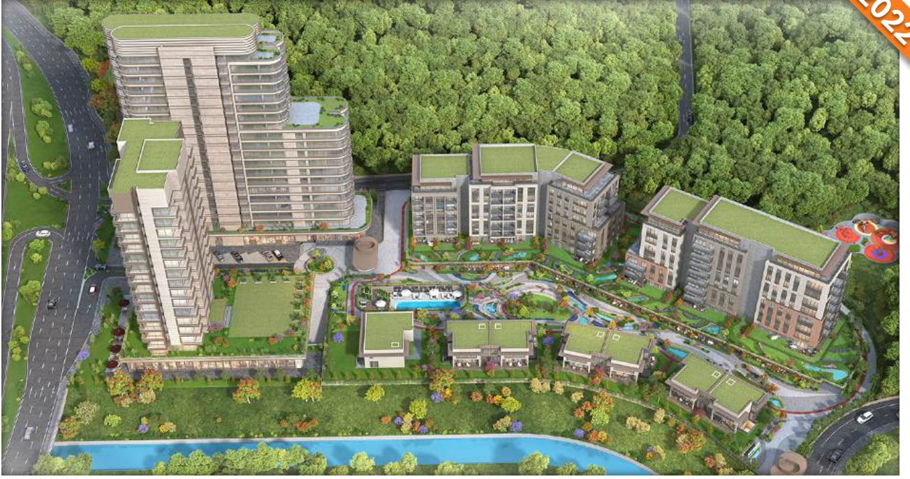
Sarıyer, İstanbul / Türkiye