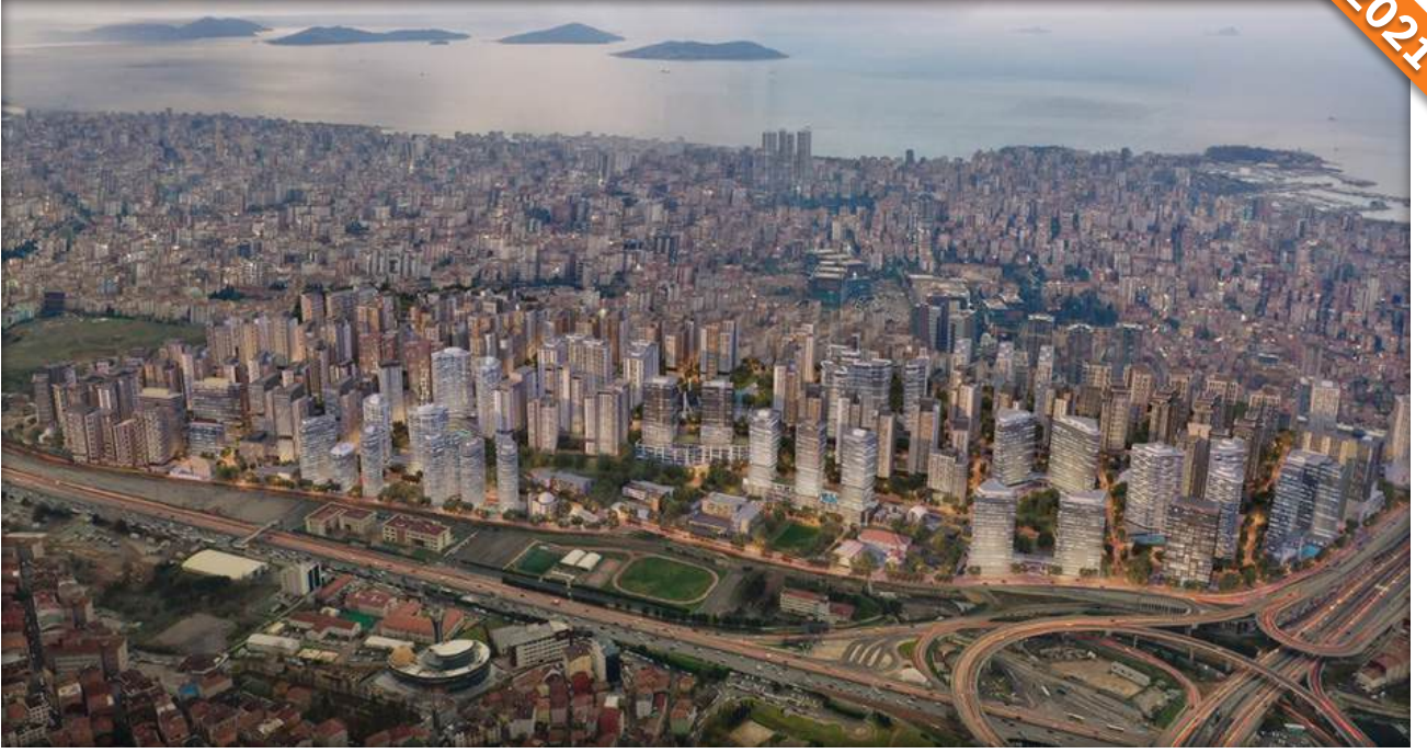
Kadıköy, İstanbul / Türkiye