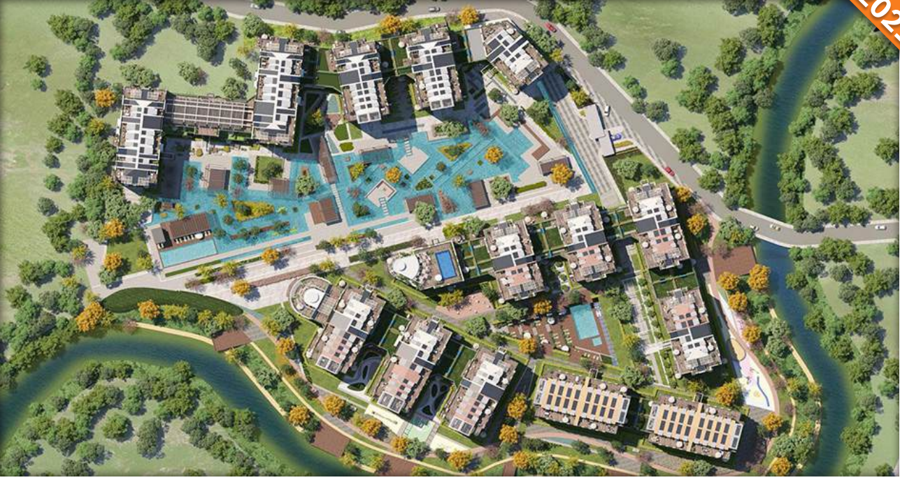
Eyüpsultan, İstanbul / Türkiye