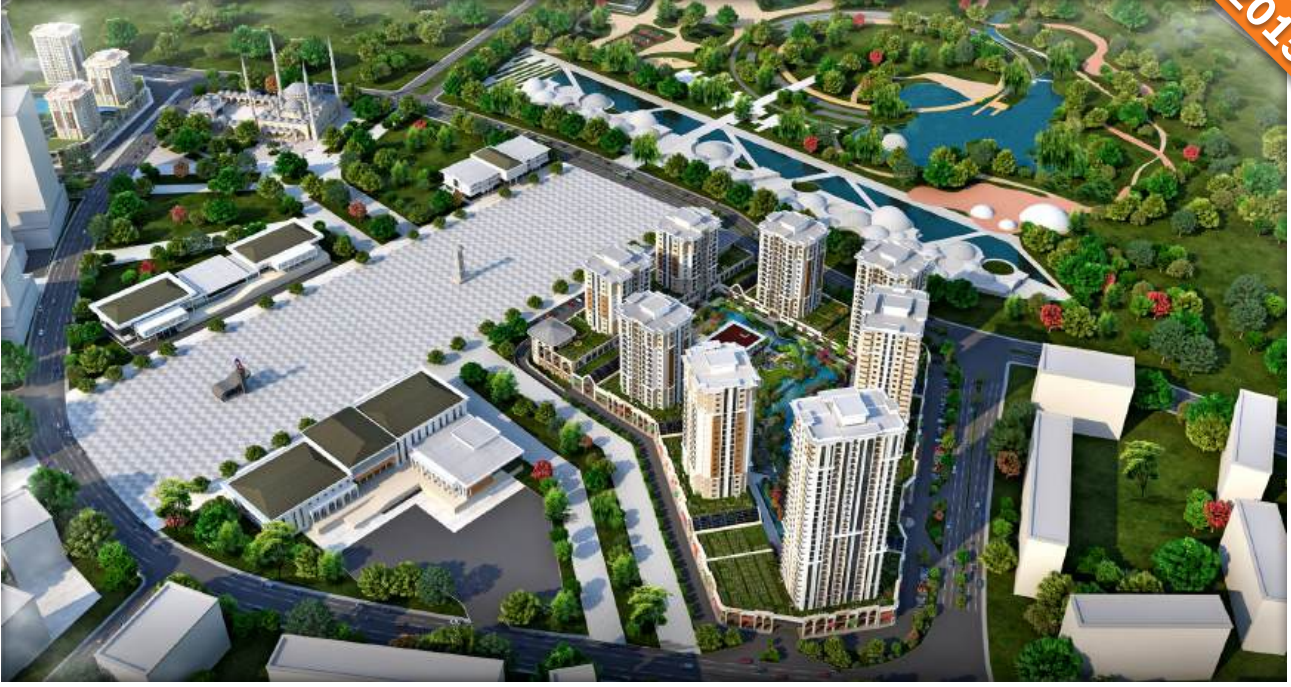
Başakşehir, İstanbul / Türkiye