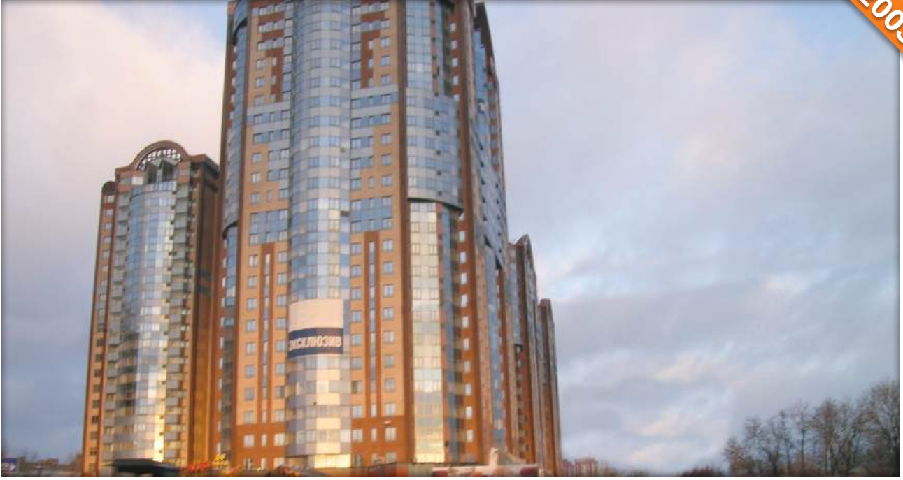
Moskova / Rusya