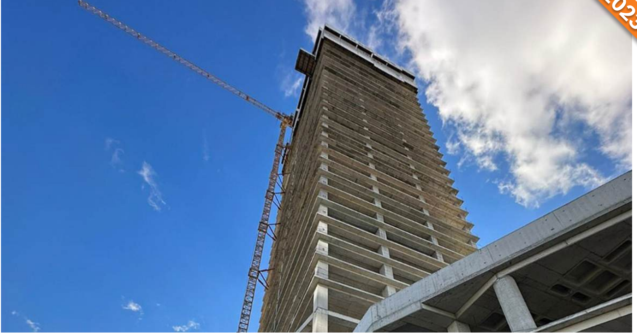
Kartal, İstanbul / Türkiye