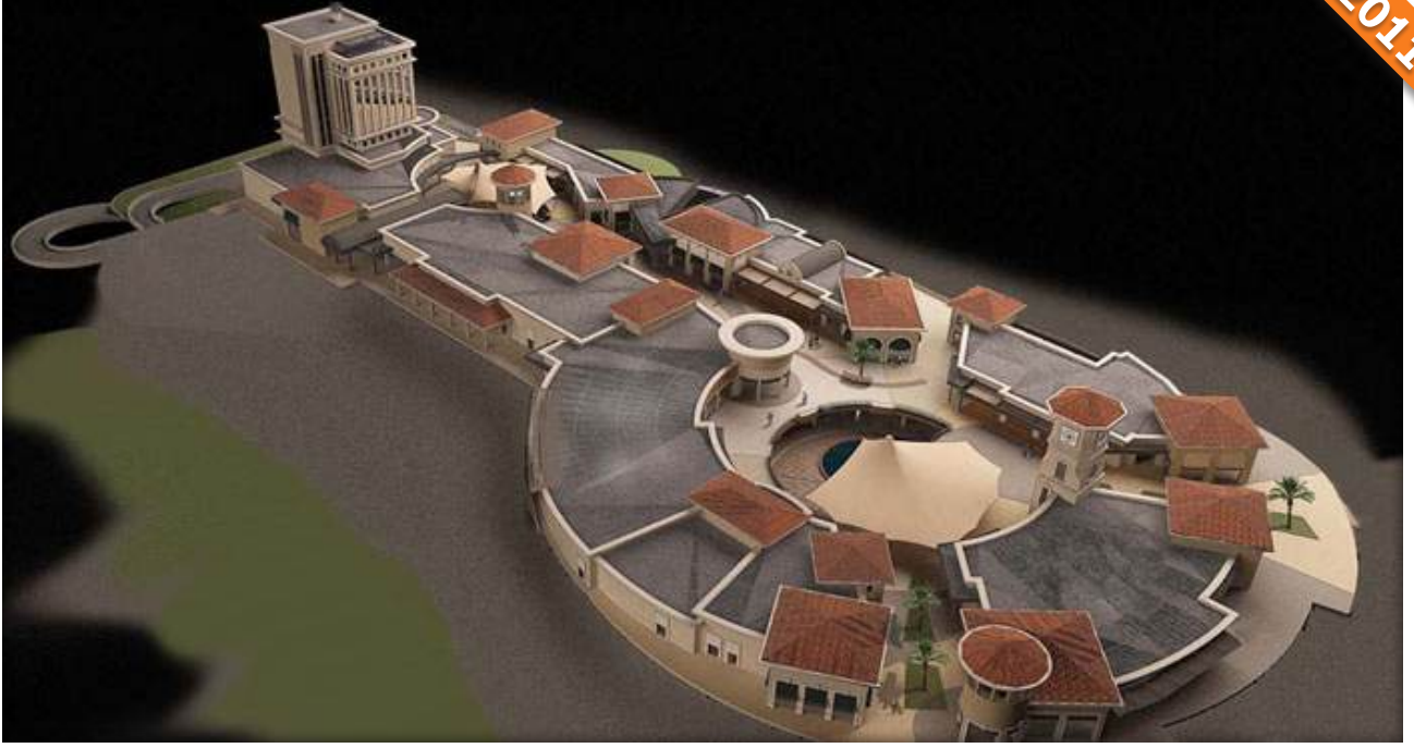
Atakent, Küçükçekmece / İstanbul