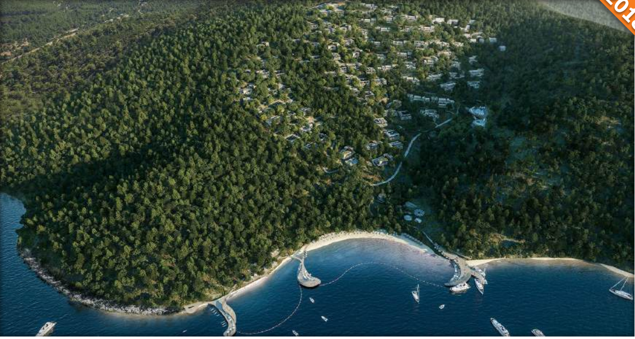
Bodrum, Muğla / Türkiye