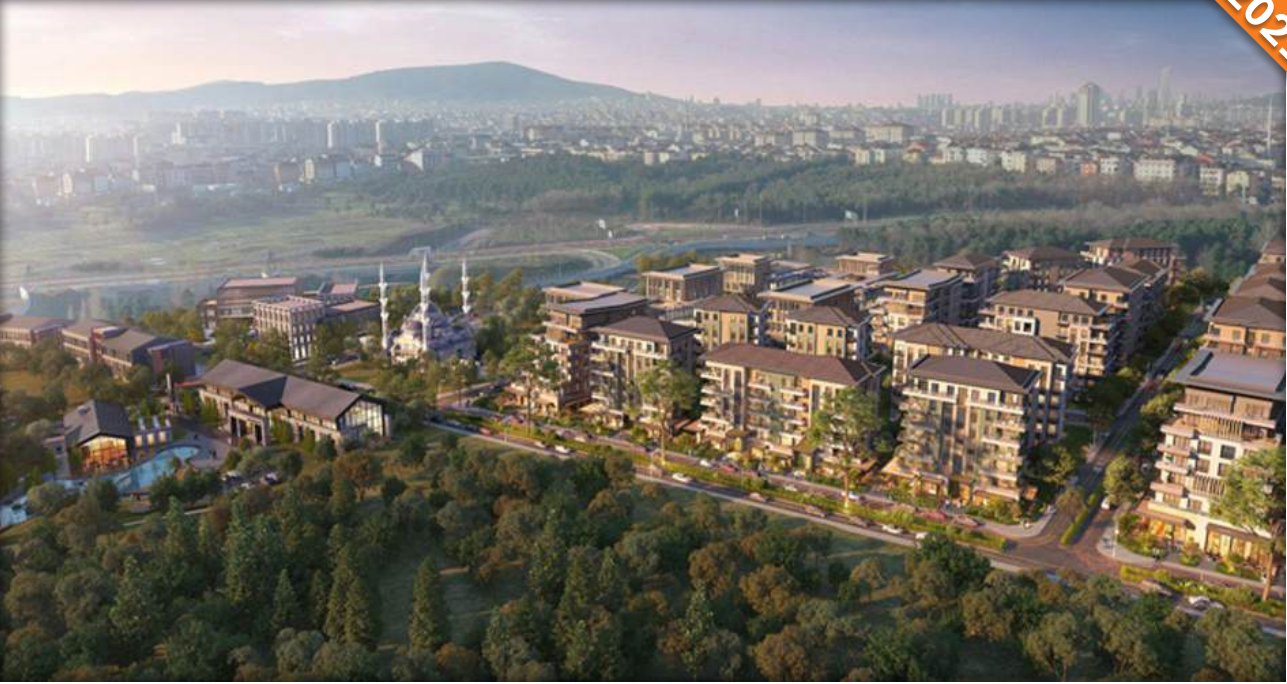
Hadımköy, İstanbul / Türkiye