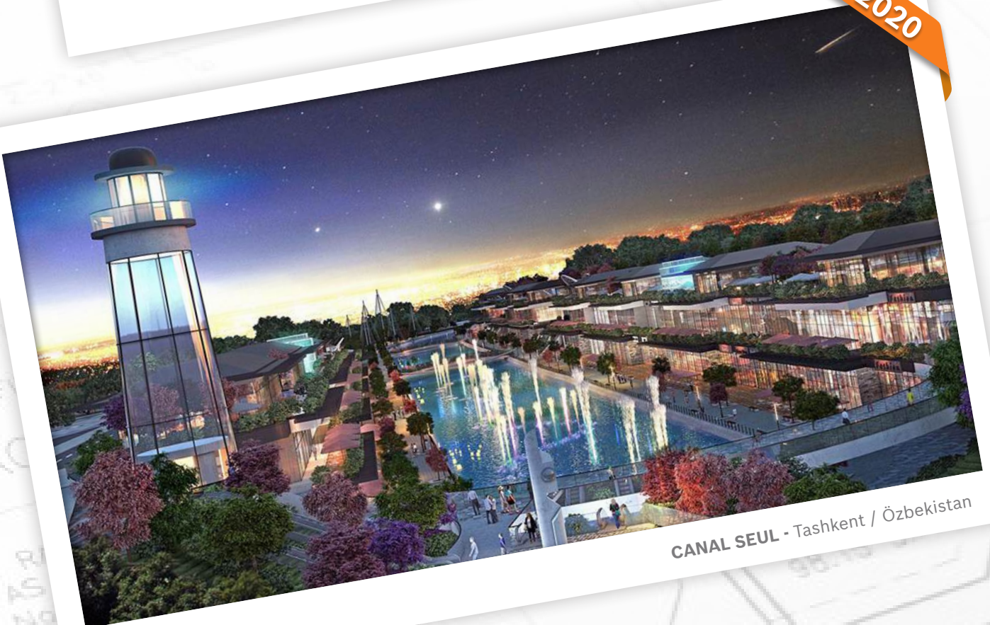
CANAL SEUL - Tashkent / Özbekistan