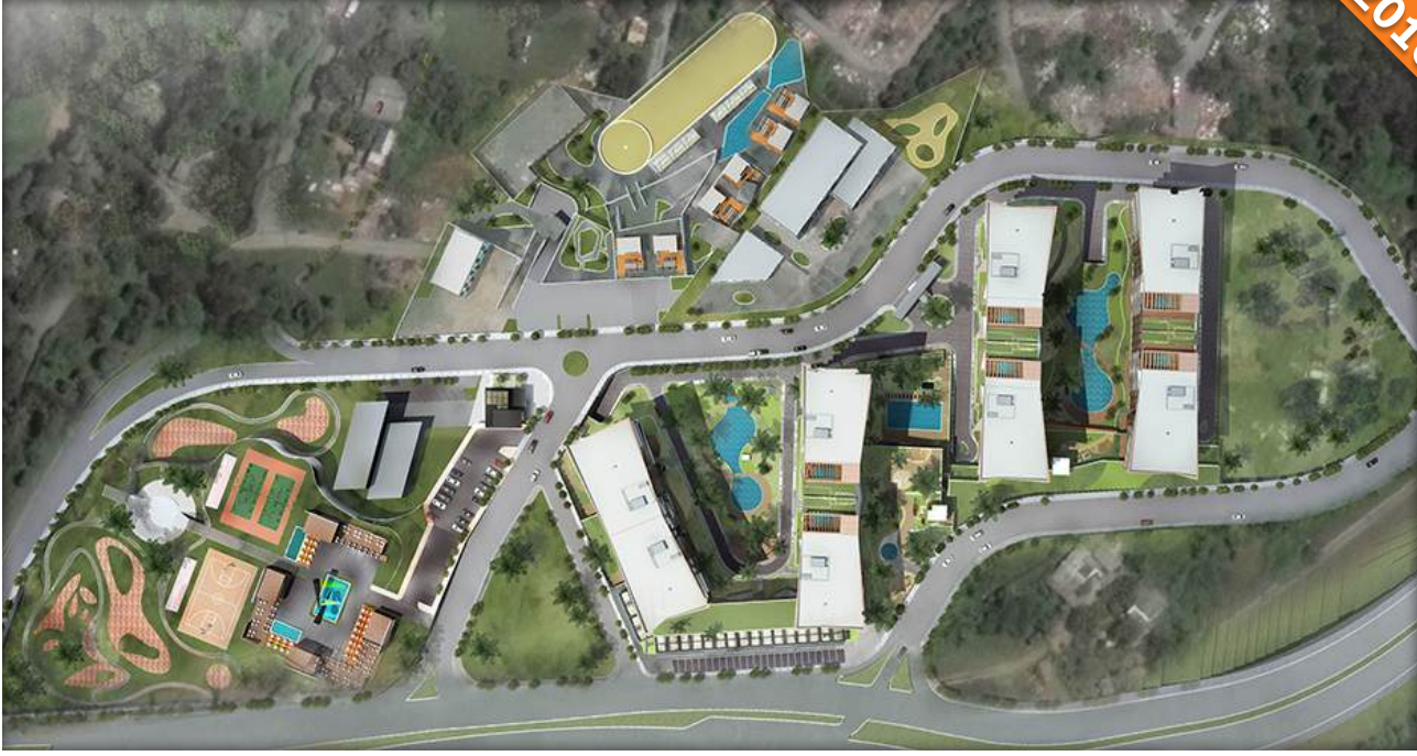
Kağıthane, İstanbul / Türkiye