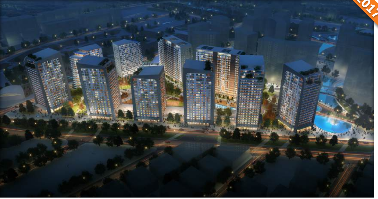
Sahabiye, Kayseri / Türkiye