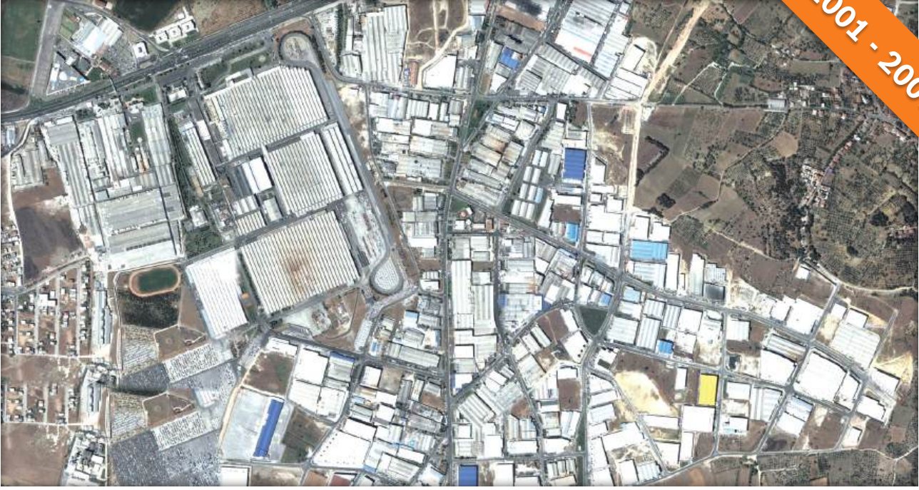
DOSAB OSB Bursa / Türkiye