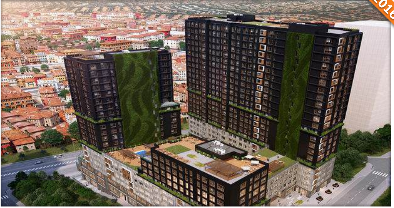
Fikirtepe, Kadıköy , İstanbul / Türkiye