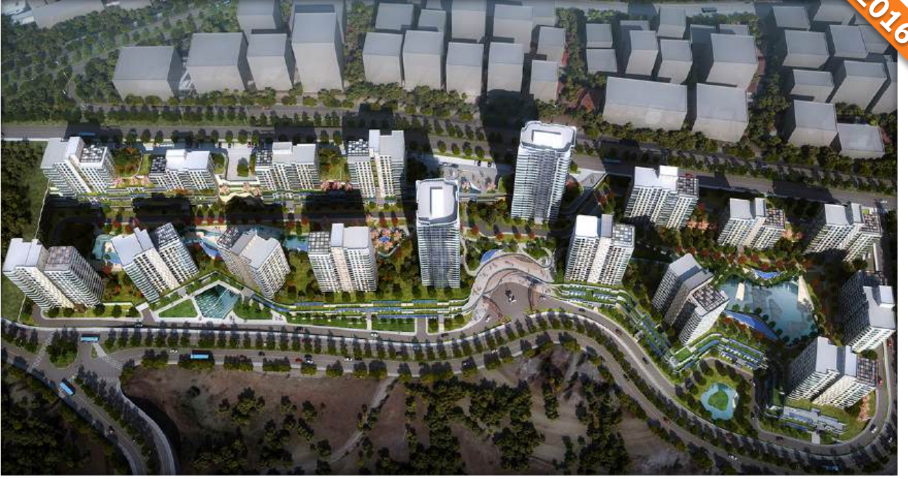
Muhye, Çankaya, Ankara / Türkiye