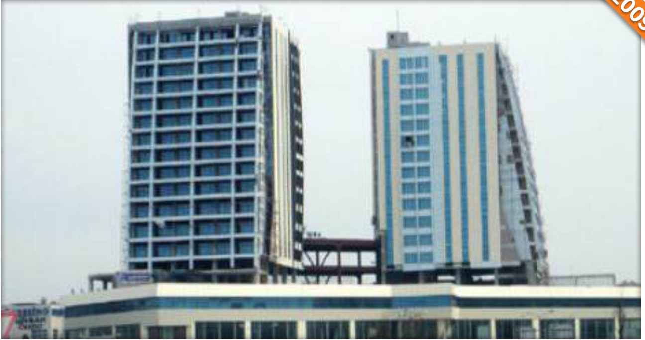
Beylikdüzü, İstanbul / Türkiye