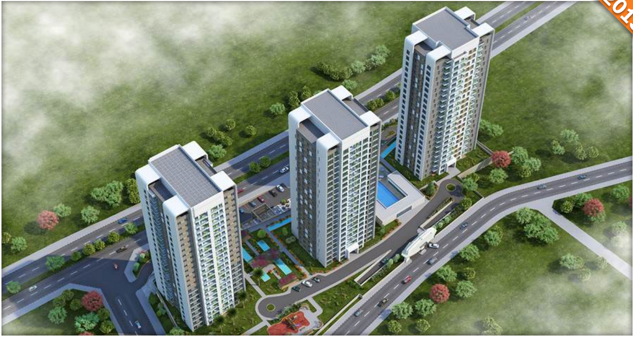
Küçükköy, G.O.P. / İstanbul