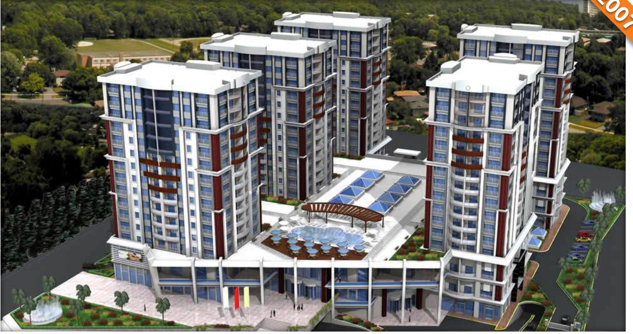
Beylikdüzü, İstanbul / Türkiye