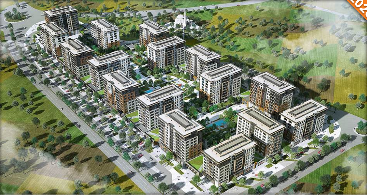
Başakşehir, İstanbul / Türkiye