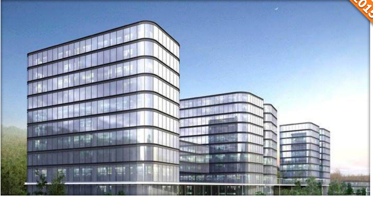
Ayazağa, Cendere Vadisi, İstanbul / Türkiye