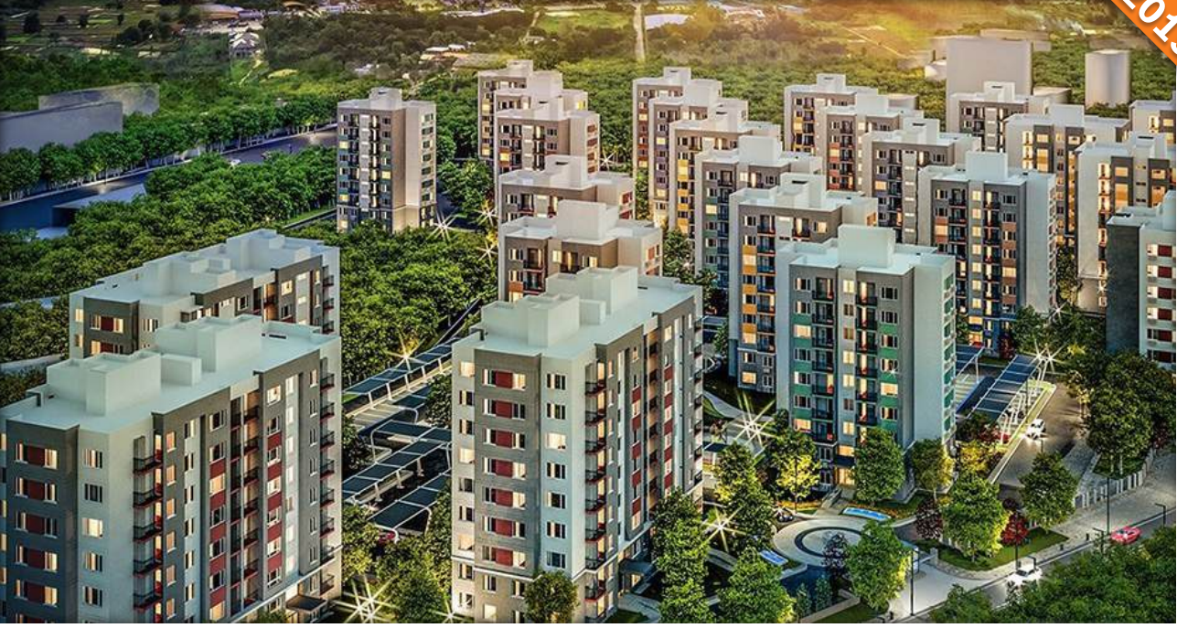
Tashkent / Özbekistan