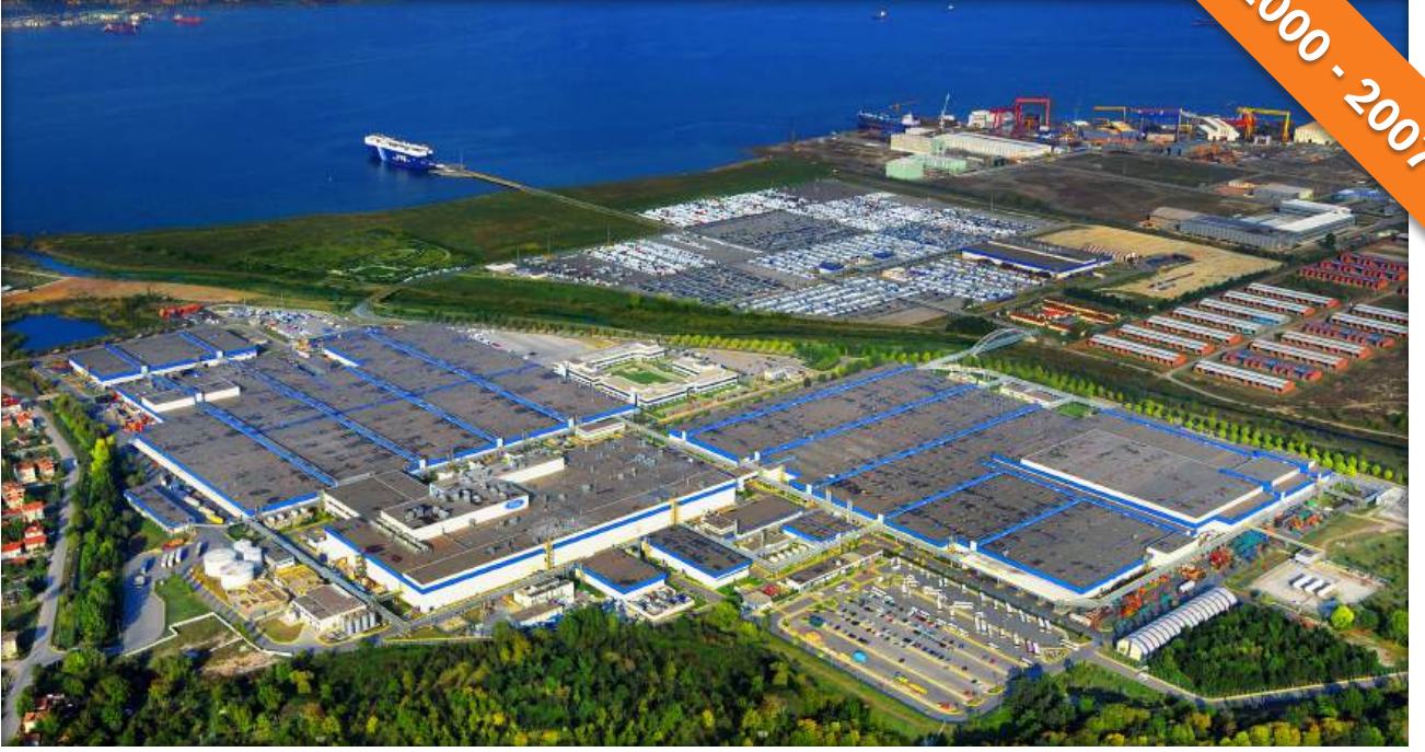
Gölcük, Kocaeli / Türkiye