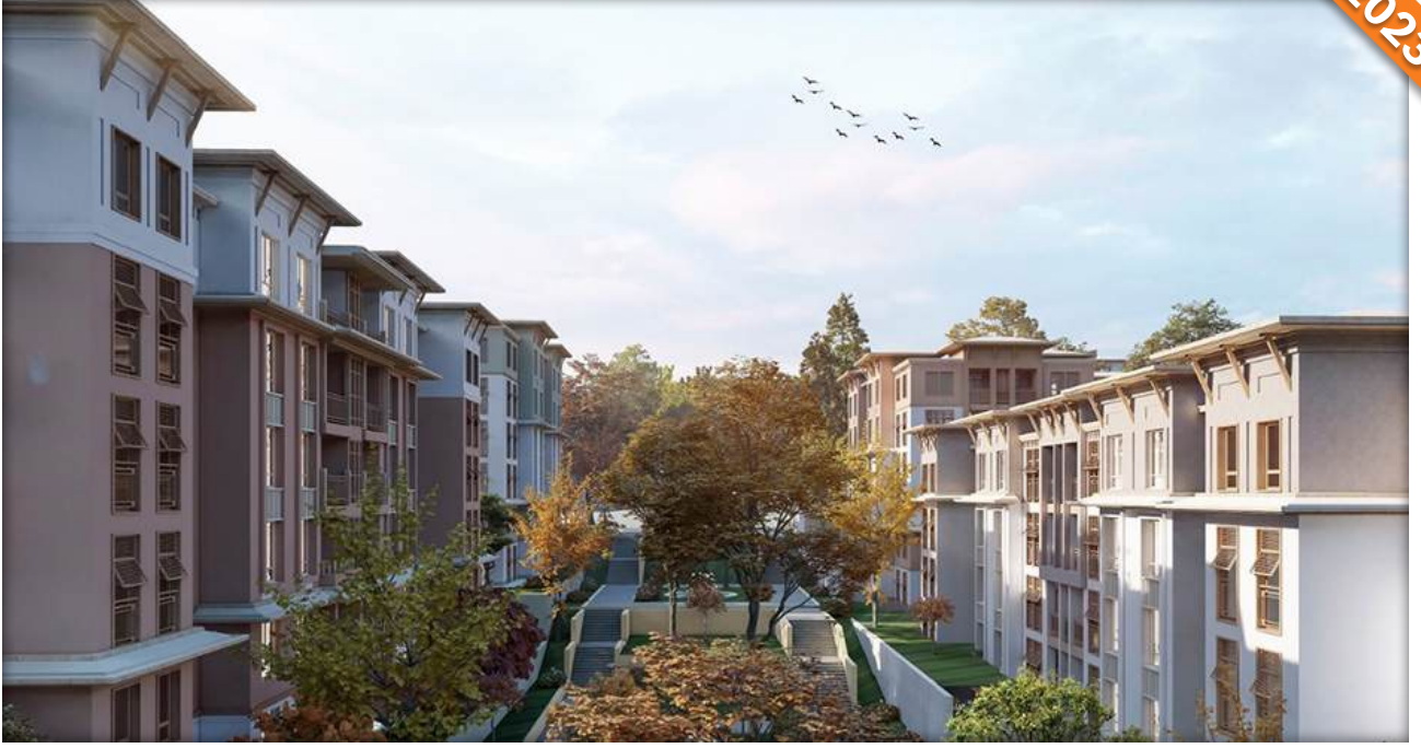
Arnavutköy, İstanbul / Türkiye