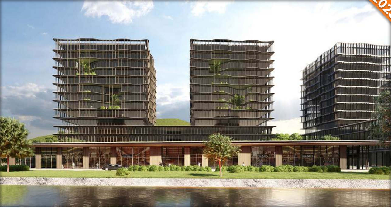
Maslak, İstanbul / Türkiye