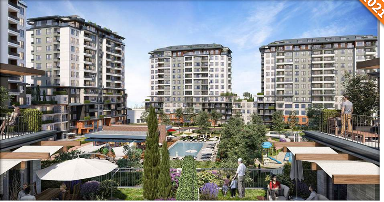
Beylikdüzü, İstanbul / Türkiye