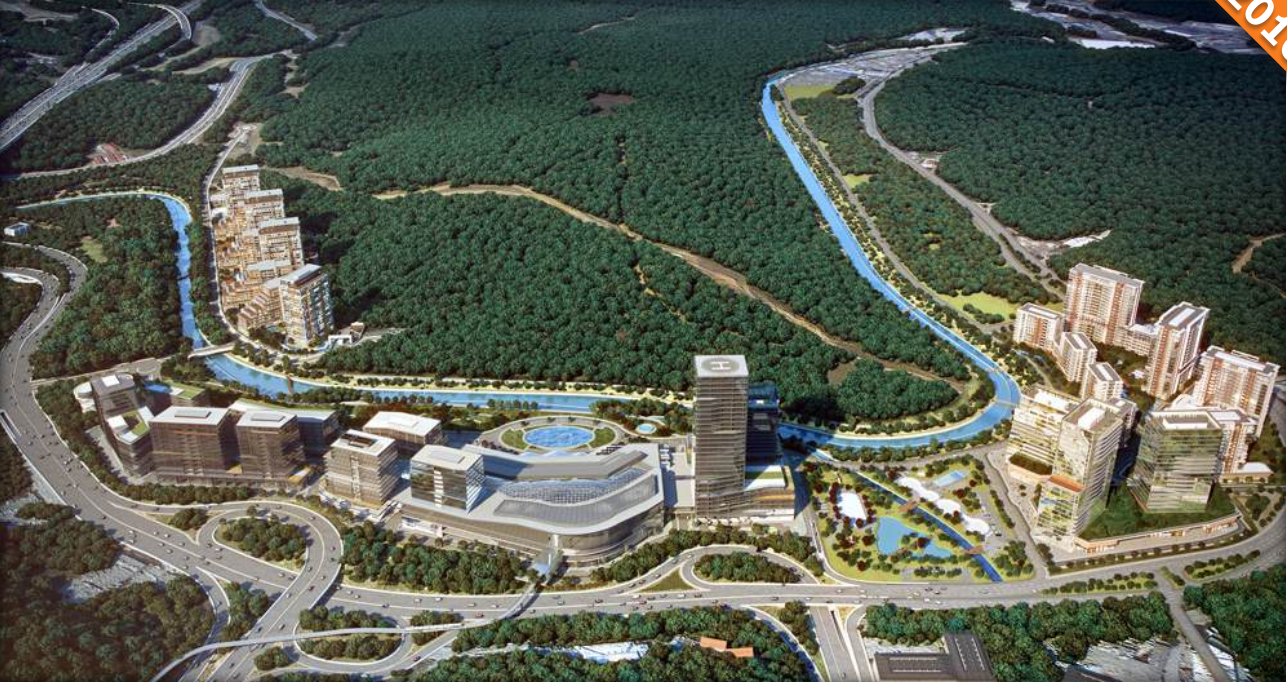
Ayazağa, Cendere Vadisi, İstanbul / Türkiye