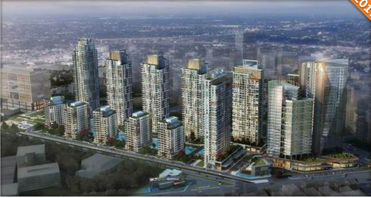
Yamanevler, Ümraniye, İstanbul / Türkiye