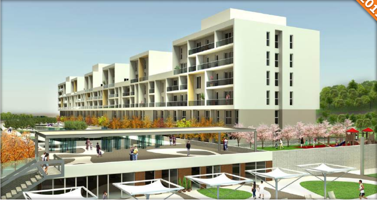
Atakent, İstanbul / Türkiye