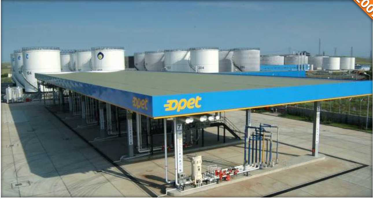
Marmara Ereğlisi, Tekirdağ / Türkiye