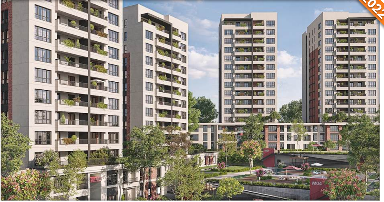
Bağcılar, İstanbul / Türkiye