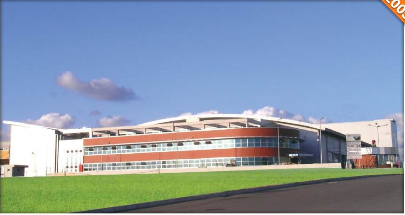
TOSB Gebze, Kocaeli / Türkiye