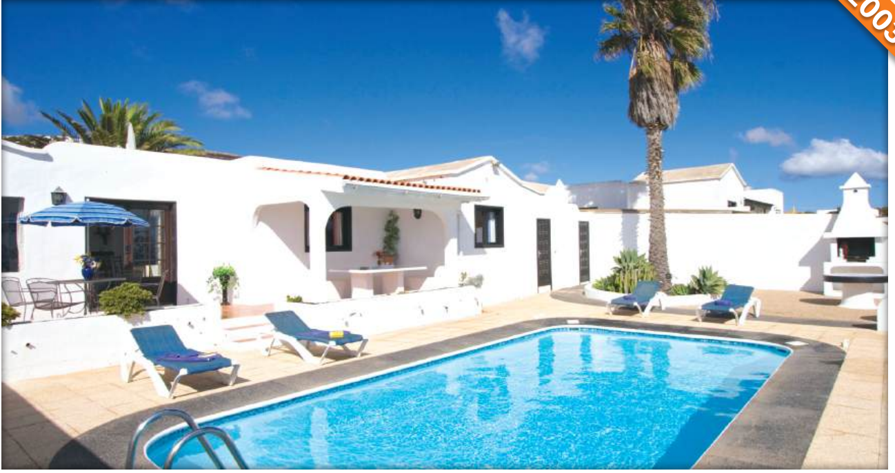
Dalaman, Muğla / Türkiye