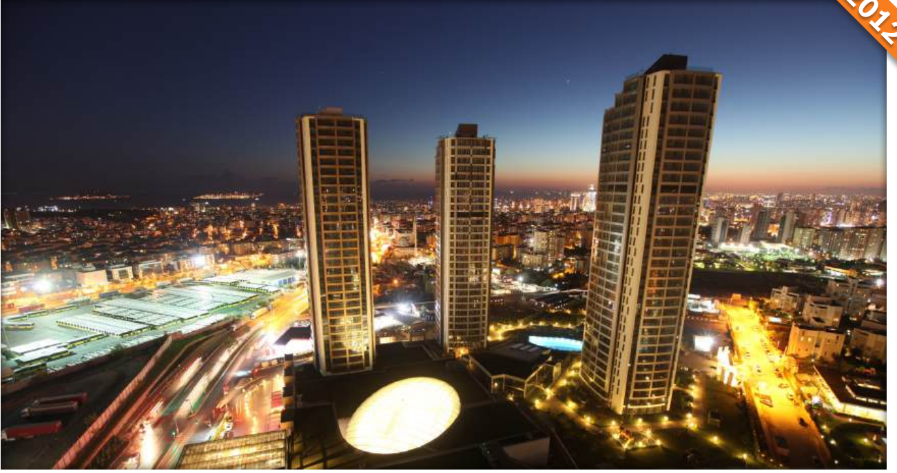
Ataşehir, İstanbul / Türkiye