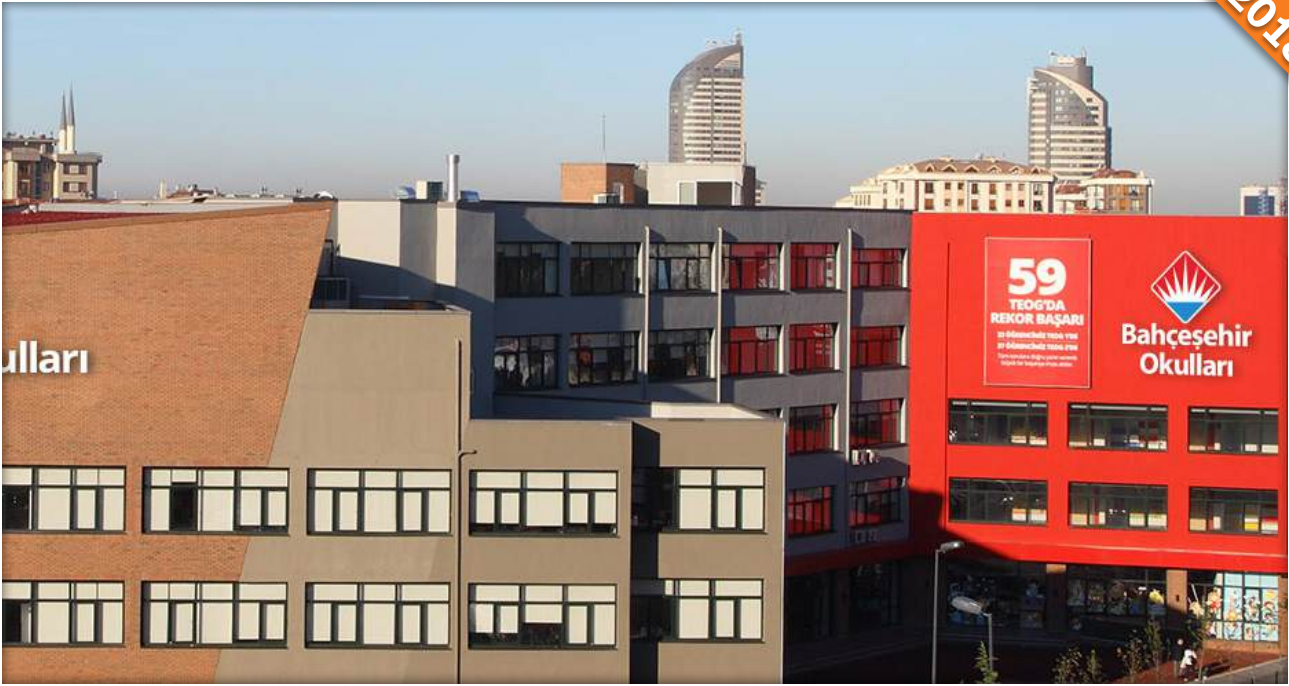
Halkalı, İstanbul / Türkiye