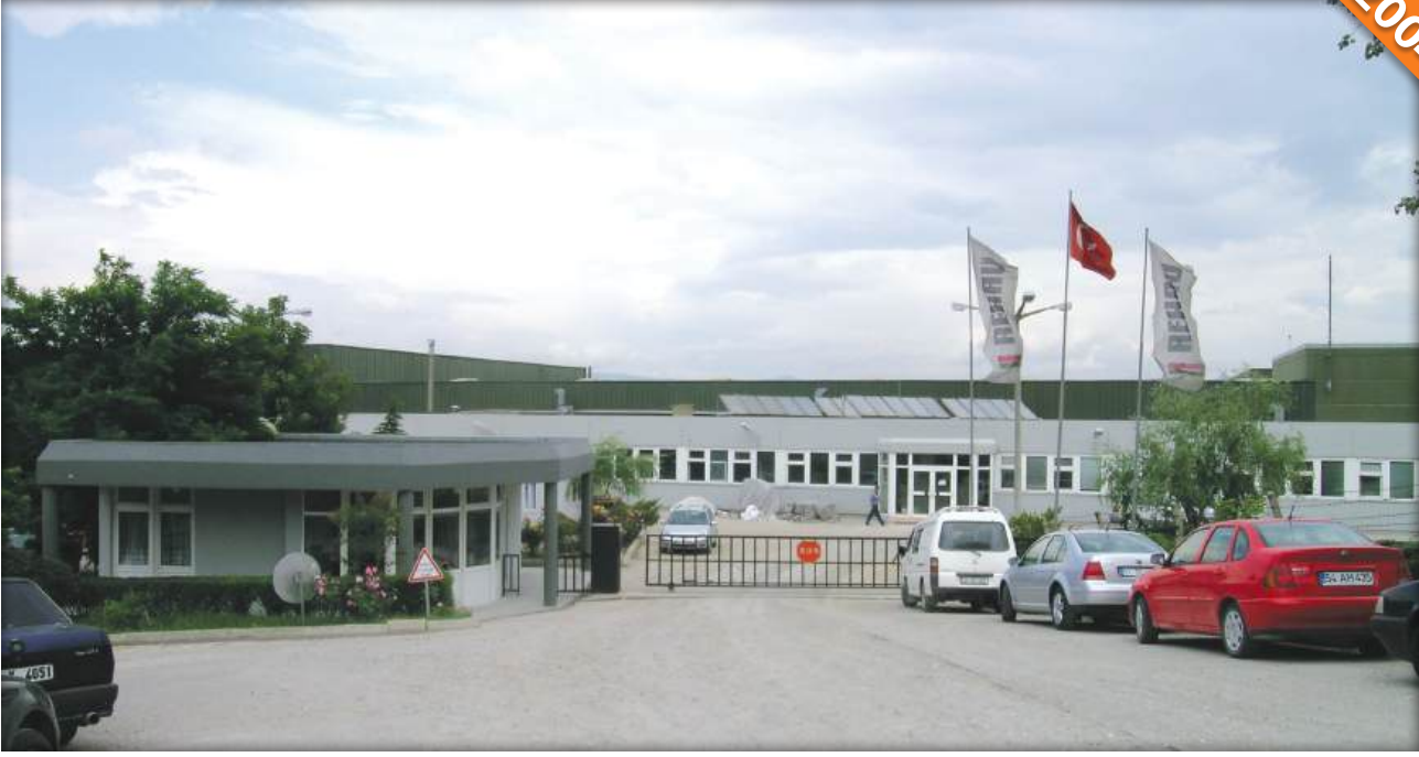
Osmaneli, Bilecik / Türkiye