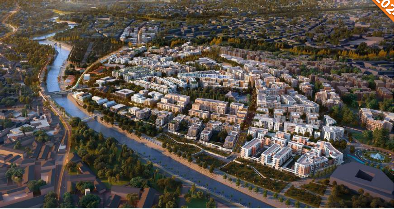
Antakya, Defne, İskenderun, Hatay / Türkiye