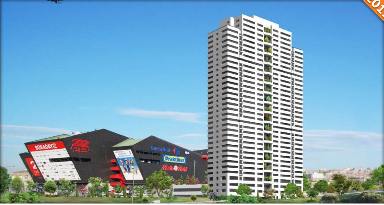
Güneşli, İstanbul / Türkiye