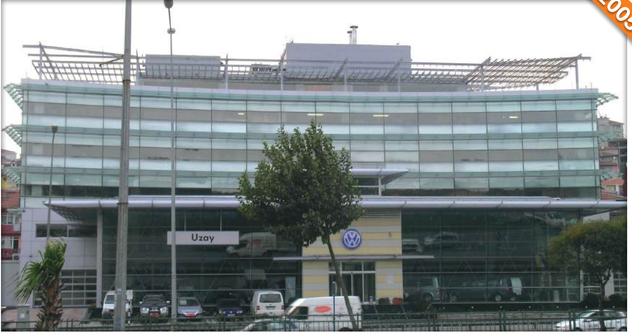
Kasımpaşa, İstanbul / Türkiye