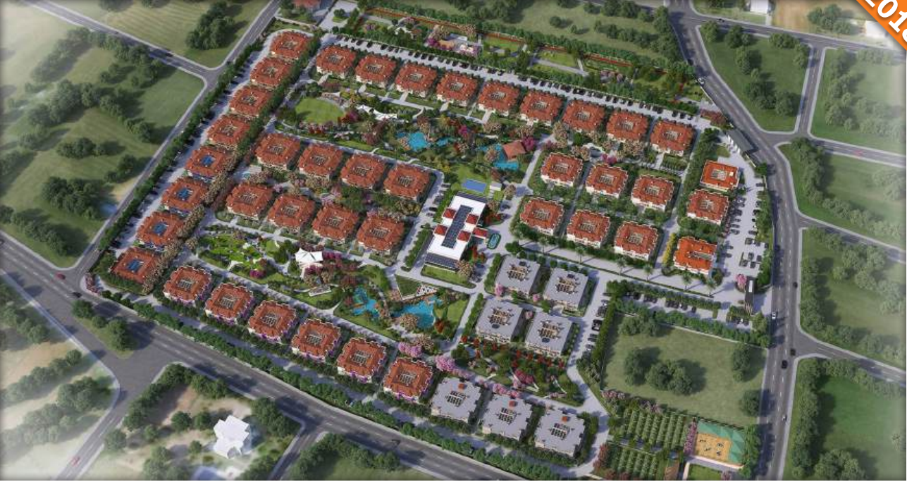
Silivri, İstanbul / Türkiye