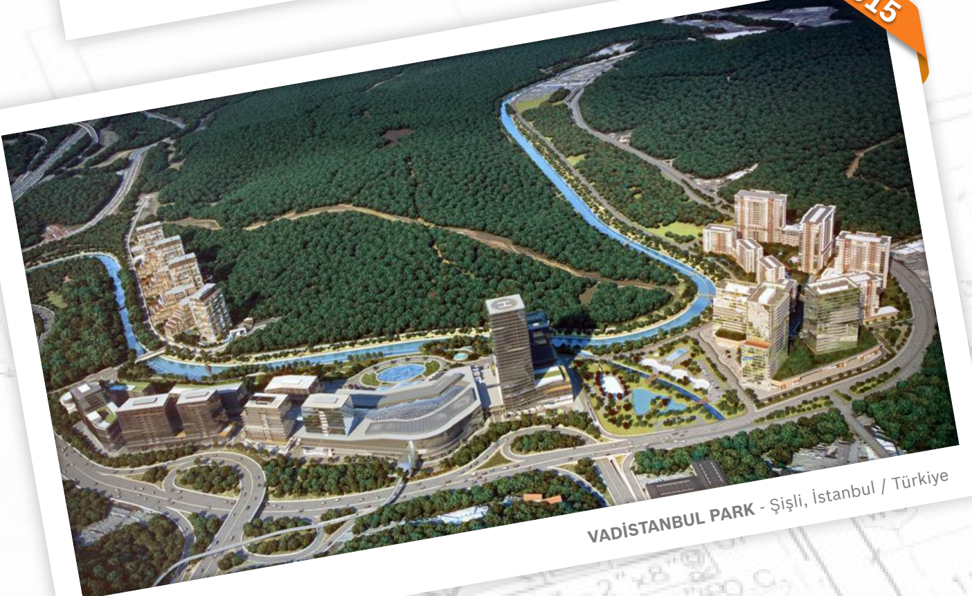
VADİ İSTANBUL PARK - Şişli, İstanbul / Türkiye