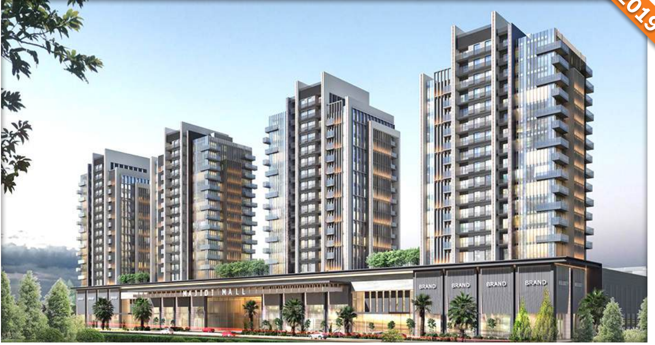
Bağdat / Irak