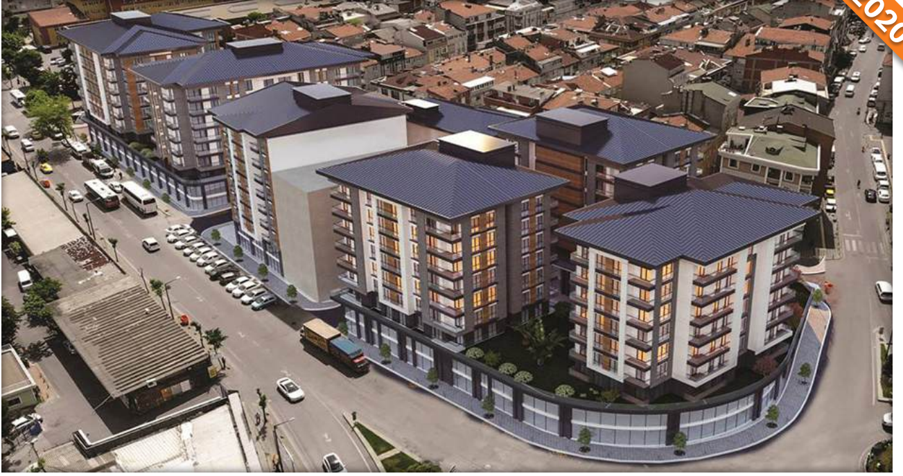
Zeytinburnu, İstanbul / Türkiye