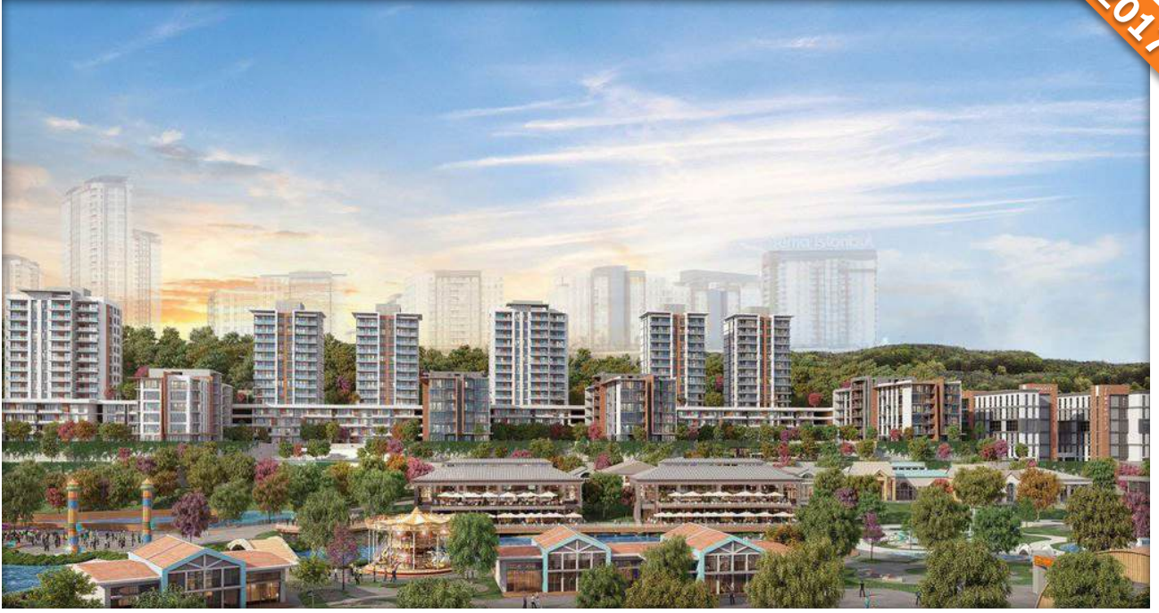
Atakent, Küçükçekmece, İstanbul / Türkiye