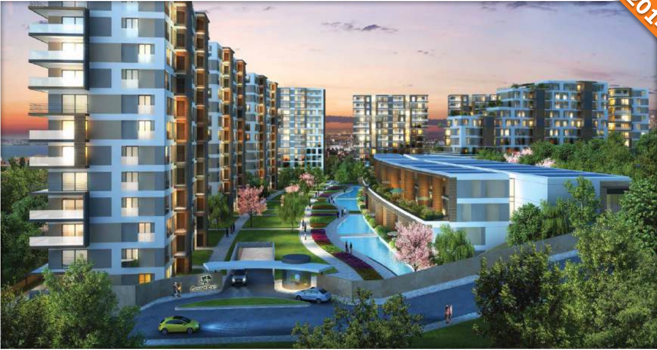
K. Çekmece, İstanbul / Türkiye