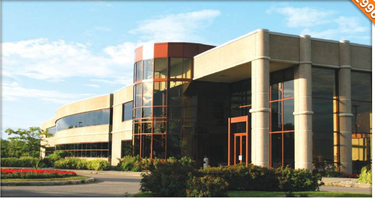
Asgabat / Türkmenistan