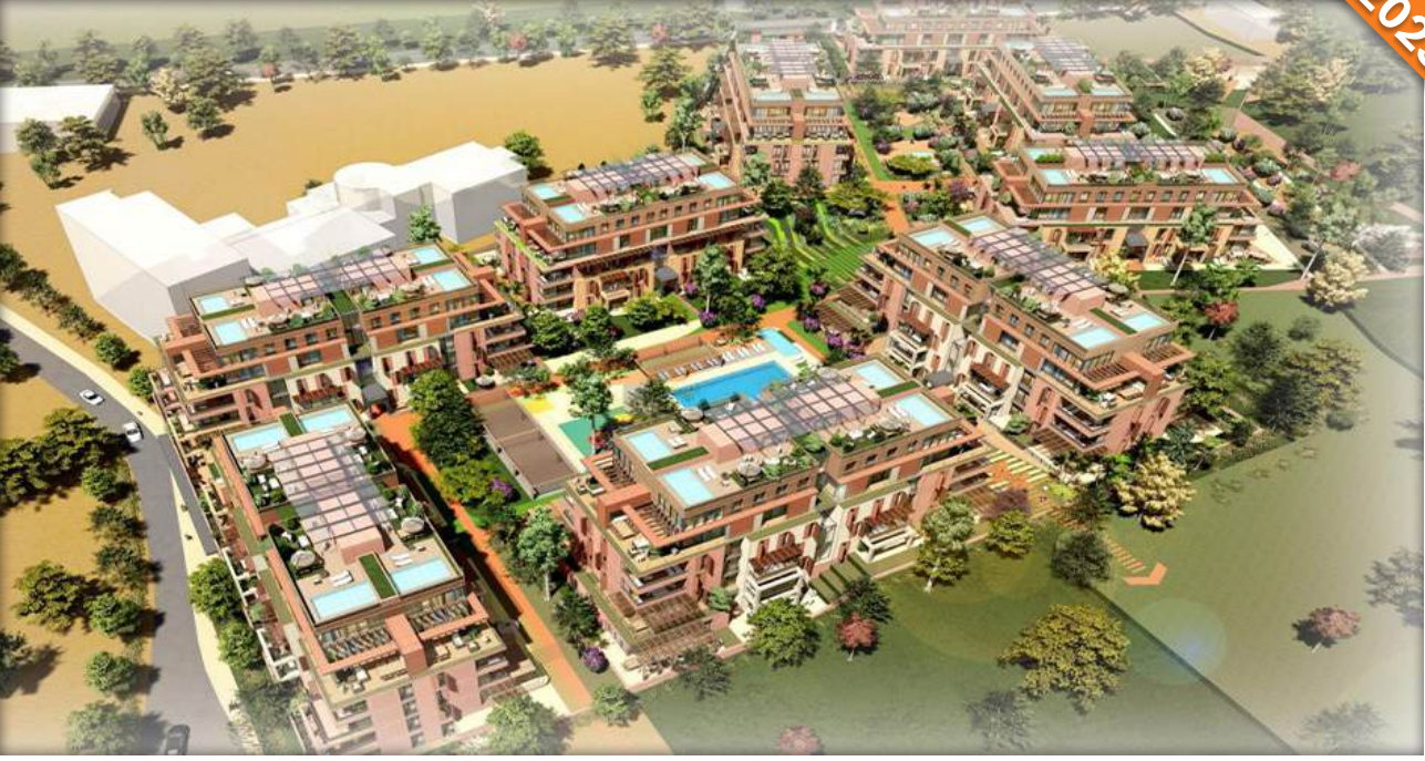
Göktürk, Eyüp, İstanbul / Türkiye