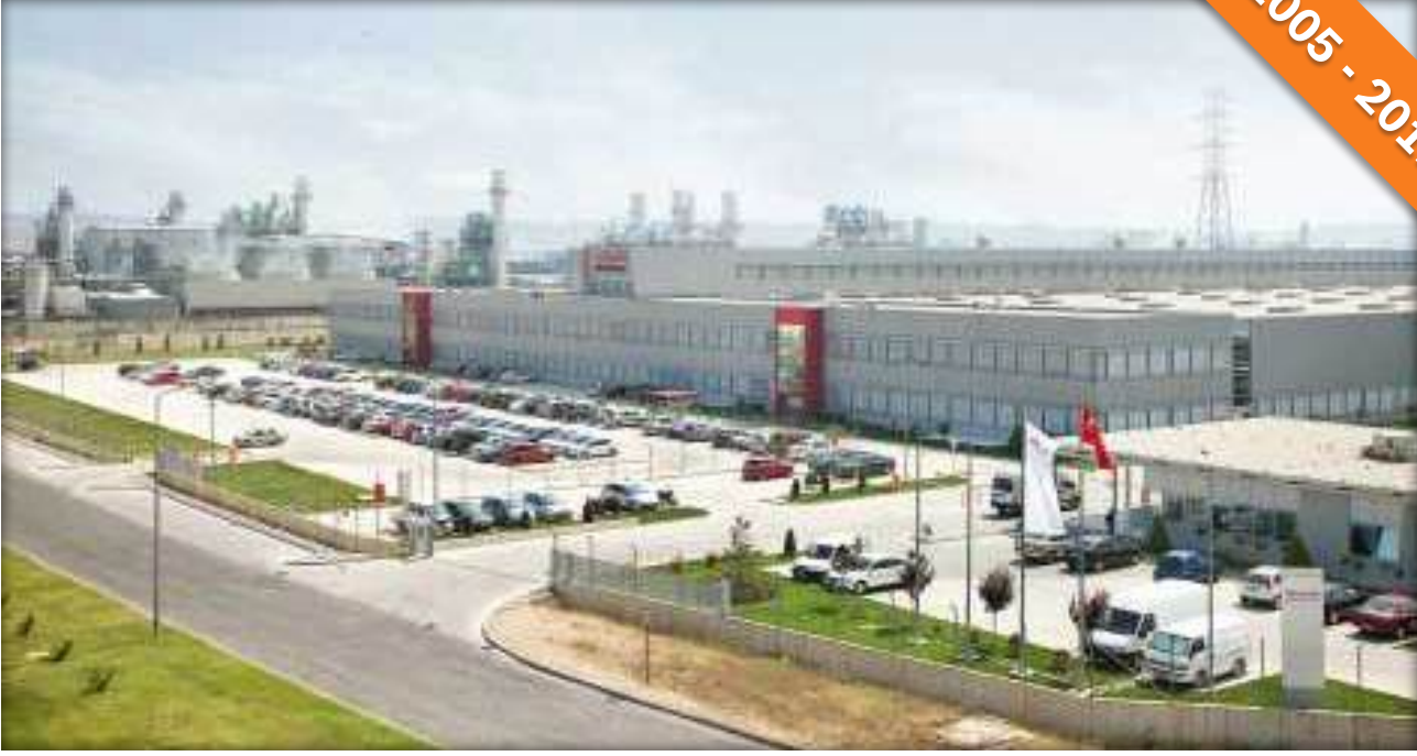
OSB, Bursa / Türkiye