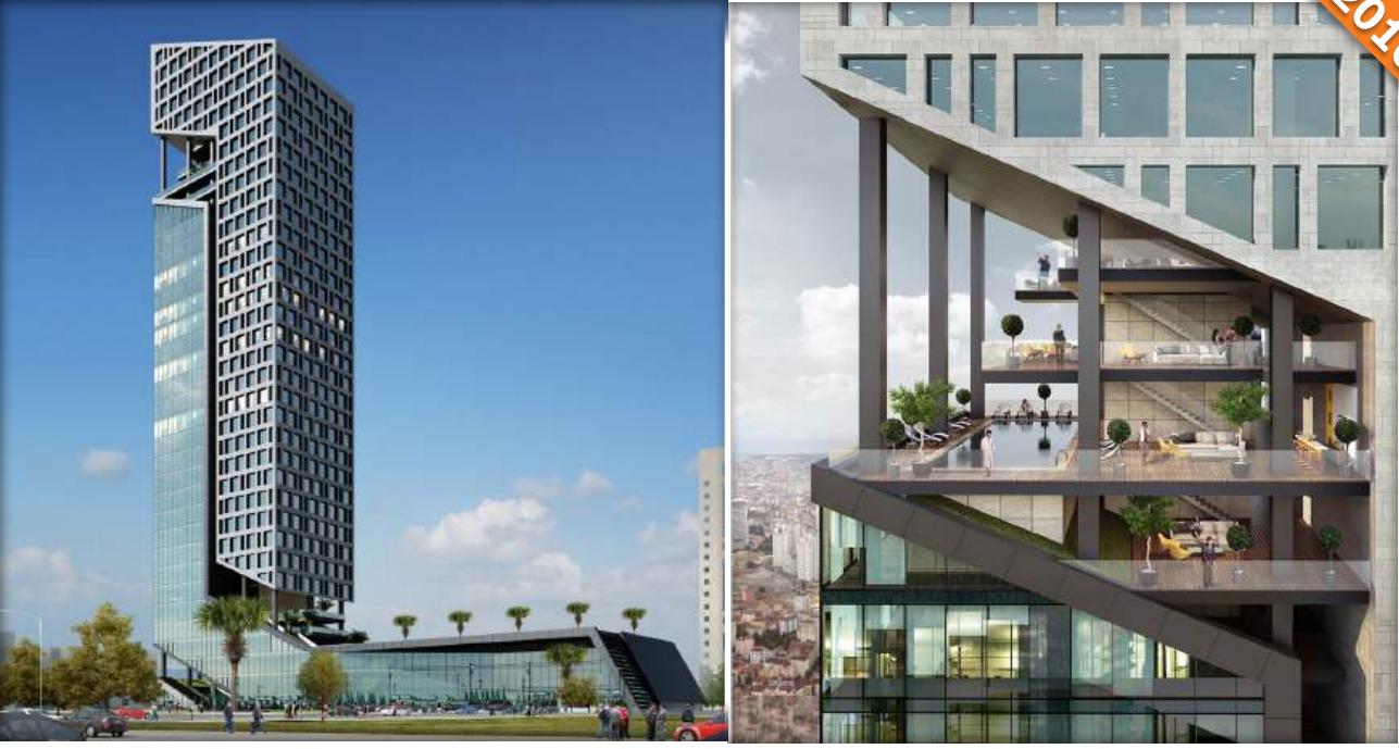
Kartal, İstanbul / Türkiye