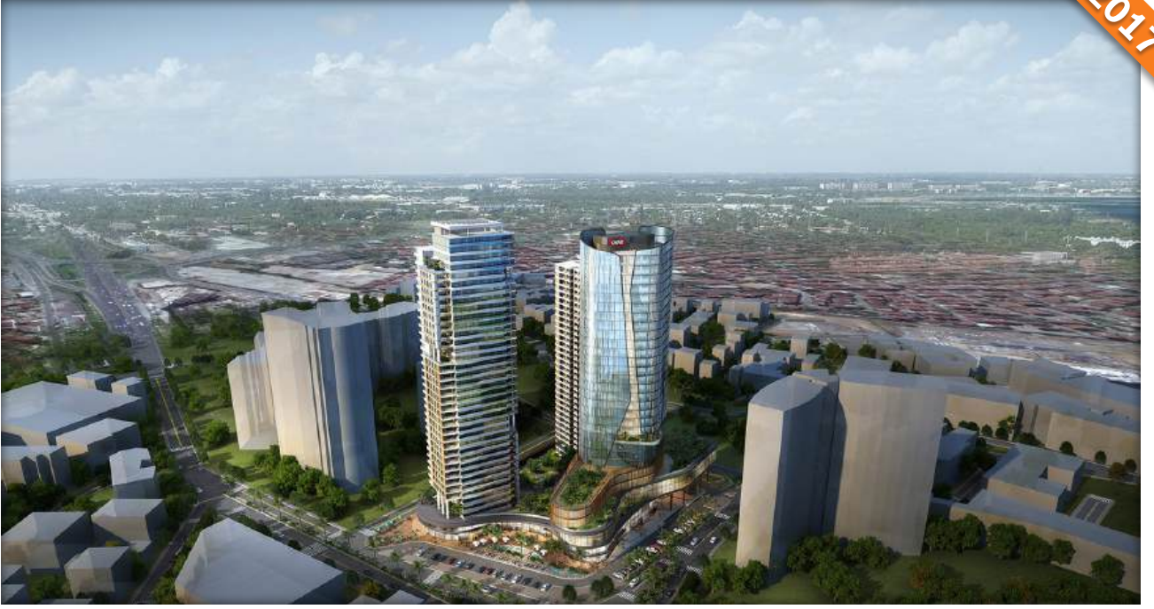
Dragos, Maltepe, İstanbul / Türkiye