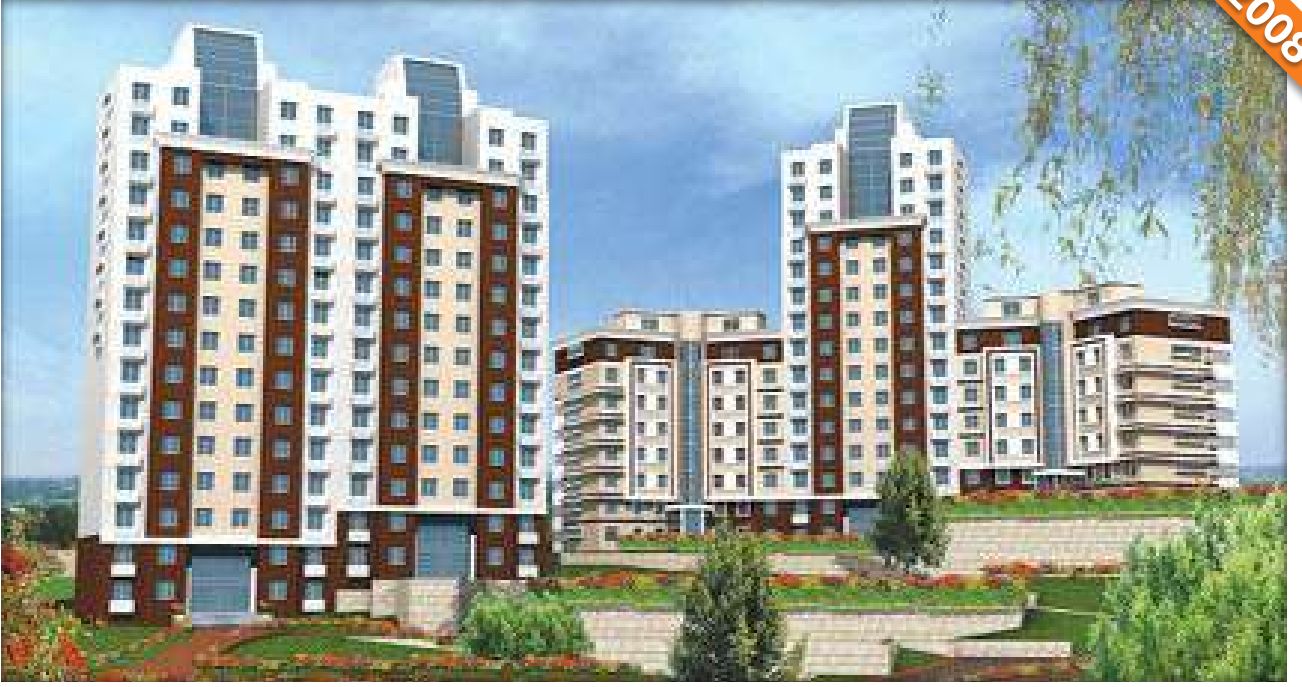
Bahçeşehir, İstanbul / Türkiye