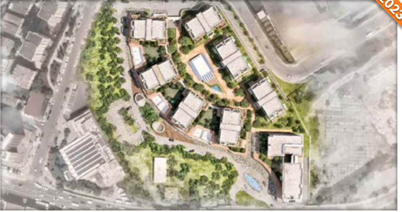
Ümraniye, İstanbul / Türkiye