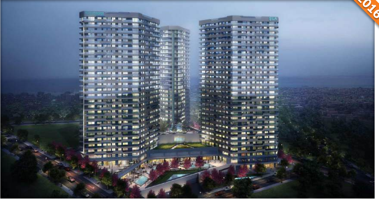
Fikirtepe, Kadıköy, İstanbul / Türkiye