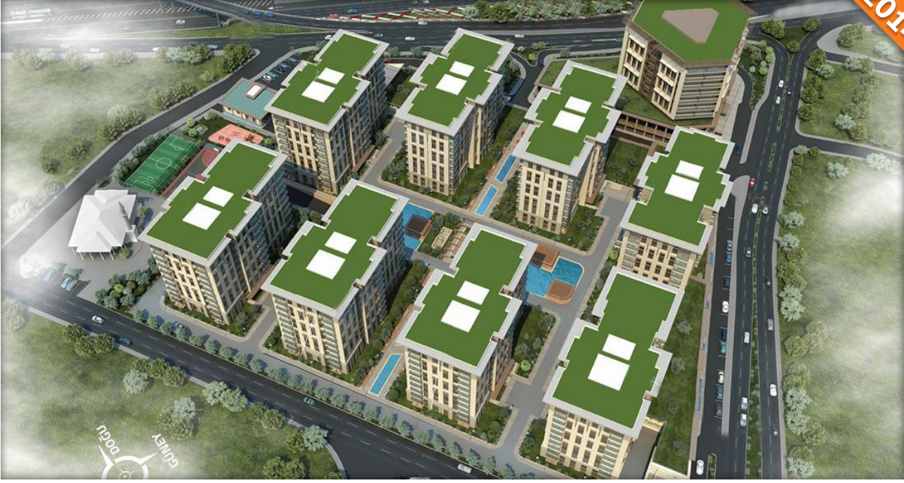
Topkapı, İstanbul / Türkiye