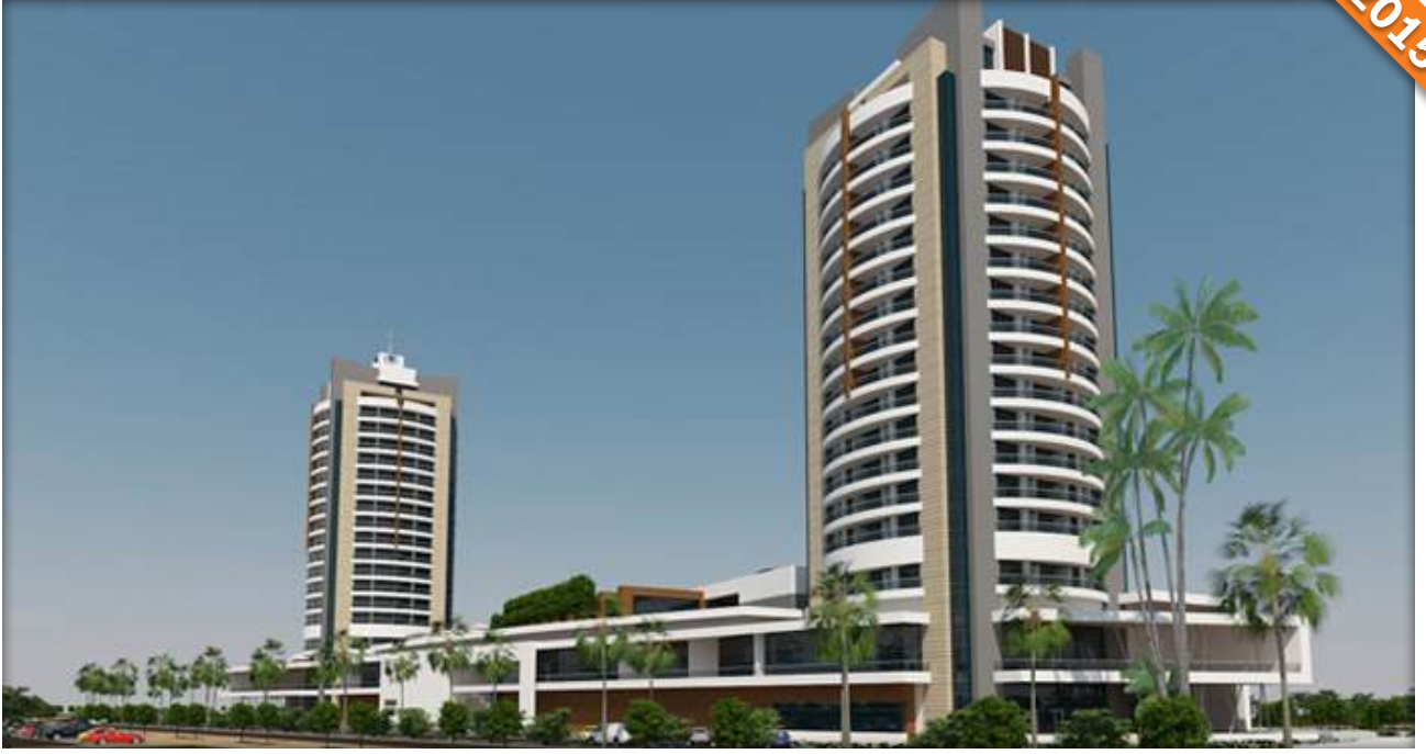
İskenderun, Hatay / Türkiye