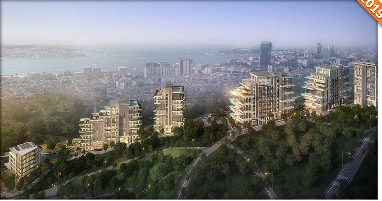
Şişli, İstanbul / Türkiye