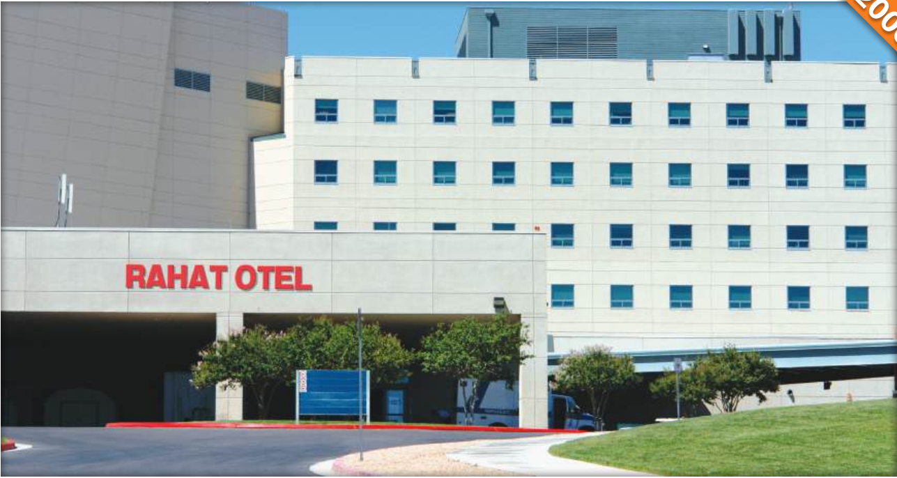
Bushehr / İran