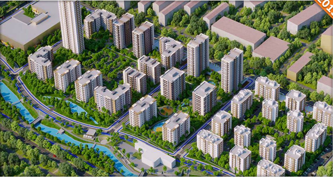
Tashkent / Özbekistan