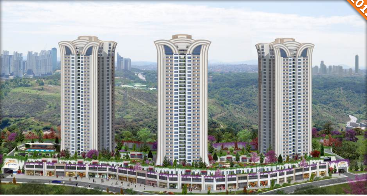
Ayazađa, İstanbul / Türkiye