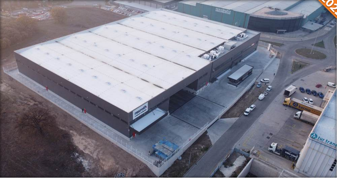
Nilüfer, Bursa / Türkiye