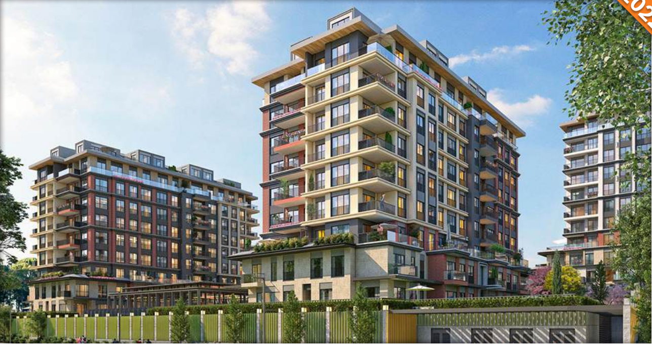
Darica, Kocaeli / Türkiye