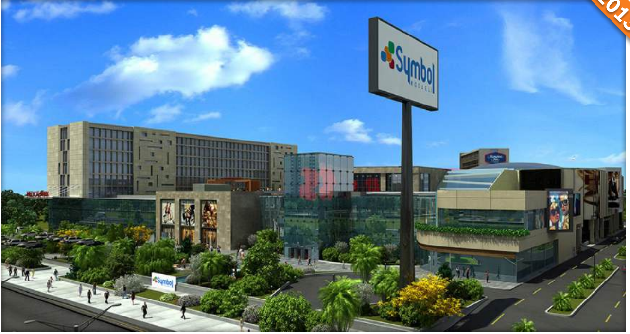
İzmit, Kocaeli / Türkiye