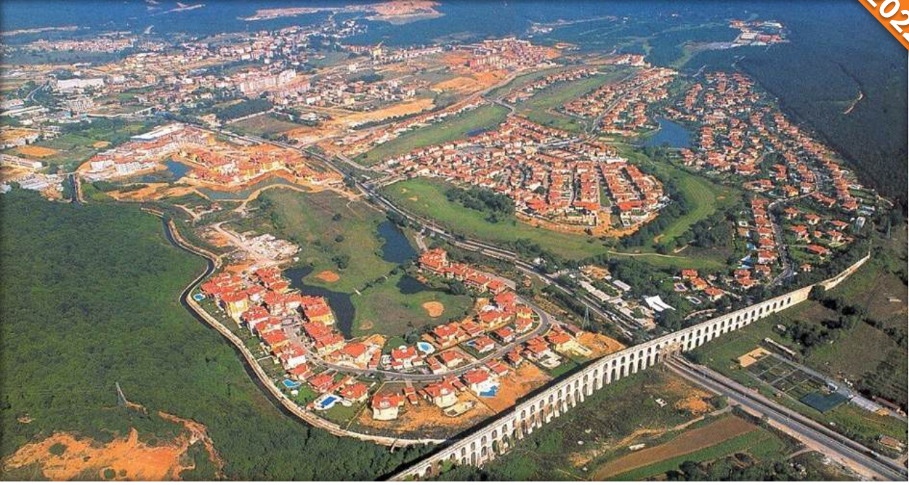
Eyüpsultan, İstanbul / Türkiye