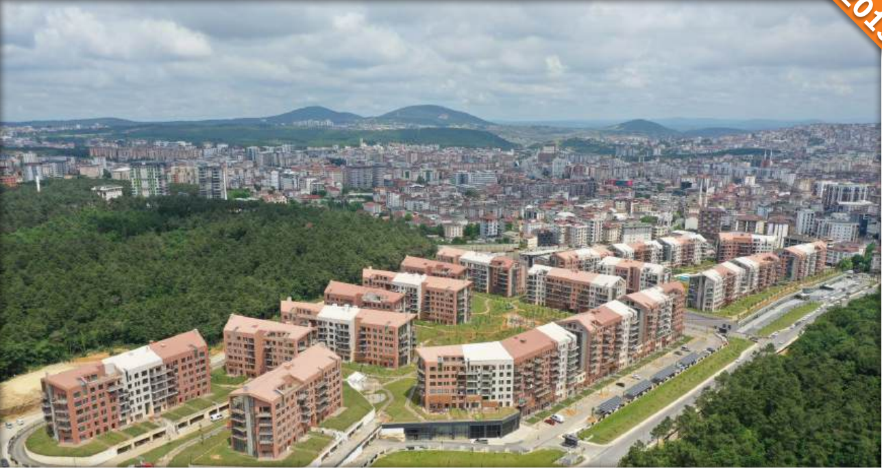
Çekmeköy, İstanbul / Türkiye