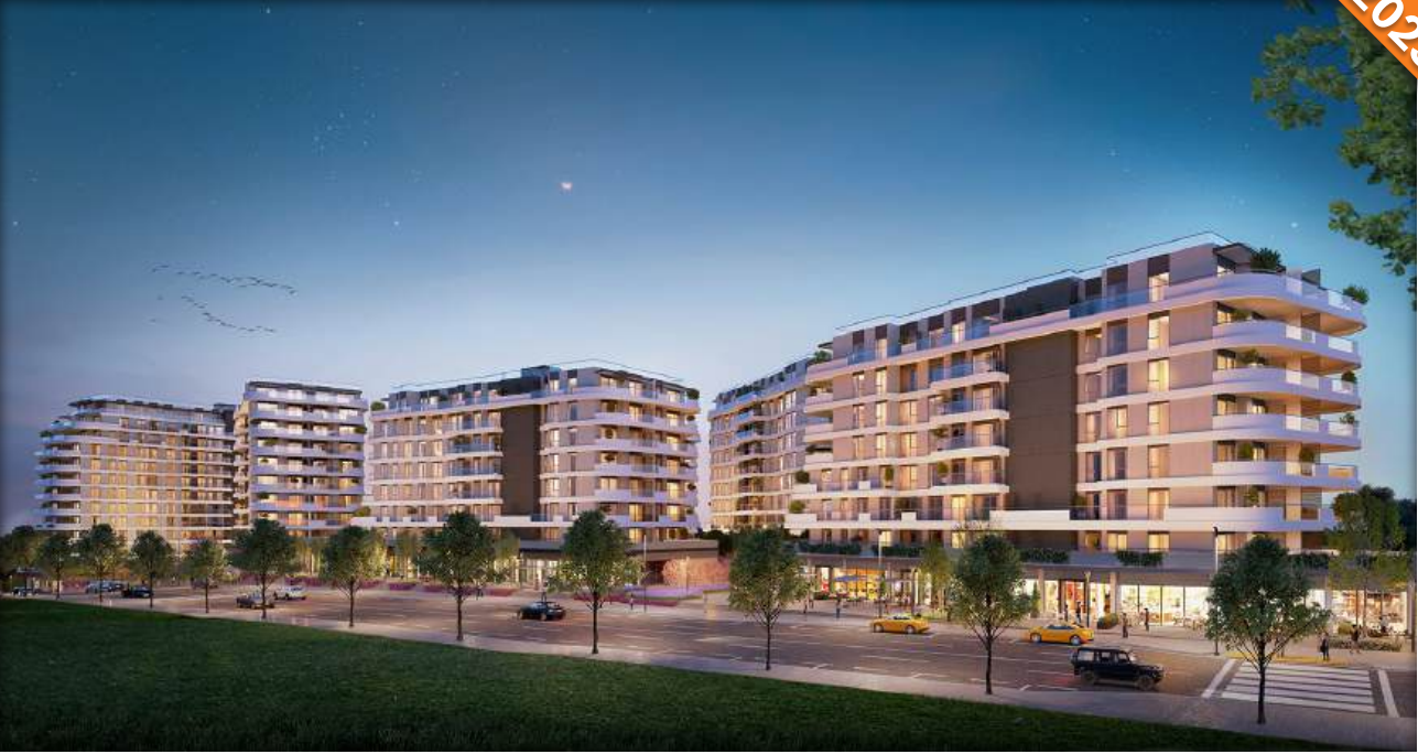
Kartal, İstanbul / Türkiye