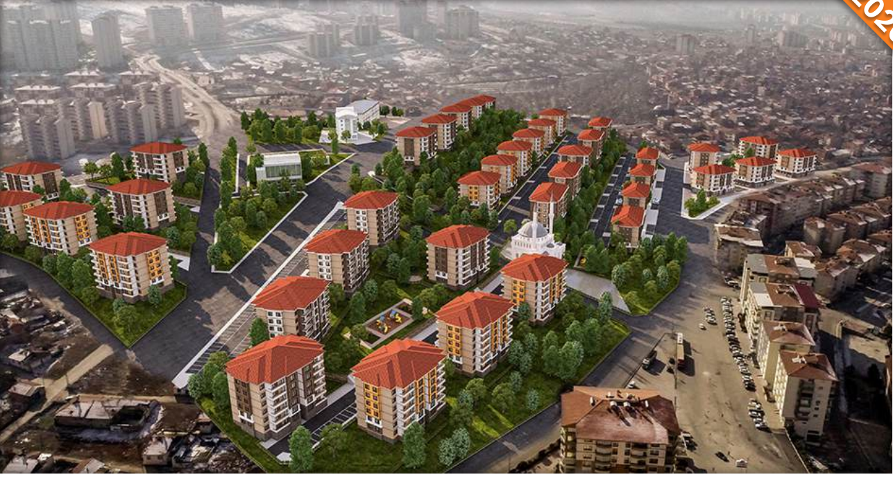
Beydağı, Malatya / Türkiye