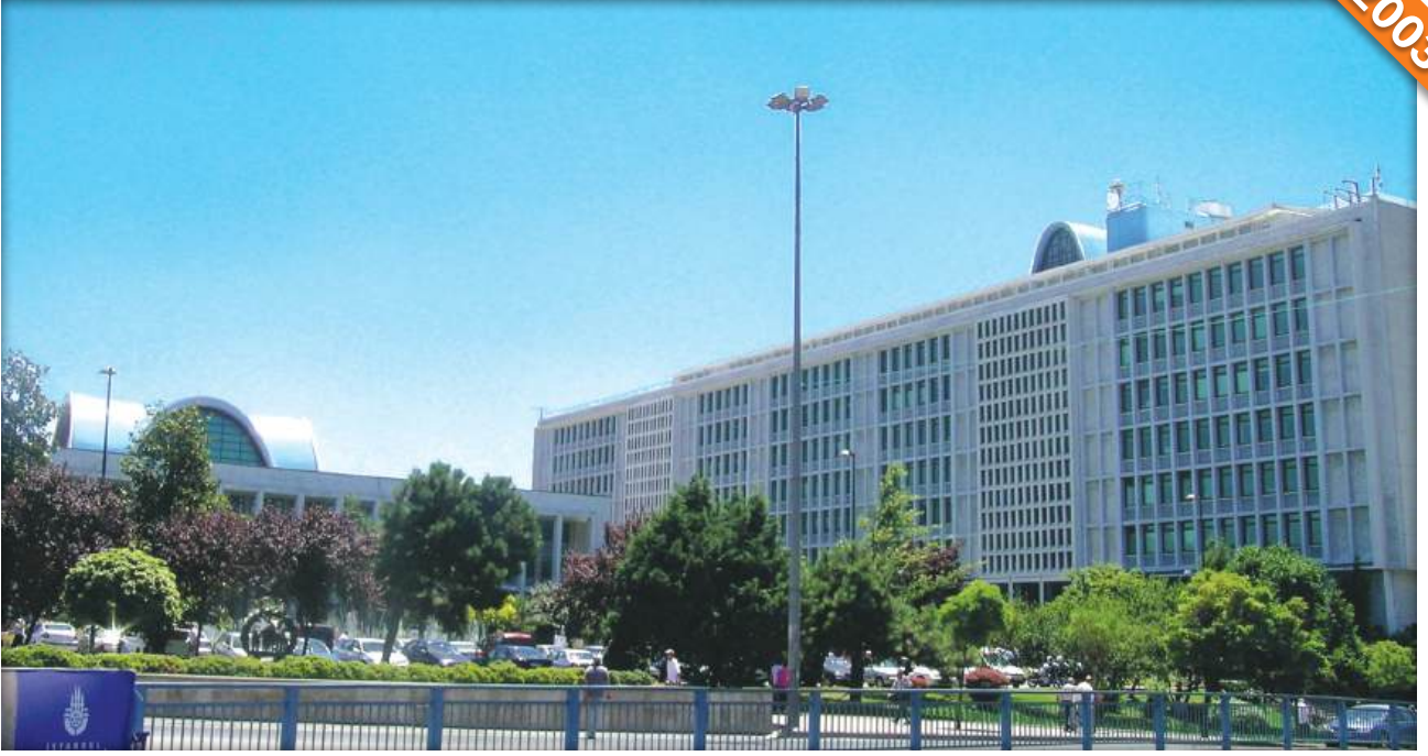
Saraçhane, İstanbul / Türkiye