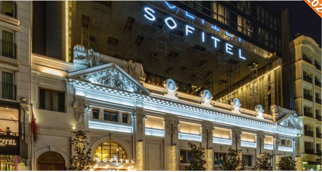
Taksim, İstanbul / Türkiye