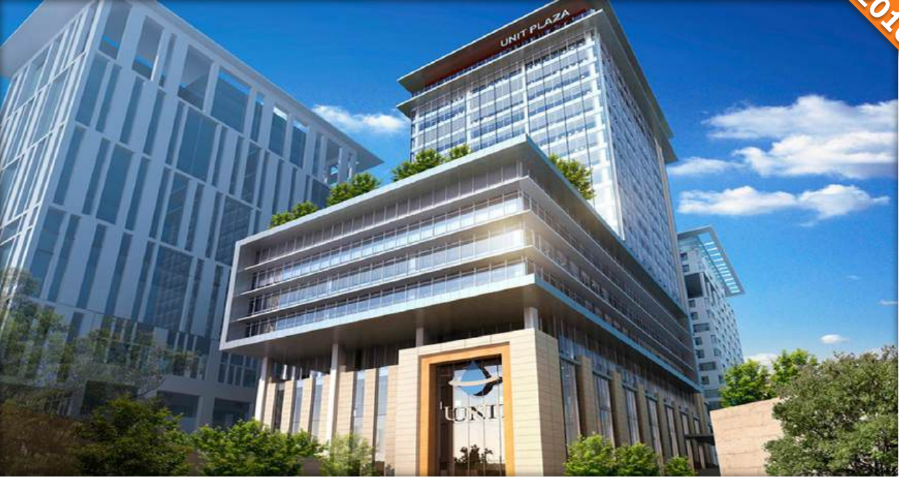
Ataşehir, İstanbul / Türkiye