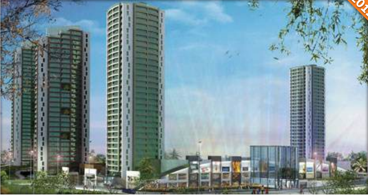
Ataşehir, İstanbul / Türkiye