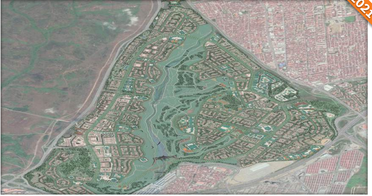
Esenler, İstanbul / Türkiye