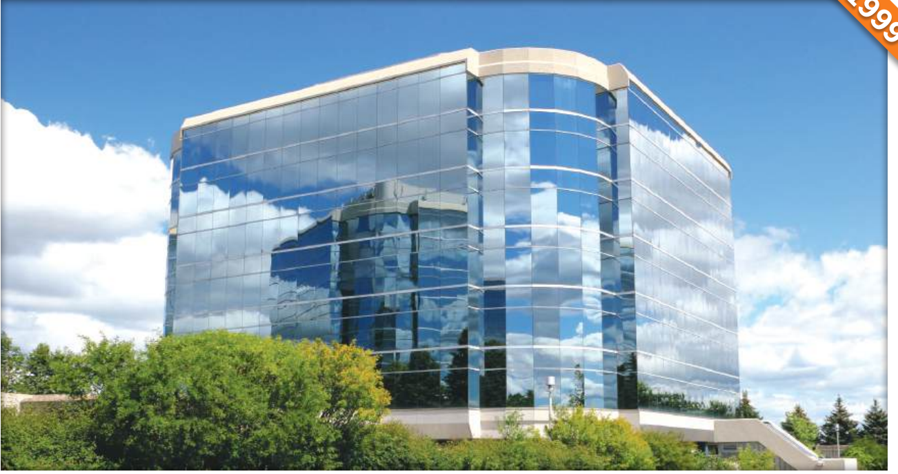
Asgabad / Türkmenistan