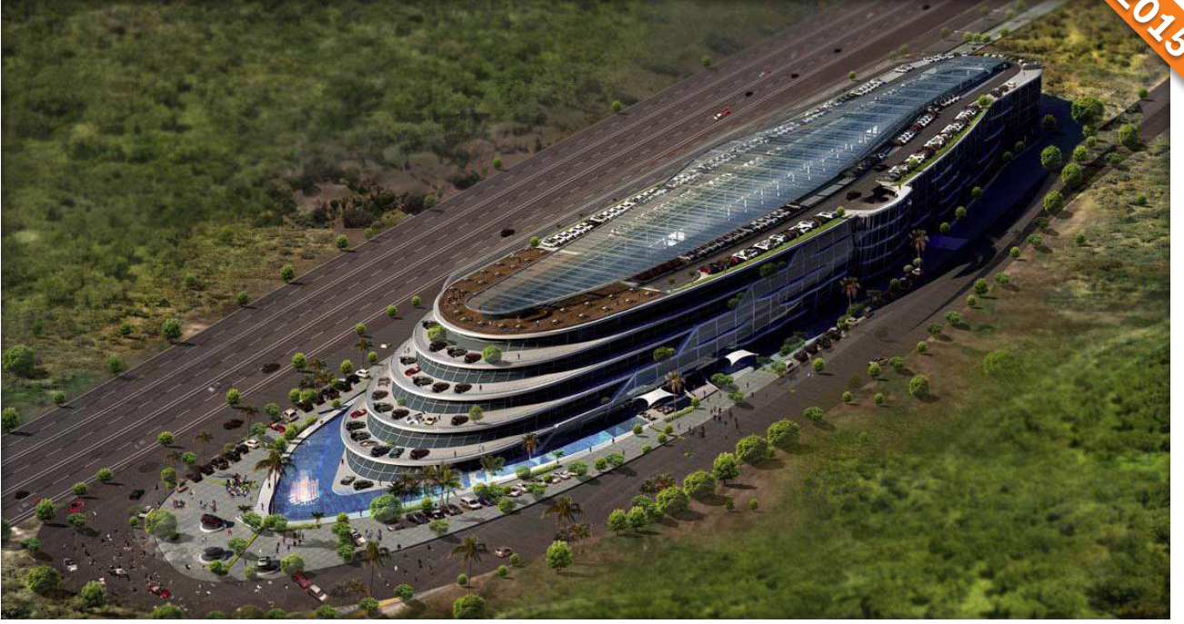
Pendik, İstanbul / Türkiye