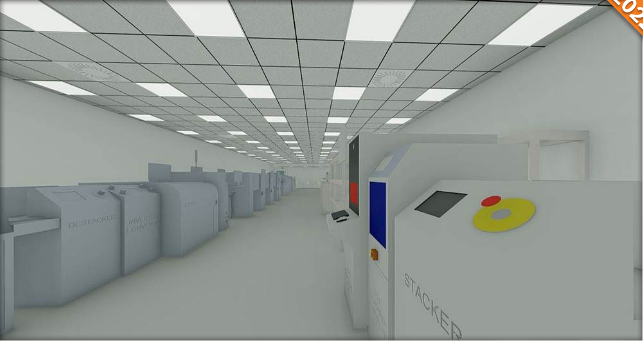
Nilüfer, Bursa / Türkiye