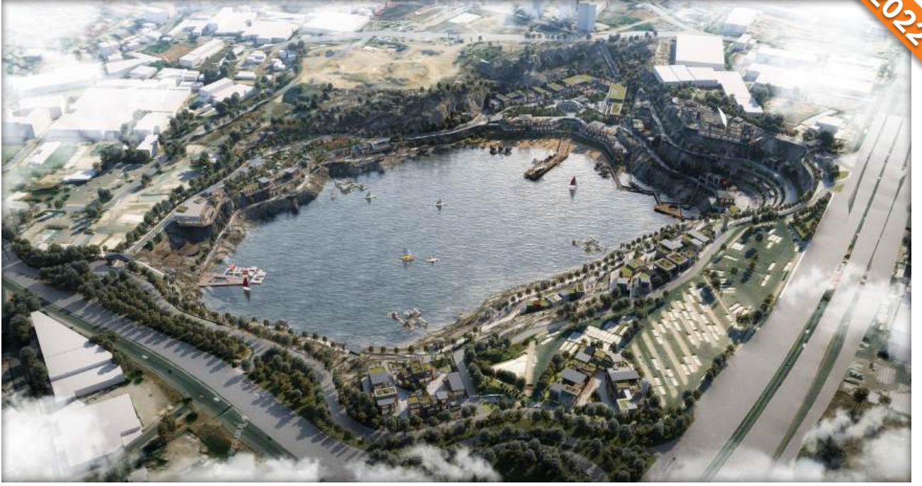
Kartal, İstanbul / Türkiye