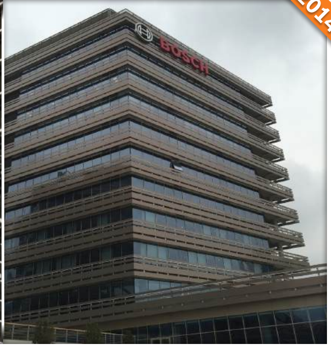
Küçükyalı, İstanbul / Türkiye