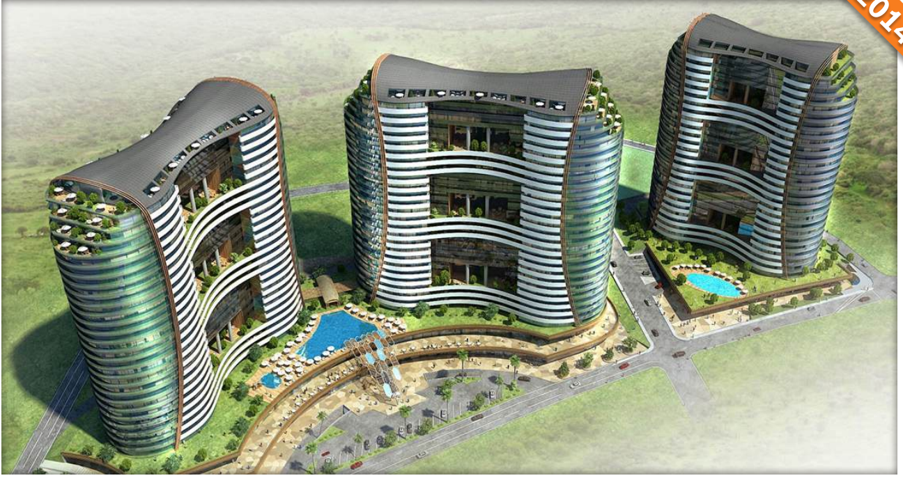
Kadıköy, İstanbul / Türkiye