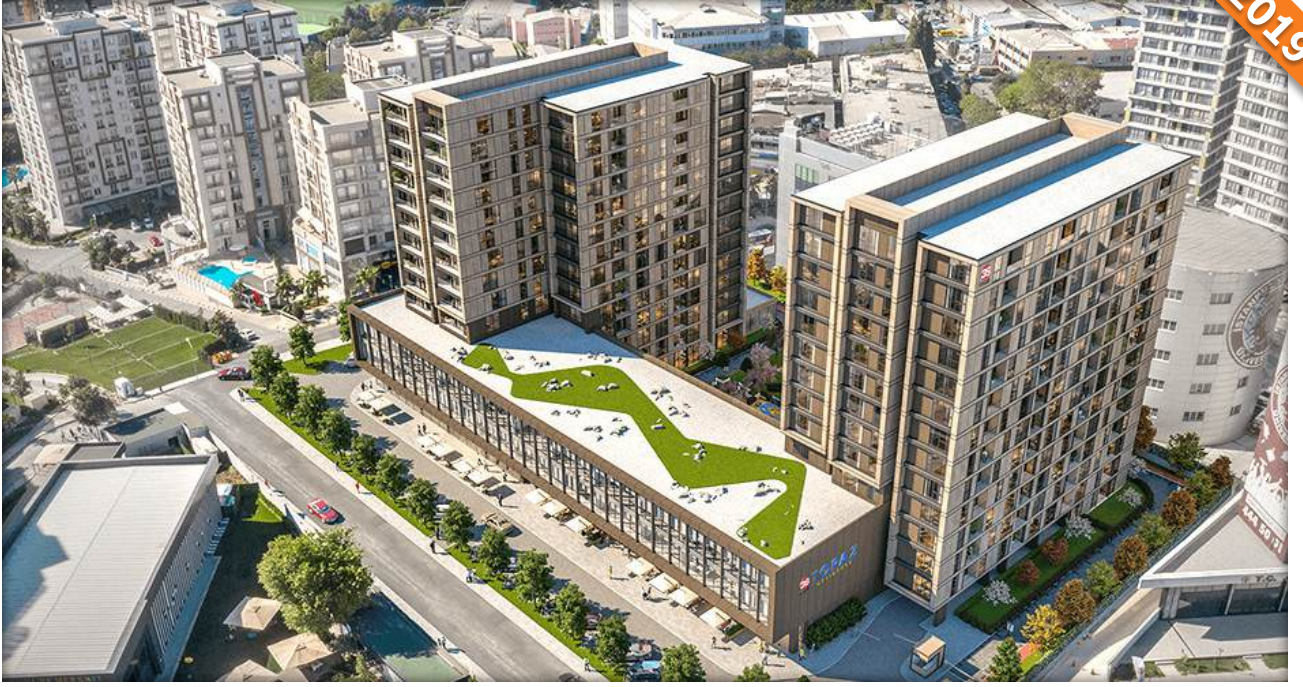
Zeytinburnu, İstanbul / Türkiye