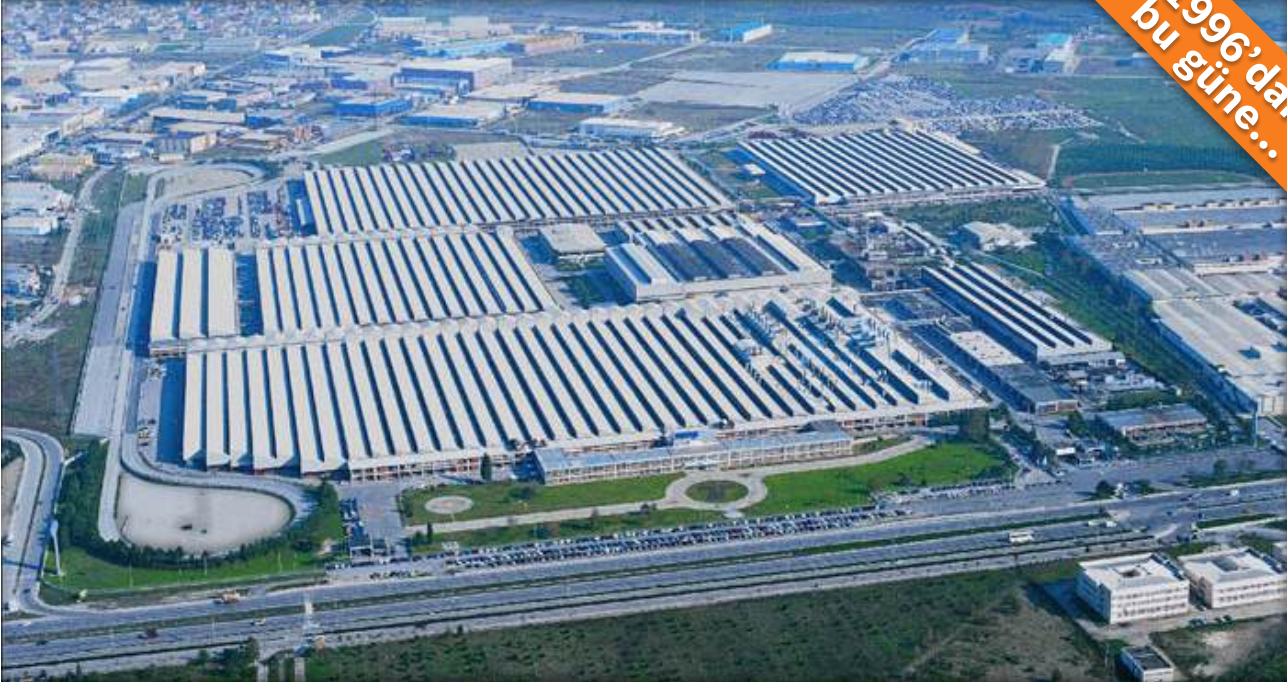
Bursa / Türkiye