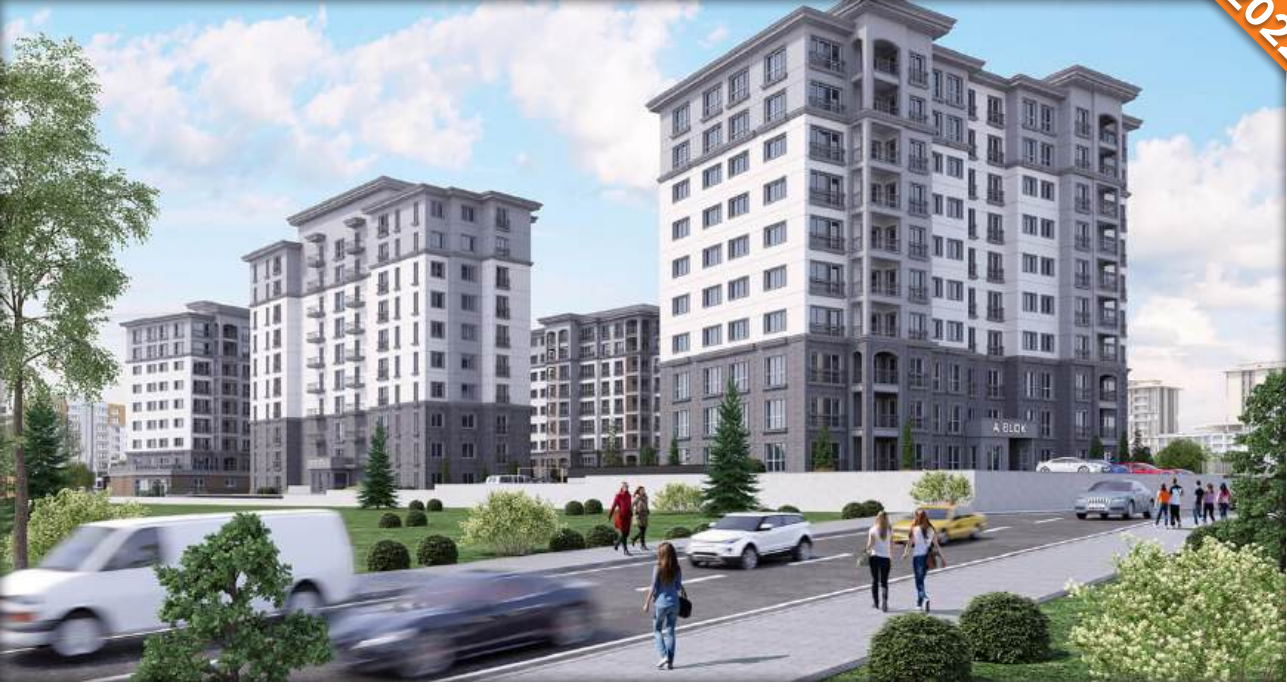
Başakşehir, İstanbul / Türkiye