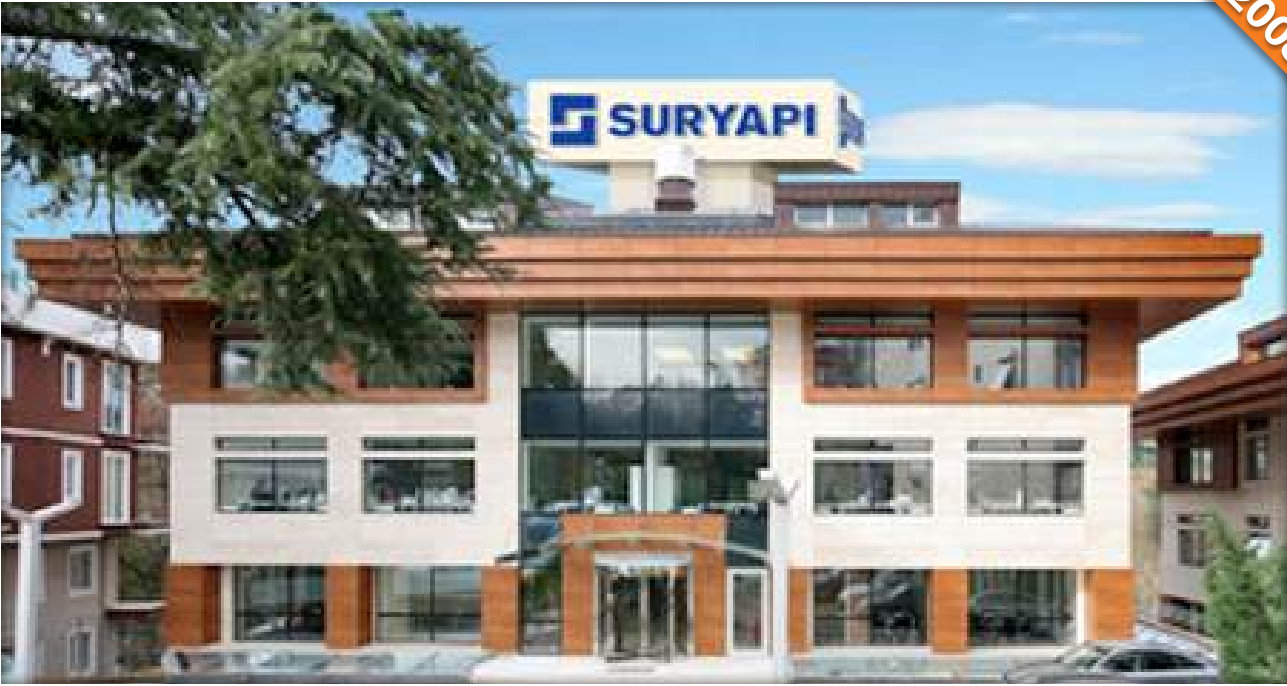
Üsküdar, İstanbul / Türkiye