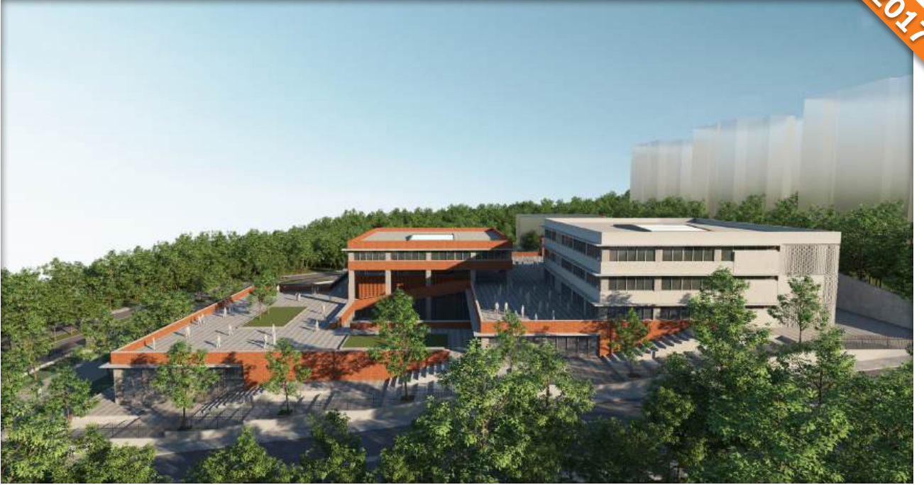
Başakşehir, İstanbul / Türkiye