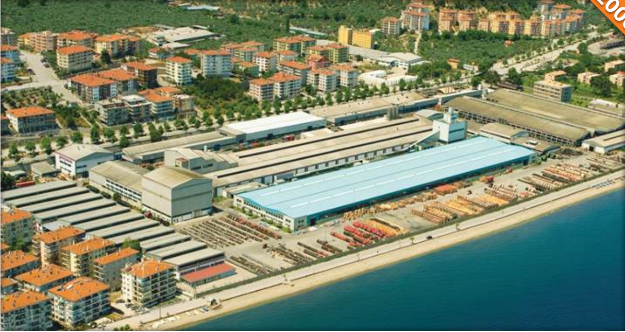
Mudanya, Bursa / Türkiye