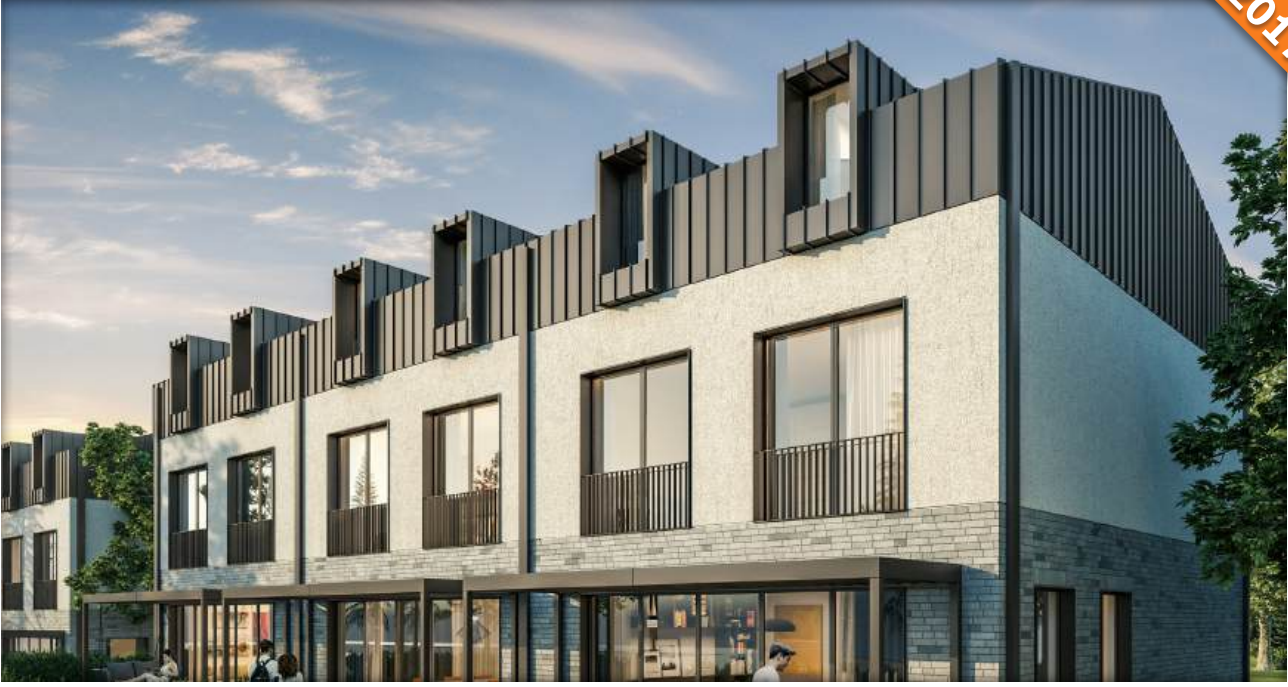
Zekeriyaköy, İstanbul / Türkiye