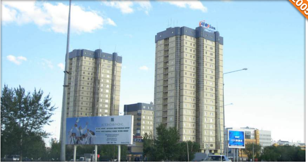
Astana / Türkmenistan