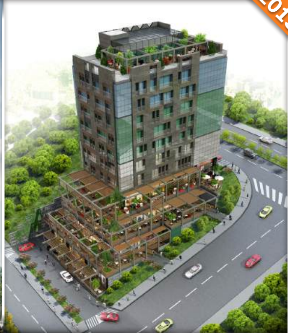
Ataşehir, İstanbul / Türkiye