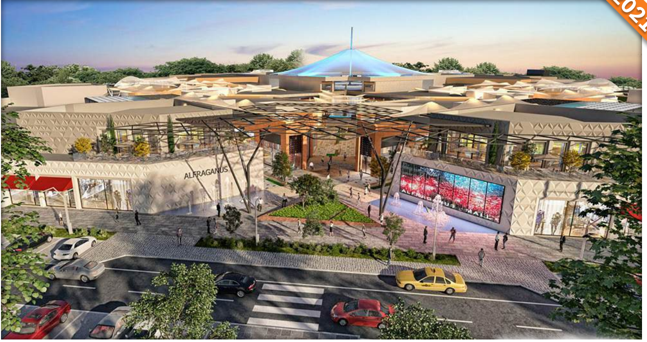
Tashkent / Özbekistan