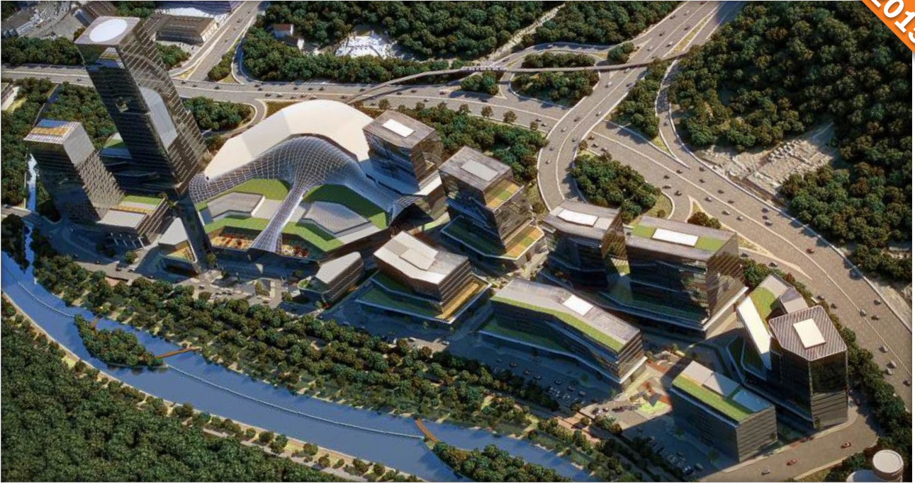
Şişli, İstanbul / Türkiye