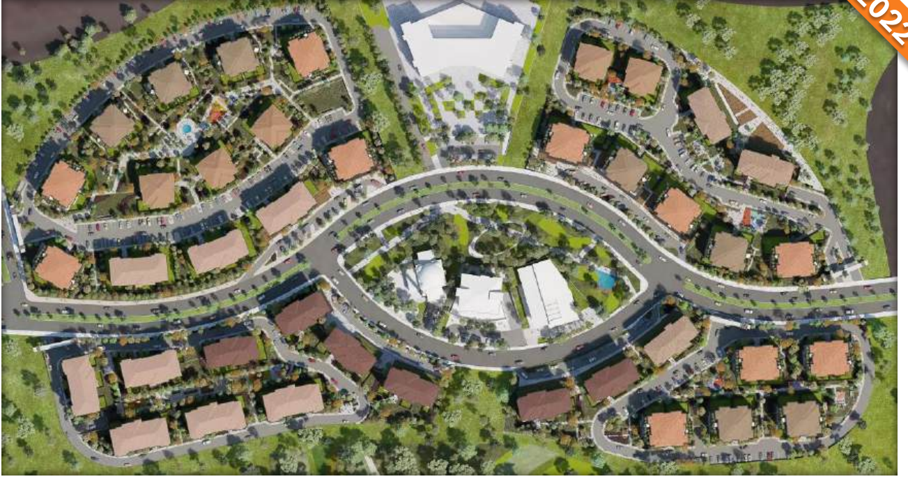
Avcılar, İstanbul / Türkiye