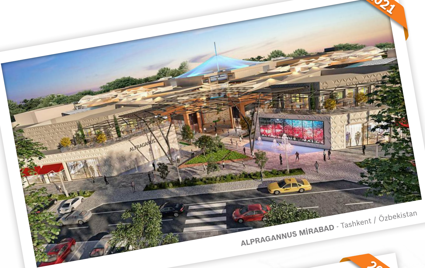
ALPRAGANNUS MİRABAD - Tashkent / Özbekistan