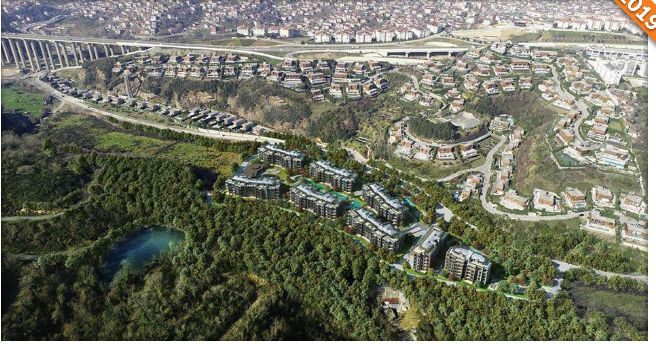
Çengelköy, İstanbul / Türkiye