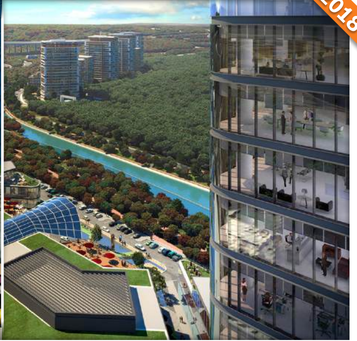
Cendere, Sarıyer, İstanbul / Türkiye