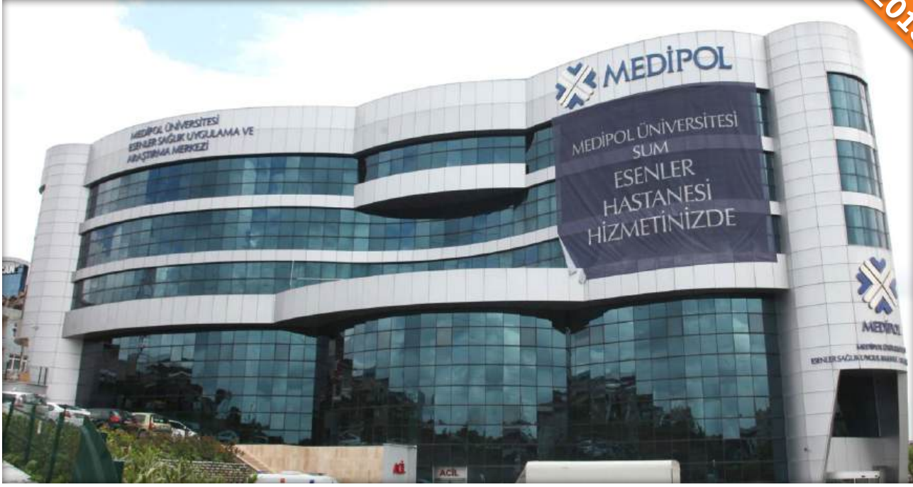
Güneşli, İstanbul / Türkiye