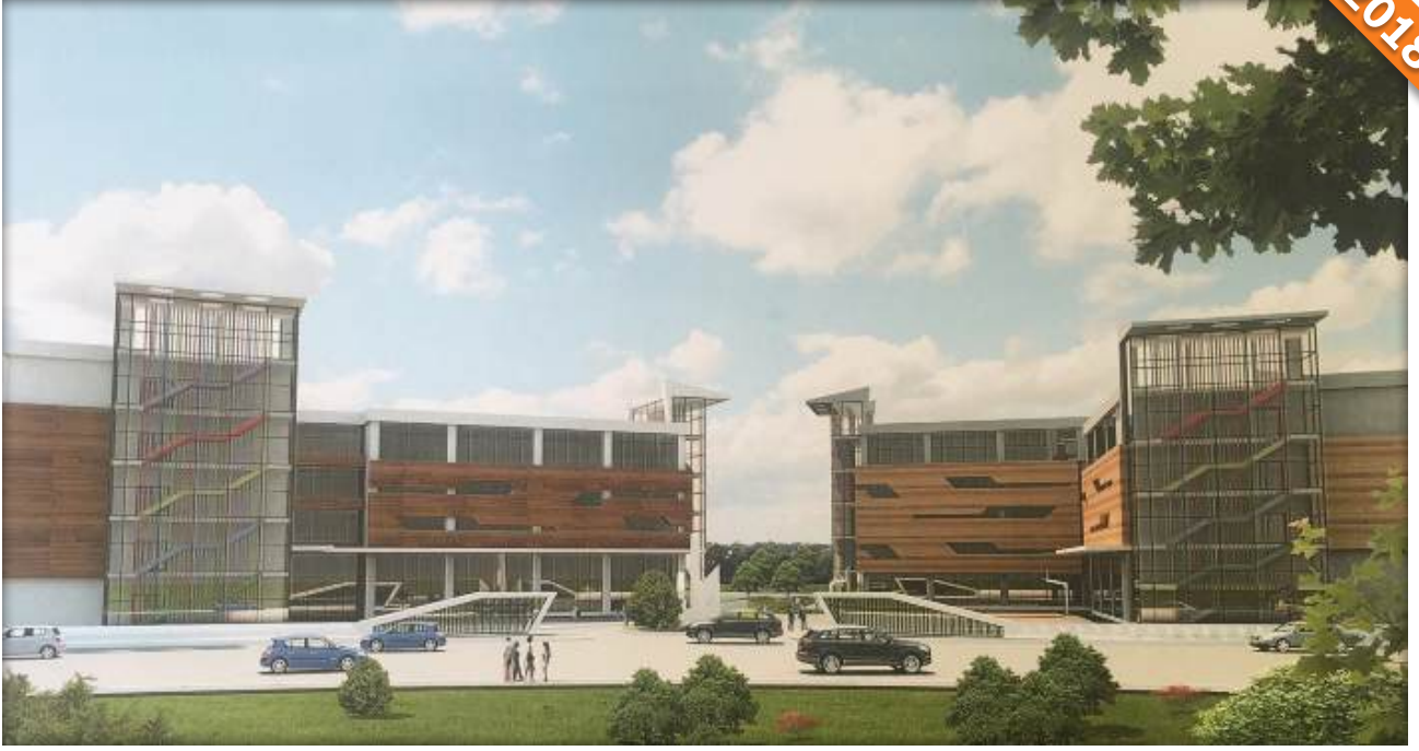
Cendere, Sarıyer, İstanbul / Türkiye