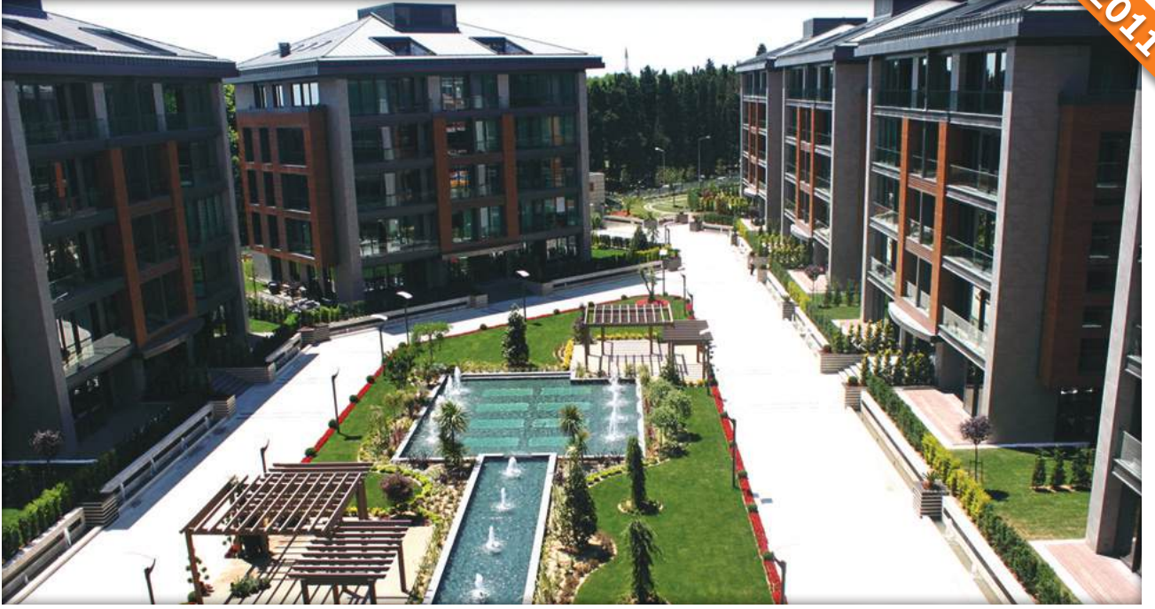
Florya , İstanbul / Türkiye