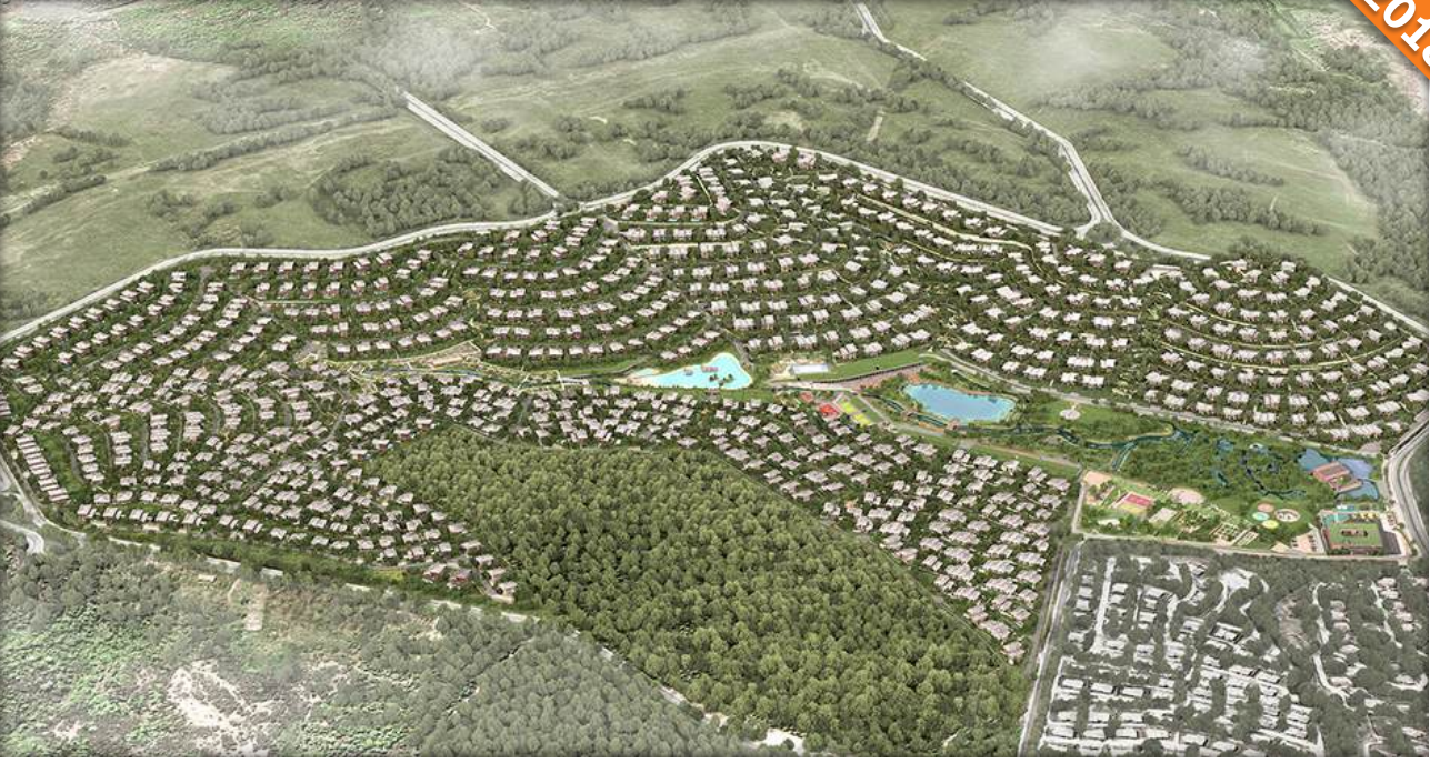
Riva, İstanbul / Türkiye