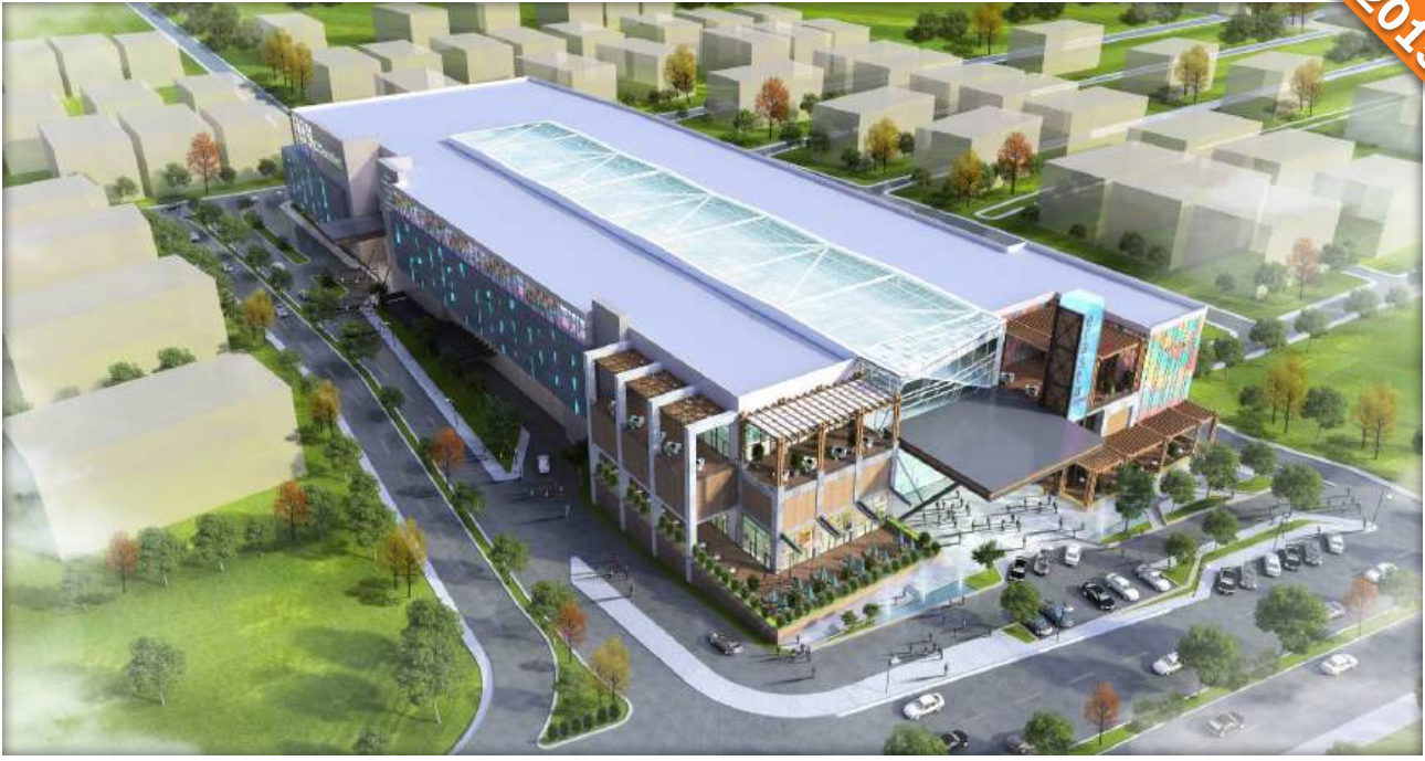
Edirne / Türkiye