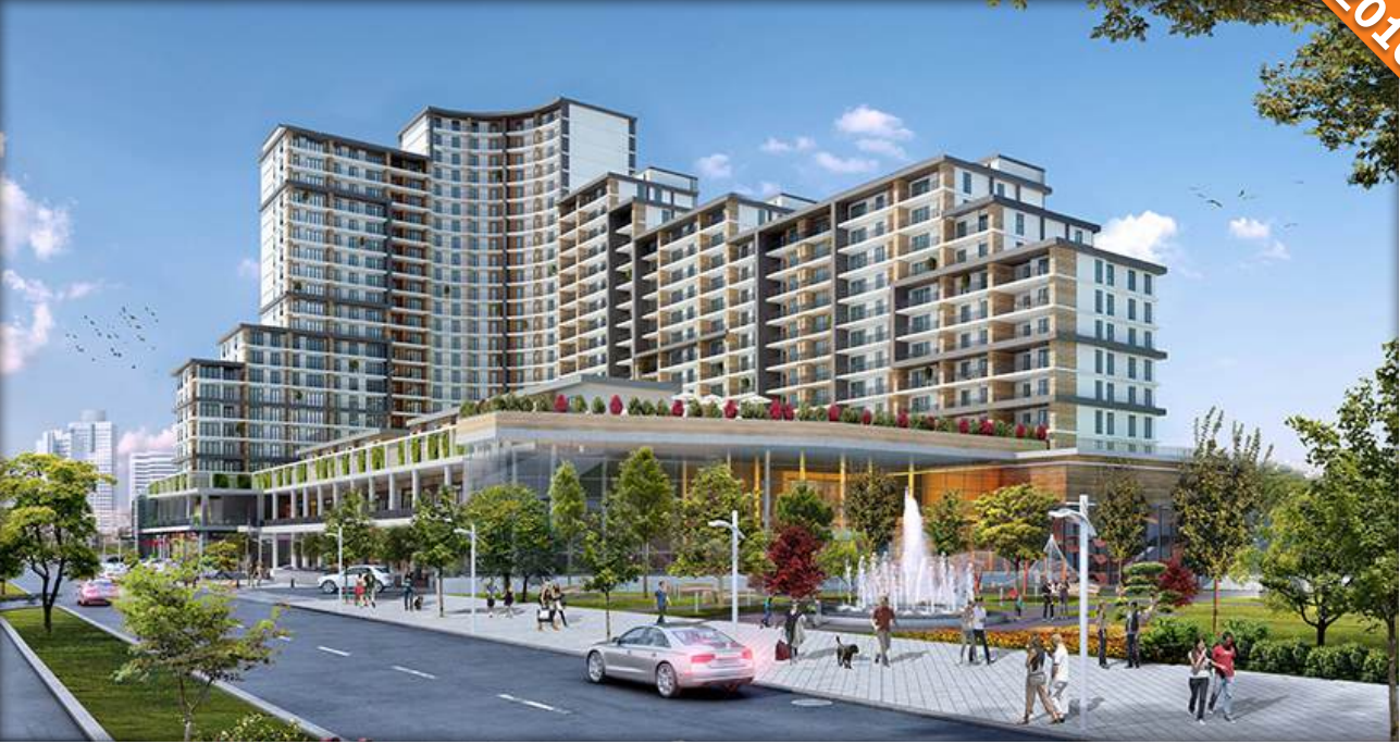
Esenyurt, İstanbul / Türkiye