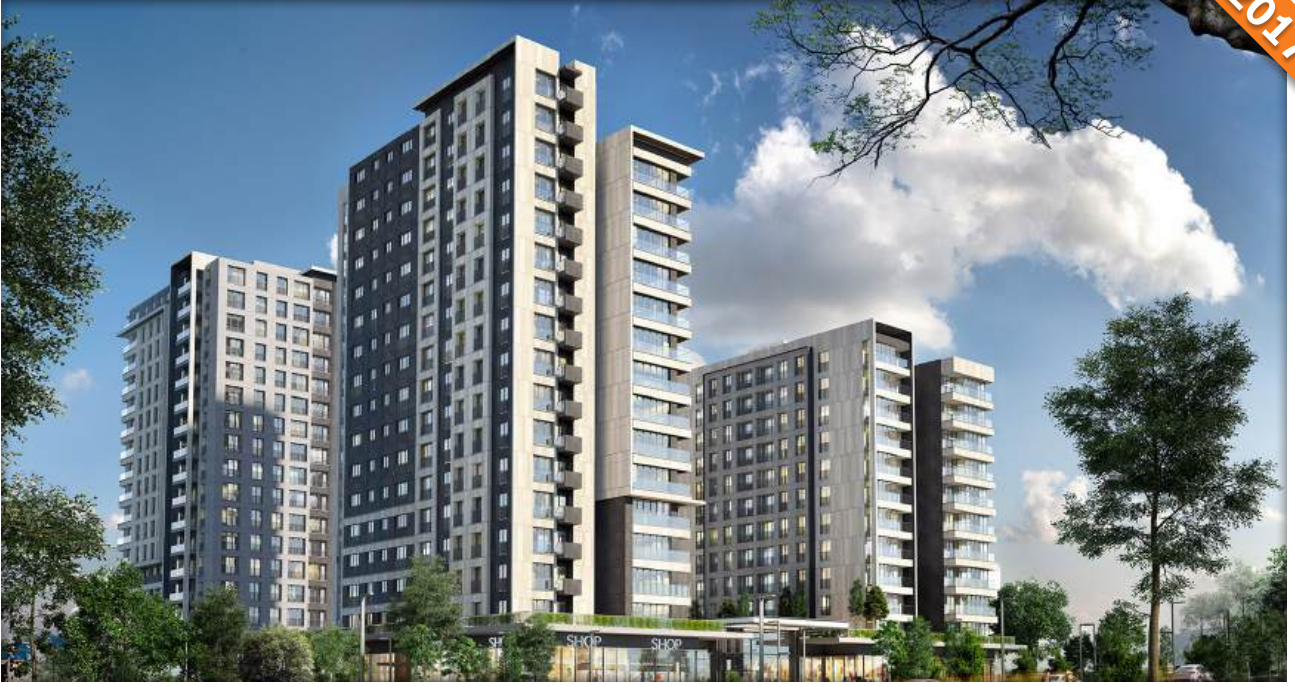
Maltepe, İstanbul / Türkiye