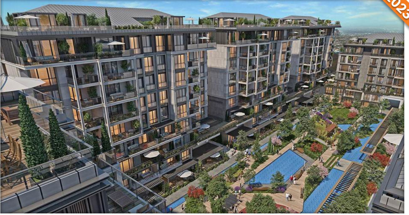
Beşiktaş, İstanbul / Türkiye