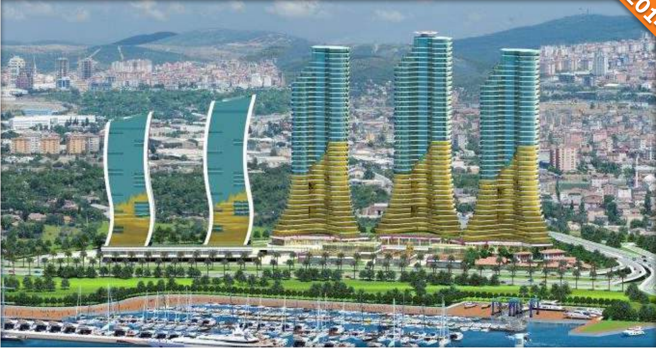
Kartal, İstanbul / Türkiye