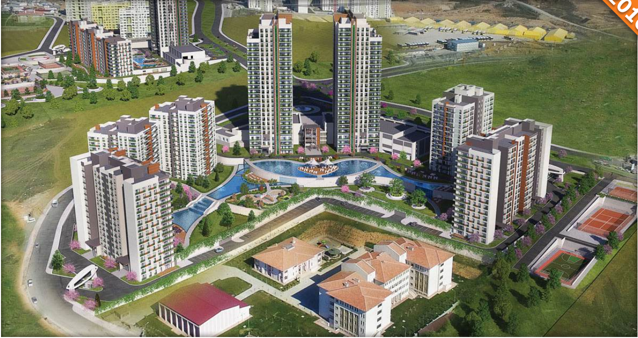
Başakşehir, İstanbul / Türkiye