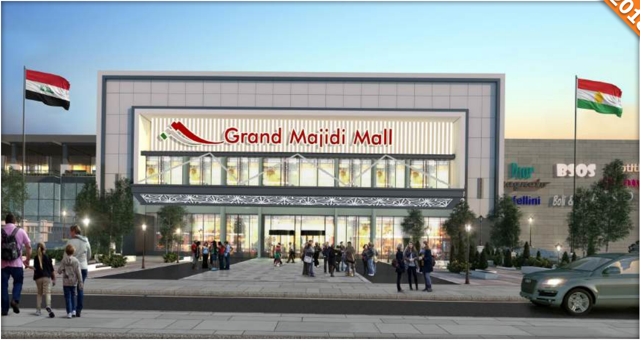
Erbil / Irak