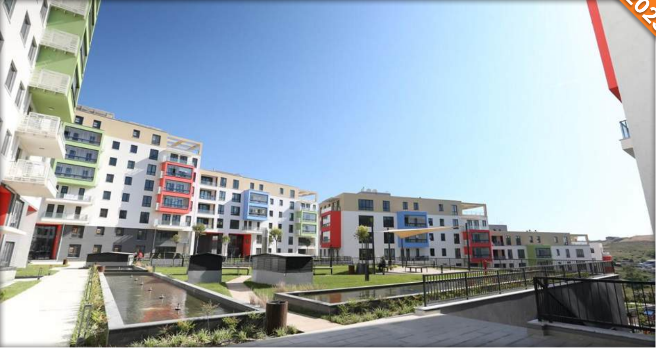
Başakşehir, İstanbul / Türkiye