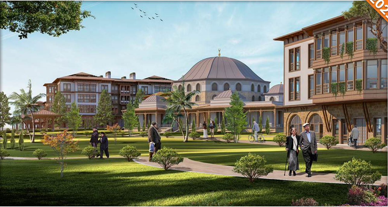
Arnavutköy, İstanbul / Türkiye