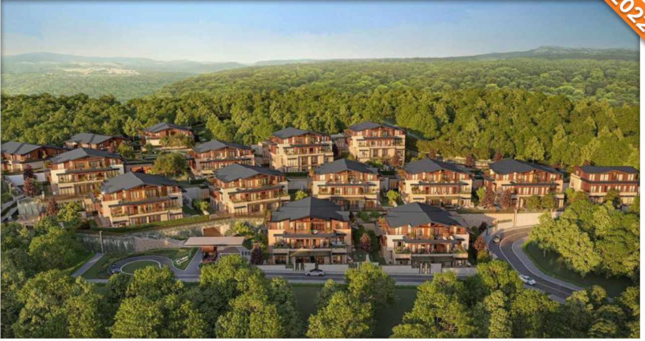
Eyüpsultan, İstanbul / Türkiye