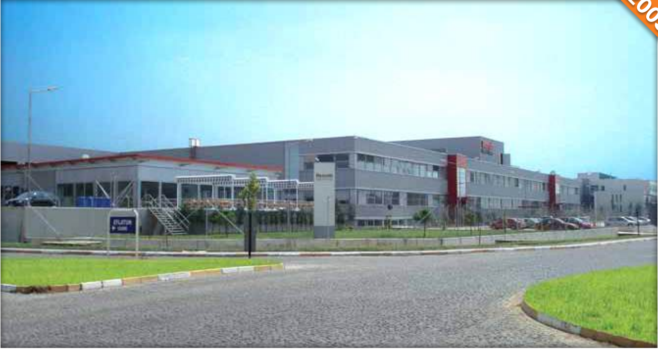
OSB Bursa / Türkiye