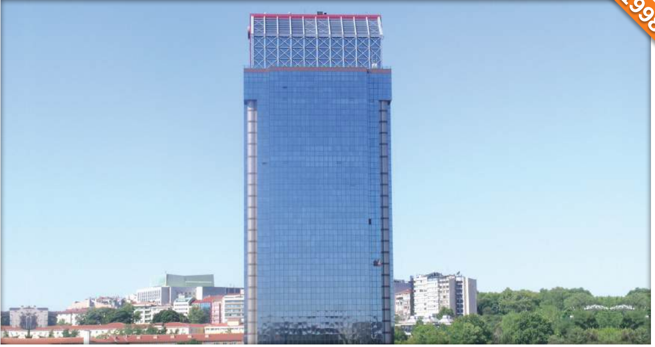
Taksim, İstanbul / Türkiye