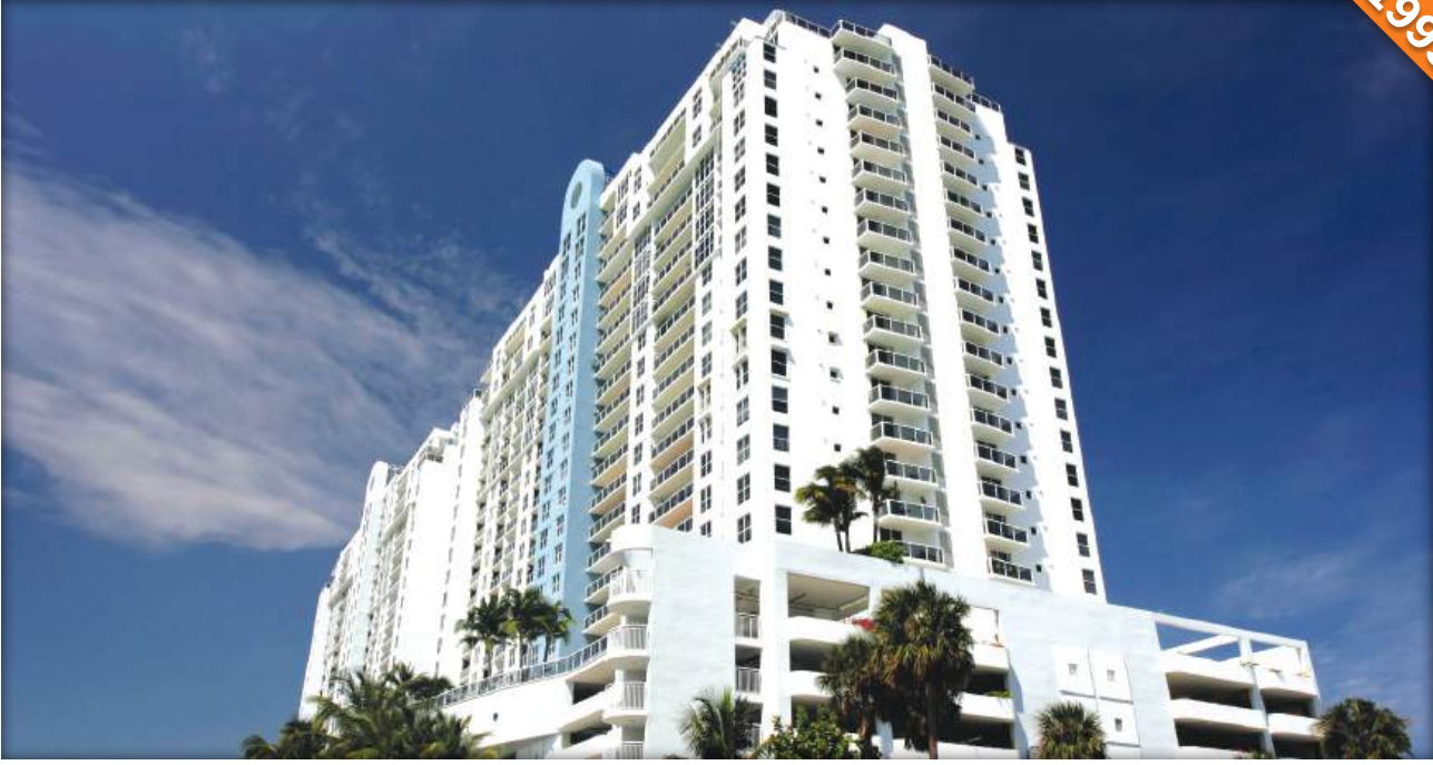
Türkmenbaşy / Türkmenistan