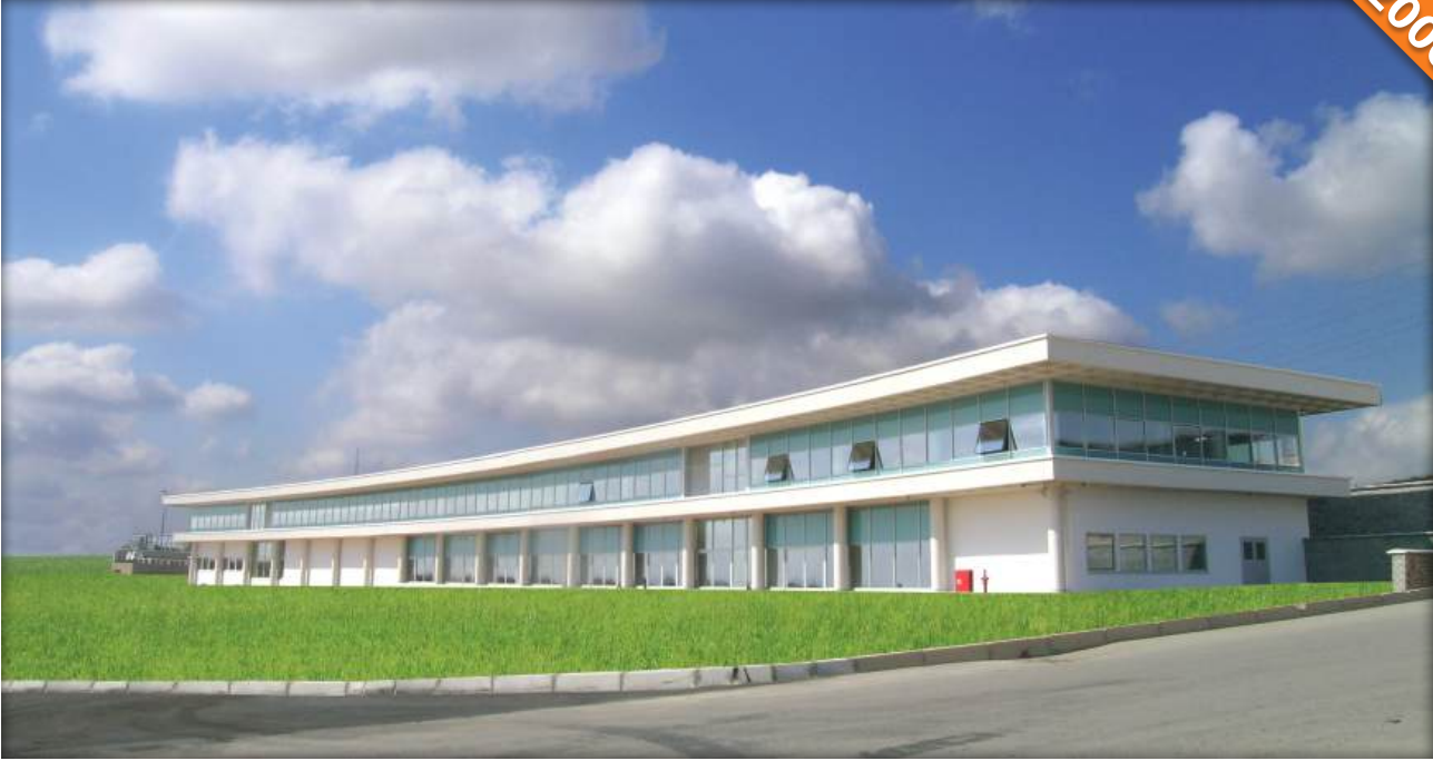
TOSB Gebze, İzmit / Türkiye