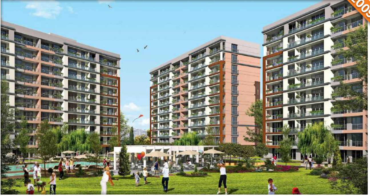
Sarıgazi, İstanbul / Türkiye