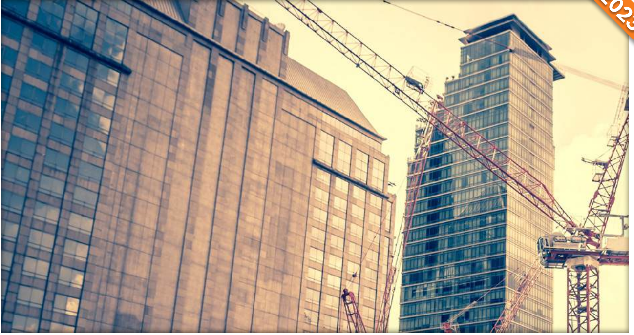
Gölbaşı, Adıyaman / Türkiye