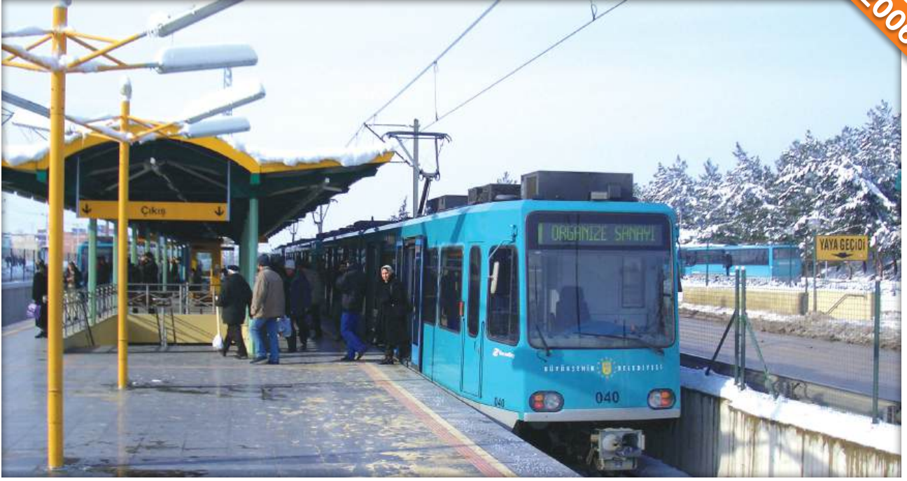
Bursa / Türkiye