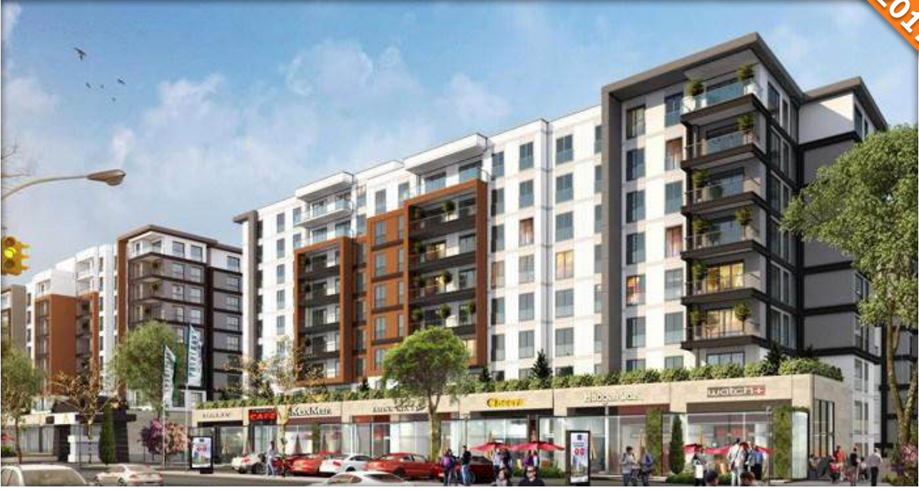
Küçükçekmece, İstanbul / Türkiye