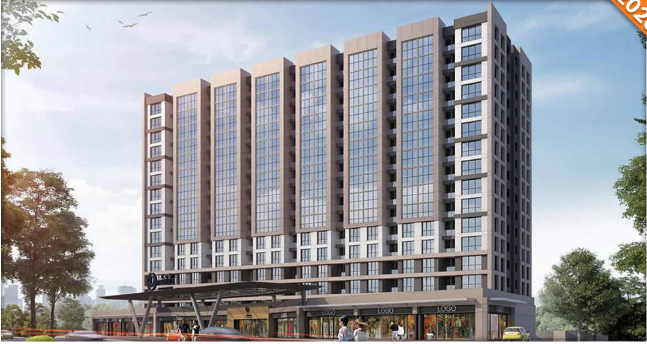
Silivri, İstanbul / Türkiye