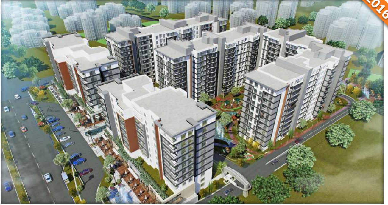
Küçükçekmece, İstanbul / Türkiye