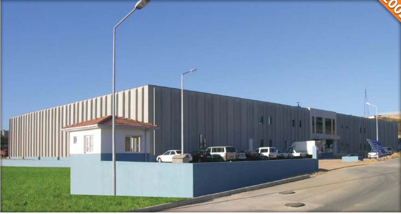
TOSB Gebze, Kocaeli / Türkiye