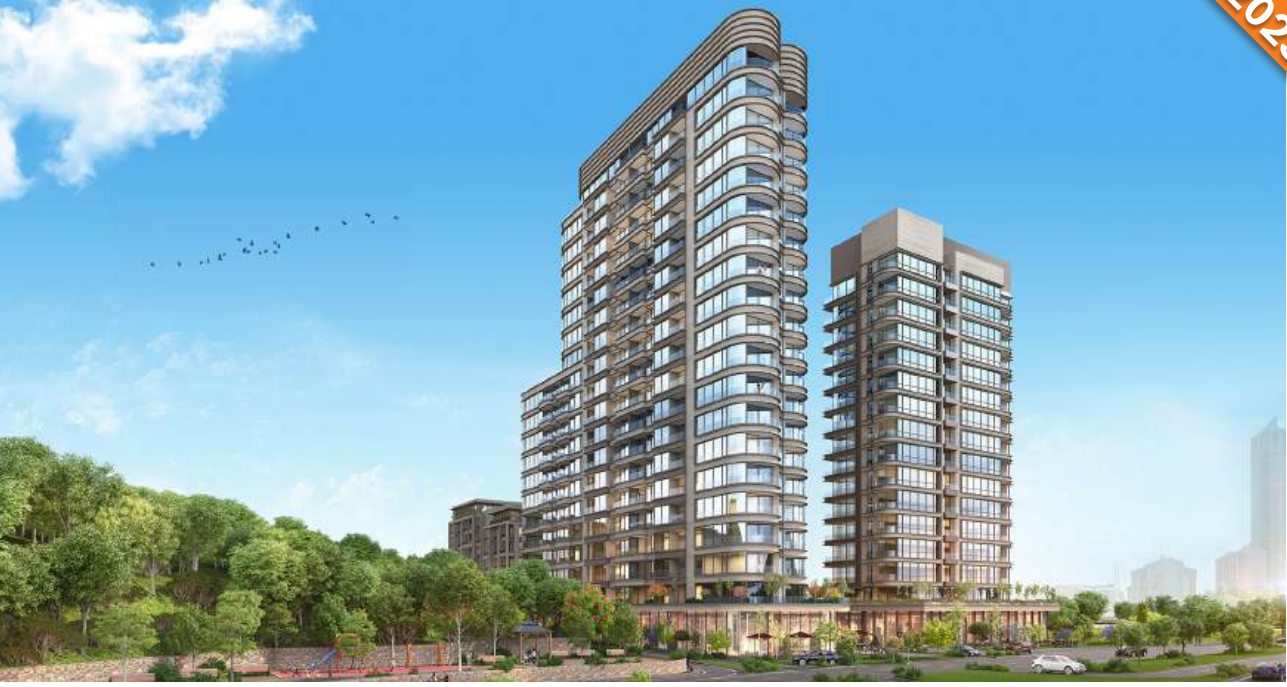
Sarıyer, İstanbul / Türkiye